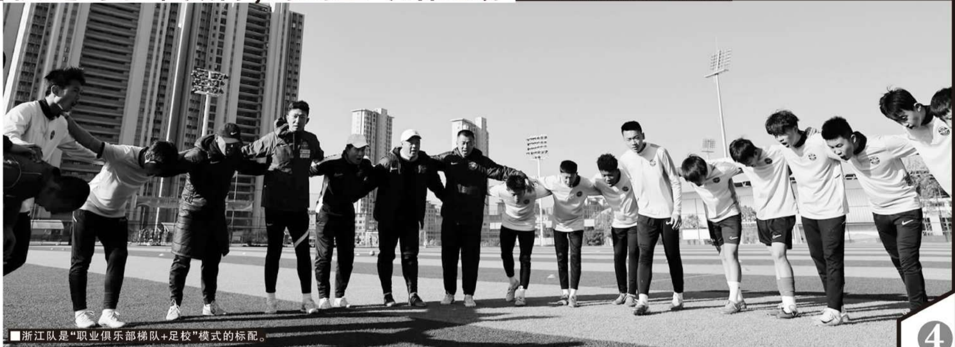
■浙江队是“职业俱乐部梯队+足校”模式的标配。