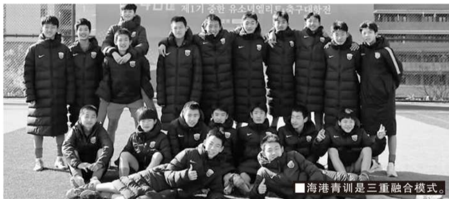
■海港青训是三重融合模式。

汉的三重融合,还是成都的四重融合,或是西安的趋于四重融合,实际上都基于当前的国家政策,是有为政府通向有效市场的模式。