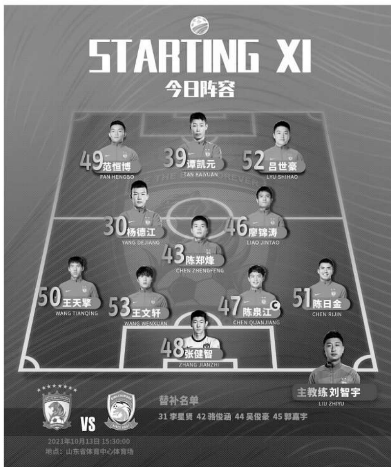
■中超报名名单中的7名年轻球员加上预备队中抽上来的8人,广州队勉强凑齐了一套足协杯阵容。

数,连球队的替补席也坐不满,但由于今年中超球队的足协杯报名名单来自于中超的名单,就算临时开了一个特别转会窗,也只能补报与入选国脚人数相同的球员,无法像上个赛季因亚冠赛程“撞车”时,能大幅启用预备队的年轻球员那样,所以广州队只能从那支经历亚冠洗礼的预备队中挑选8名球员,加上原