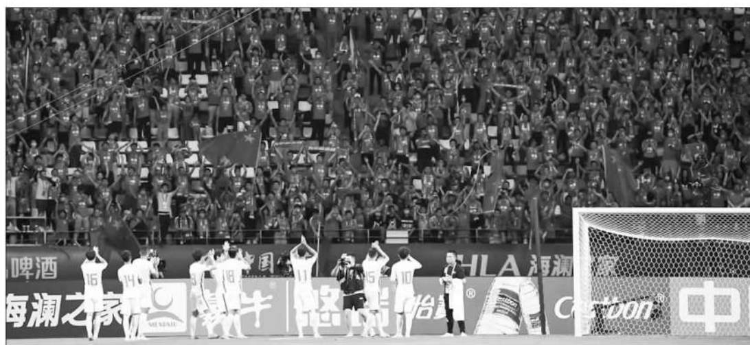
▲5月的40强赛主场战令人难忘。11月的两场12强赛争取主场作战,对国足很重要。

分析也告诉我们,晋级2022年世界杯几乎是不可能的事情。但是,这并不是国足不努力的理由。就像此次西亚之行,如果没有国足3比2击败越南的那场胜利,我们可以想象中国足球会遭遇怎样的抨击,对于中国足球的发展又会产生多么恶劣的影响。