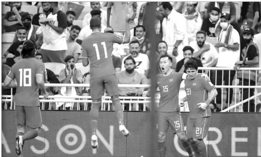
▲10月13日12强赛对沙特之战,国足能扳回两球意义重大。

第二个基本的事实是:国足的备战出现了严重的问题。问题包括且不限于:首先,此前的联赛安排有问题——其实这一点是可以改变的,因为这种联赛安排也和国家队的要求有关;但更多的问题无法改变,比如第二