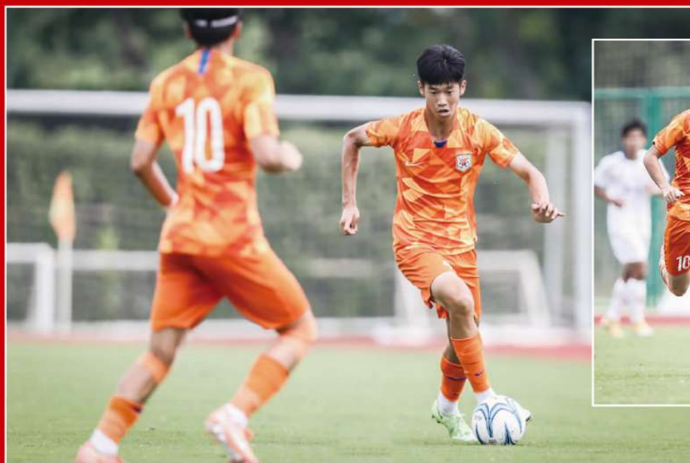
鲁能泰山足校U17A队在比赛中。