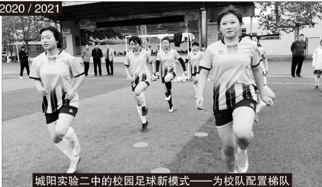
城阳实验二中的校园足球新模式——为校队配置梯队