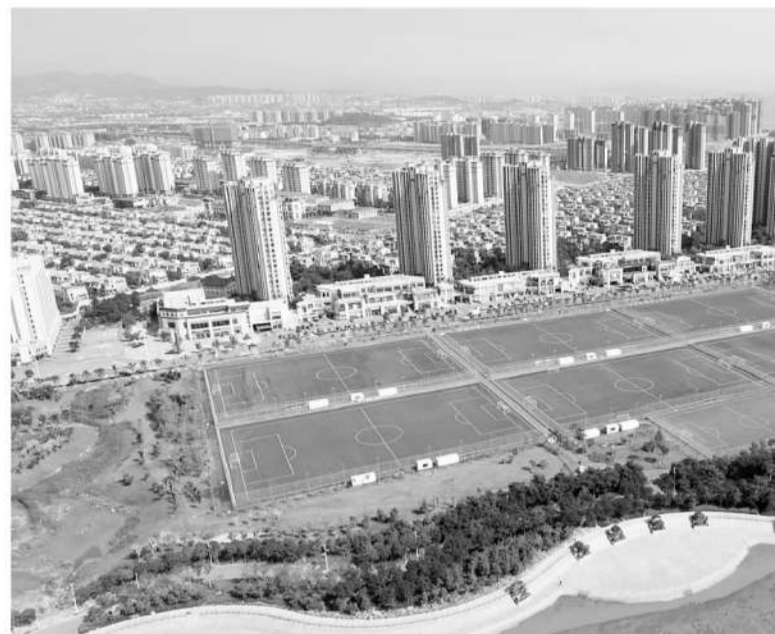
白沙湾基地是城阳区“打造青少年足球名城”的重点建设项目。

不难发现，足球的发展在顶层设计方面让人欣慰，城阳足球的战略地位之高更是让人惊叹，这一切都让城阳的足球发展再一次进入了快车道。