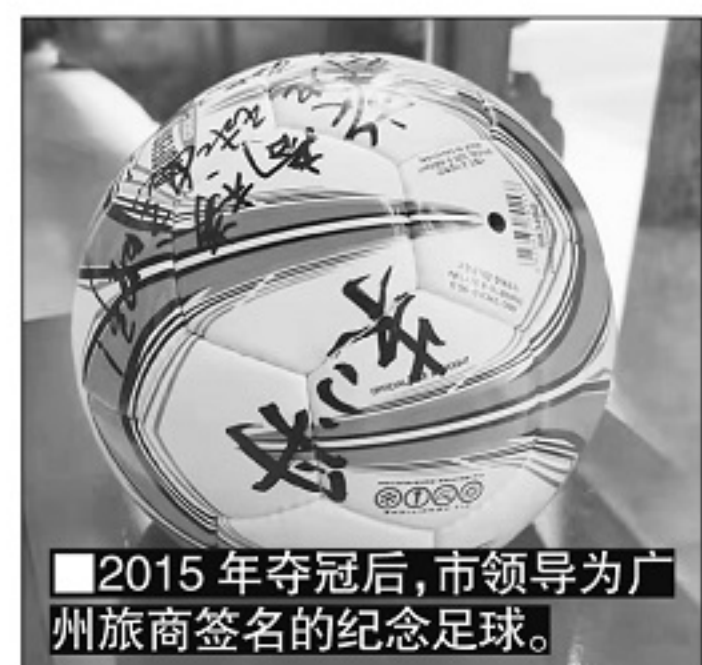
■2015年夺冠后，市领导为广州旅商签名的纪念足球。