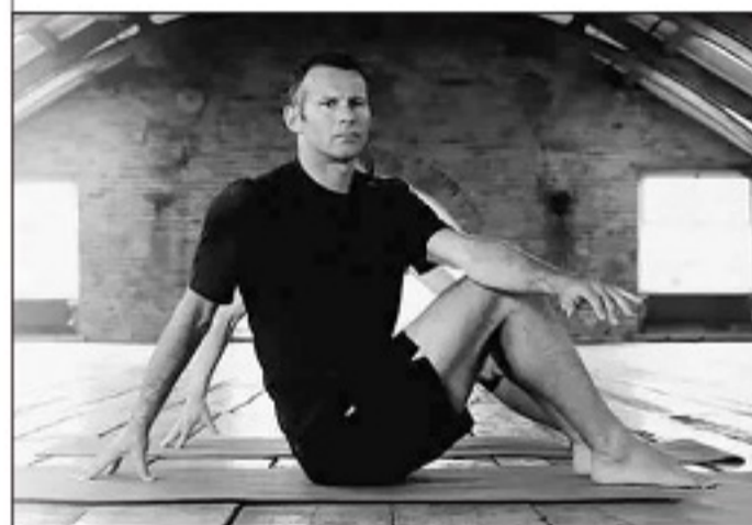
■练瑜伽延长了吉格斯的运动寿命。

弗里德尔曾在加州大学洛杉矶分校的篮球队收到NCAA联盟的邀请,此外还擅长冰球和网球。但他拒绝了可能进入NBA的未来,因为他更热爱足球。他能在对抗如此激烈的英超,保持如此高密度的出场次数,还能长达8年从未受伤,独特的个人训练方式是关键。弗里德尔原本预期自己会在35岁退役,但事实是他又多踢了9年的顶级联赛。