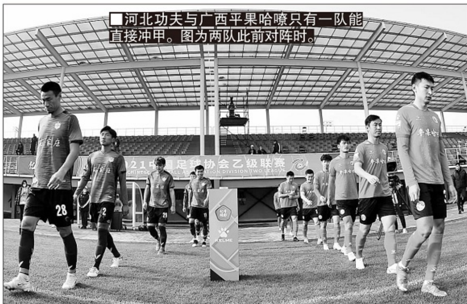
■河北功夫与广西平果哈嘹只有一队能直接冲甲。图为两队此前对阵时。

所以, 这两场比赛, 事关冠军之争, 也事关直接冲甲名额之争。争夺冠军方面, 青岛海牛只要能够赢球或者战平, 即可以确保; 如果输球, 则要看河北功夫的成绩, 如果青岛海牛输球, 河北功夫赢球, 那么2021赛季的中乙冠军将归属河北功夫——在双方冲甲组的比赛中, 河北功