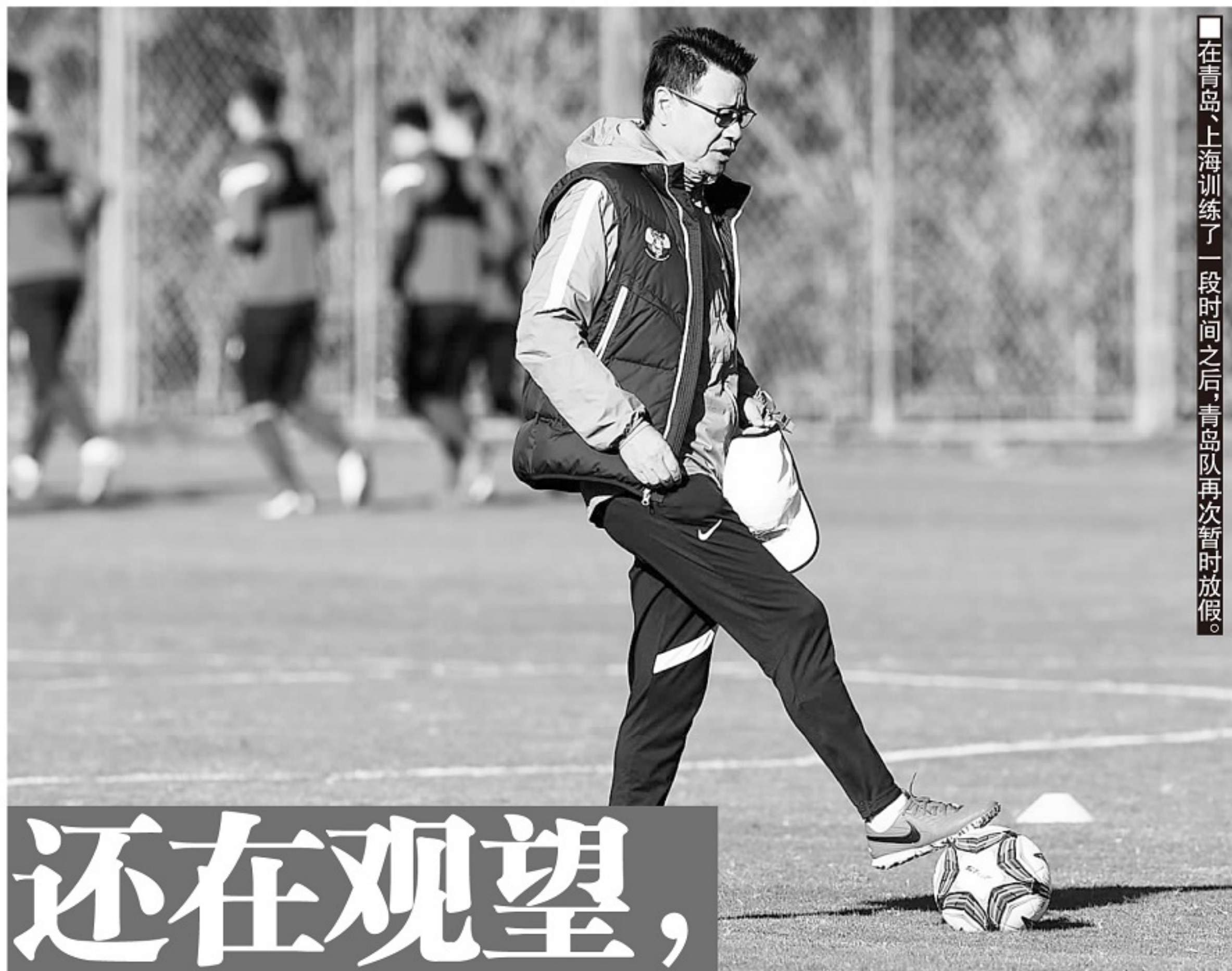
在青岛、上海训练了一段时间之后,青岛队再次暂时放假。

青岛队目前薪资发放情况是这样的,大部分队员拿到了1月和2月的工资,2月以后基本上没怎么发工资了。队员密切关注一些球队公开讨要薪资的结果,作为一个参考。