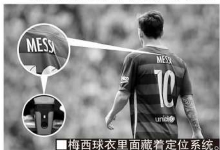
■梅西球衣里面藏着定位系统。

Sports 体育定位系统,之前曾从一个主要的欧洲客户获得重要的积极数据:在使用该系统后,这个俱乐部当赛季受伤总次数从44次降到22次。重要的是,球员们对这些体育定位系统的观念,也在发生变化。从最初可能侵犯个人隐私的抵触,但实际使用后的积极,推动了这项科技商业化的加速。不少球员喜欢在训练中比赛跑得更快,实时的身体机能数据成为球员之间相互竞争的另一个“赛场”。