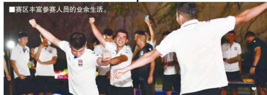
■赛区丰富参赛人员的业余生活。

此次顺利打完中甲全部赛事,中足联筹备组对四个赛区的地方政府、各级职能部门、地方体育局、协会和所有的工作人员都表示了感谢,也有很多球队给各自赛区的接待方用不同的方式表达了感激之情。中国足球在最艰难的时刻,体现的是团结、坚守与拼搏精神,只有这样才能等待寒冬早日过去,春天早些到来。