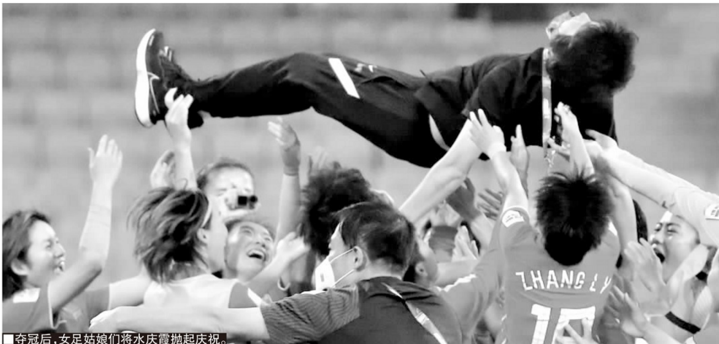
夺冠后,女足姑娘们将水庆霞抛起庆祝。

感的交流和宣泄口;对当了母亲的张馨,水庆霞建议她允许回家的时候看看自己的小孩。在水庆霞看来,和孩子分开的时间太长不好,虽然可以视频交流,但能抱抱孩子可能更好。