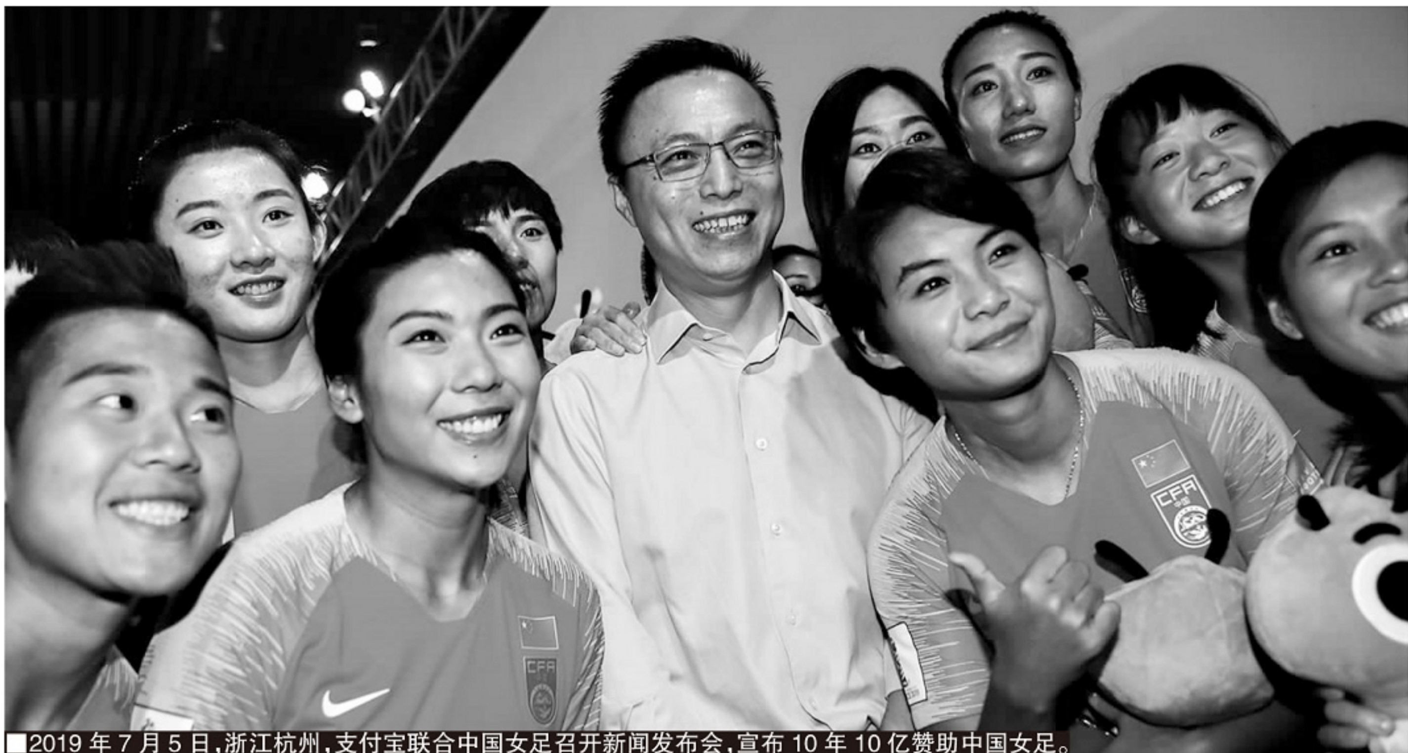
2019年7月5日,浙江杭州,支付宝联合中国女足召开新闻发布会,宣布10年10亿赞助中国女足。

也是从那一刻开始,女足队员们看到了中国女足在未来发展新的前景与希望,而时任女足领导、主要管理者们都向女足承诺了,一定尽全力让女足姑娘们去获得更多与之付出匹配的回报。而从那以后,在国队的集训开始有了按日计算的补贴,这些补贴的收入要高于一些新晋国脚在俱乐部的收入。正因如此,甚至有的女足国脚跟教练组半开玩笑地申请能否全年集训,她们保证不叫苦不喊累。全年集训显然是不现实的,毕竟女足姑娘们与俱乐部也有工作合同,也要去完成她们的联赛任务。总训练不比赛并不能达到最佳效果,道理女足国脚们都明白。但