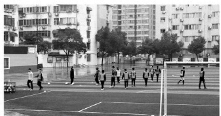
■不管晴天雨天，中午训练是合肥校园足球的一大特点。

尽管是体育传统项目学校，但是西园校区校园足球起步却很晚，直到2012年，西园校区才成立了足球社。“本社团秉承认真负责的态度，在校领导和指导老师的管理下，带领社员们提高足球技术，培养社员们的友谊和默契，并使个人有一技之长。社团一般每周进行两次活动，活动内容为训练和对抗赛交替的形式，主要由社长或指导老师进行指导和管理。”这是足球社成立之初的简介。显然，足球社的成立是为了普及这项运动，因为他们的宗旨是“让足球文化在校内传播，以球会友。足球社的目标是让每个参与进来的人享受