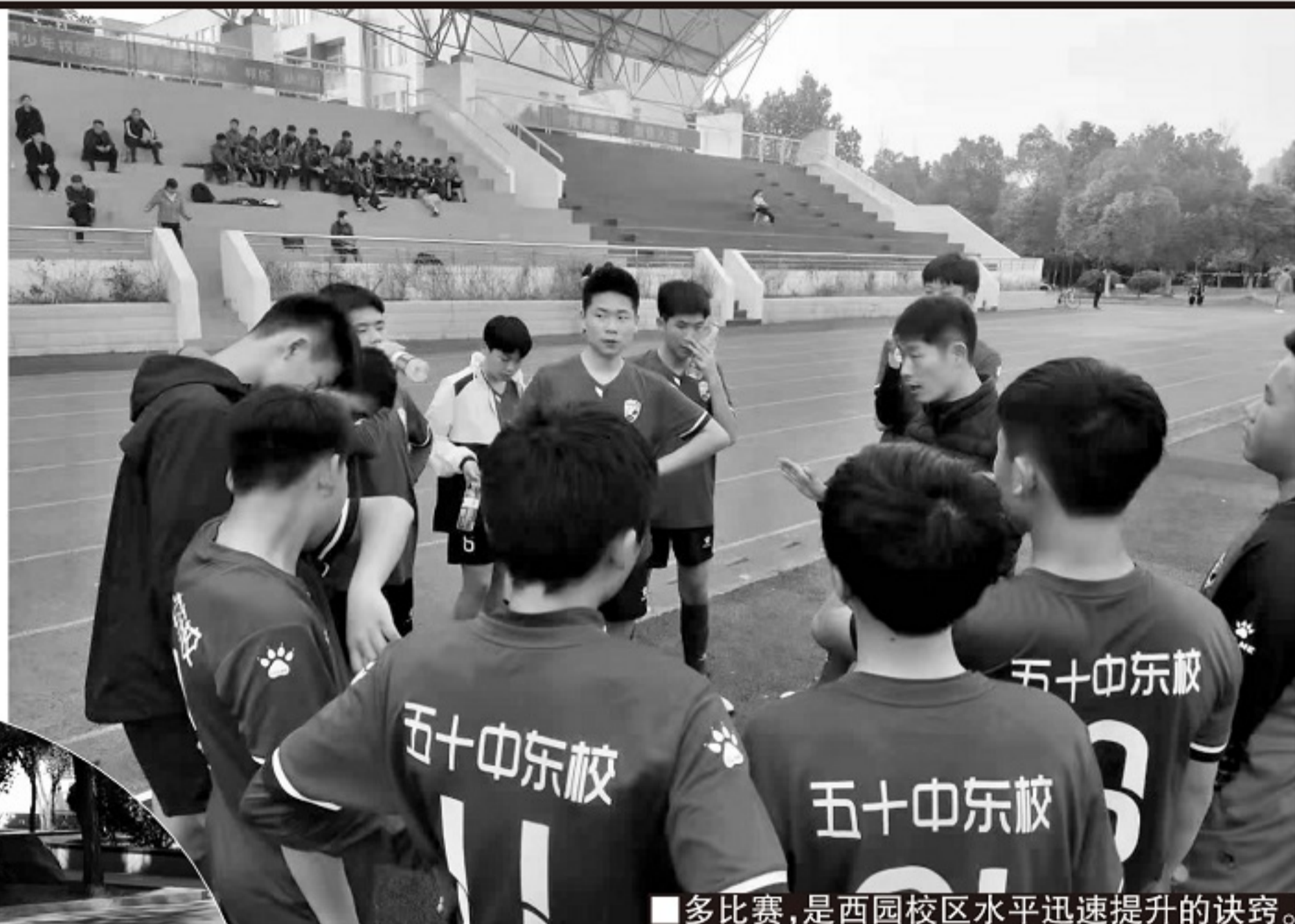
■多比赛，是西园校区水平迅速提升的诀窍。