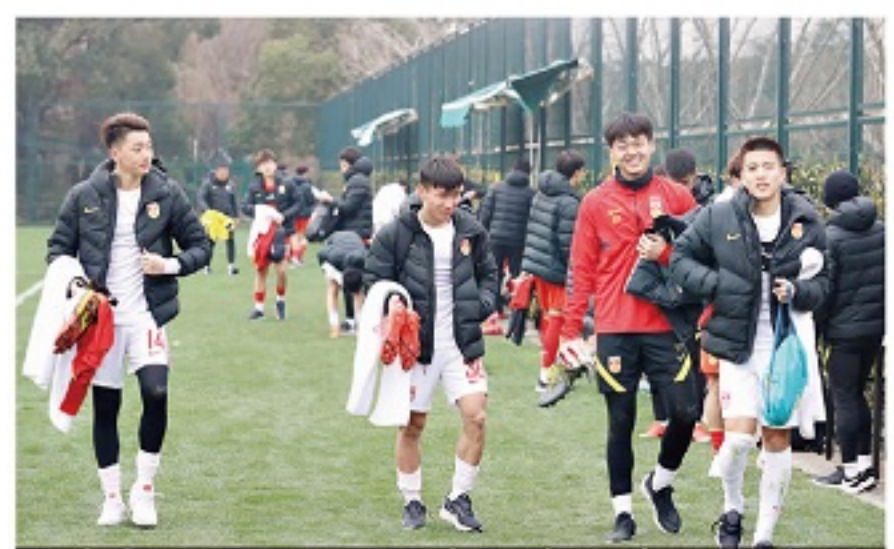
今年2月,U21国家队在上海进行集训。

了一些了解和选拔,第二期进行了精简。当然,对于第二期的名单,我们还要和各俱乐部协商,有的要参加中超和亚冠,需要做好协调。