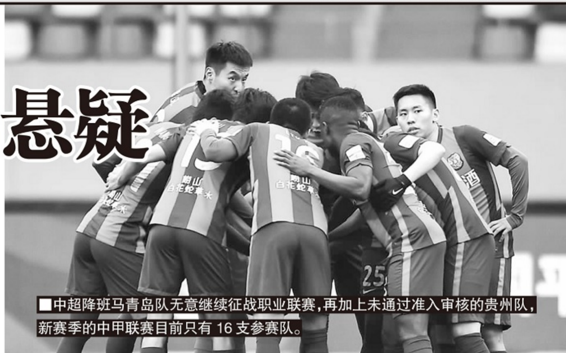
■中超降班马青岛队无意继续征战职业联赛,再加上未通过准入审核的贵州队,新赛季的中甲联赛目前只有16支参赛队。

中国足协在过去两三年里一直都是按照递补规则进行操作的,不过,有消息显示,中国足协和中足联筹备组无意于延续之前的递补政策,至少目前的消息显示,中甲联赛很可能由此从18支球队缩小到16支球队,这就是引发了4家中冠