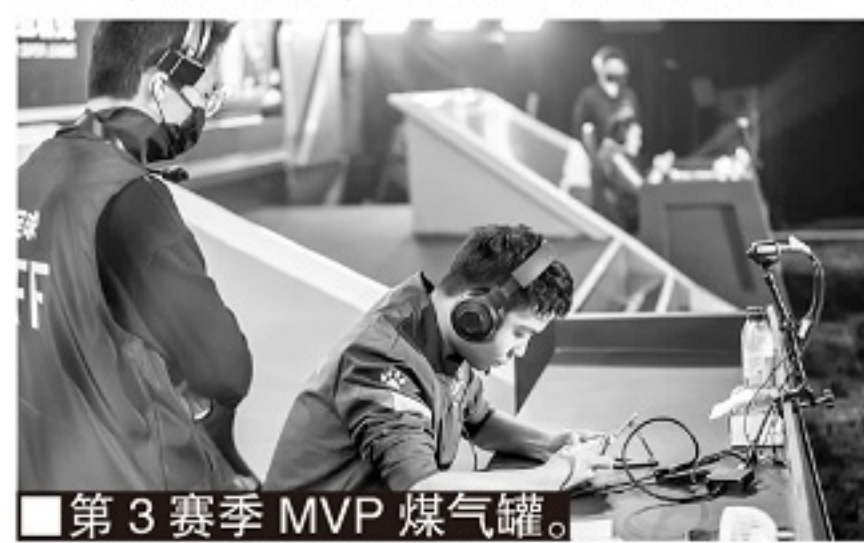
第3赛季 MVP 煤气罐。

煤气罐： 其实人生失败才是主旋律，如何面对失败是决定命运的关键。两次失败让我明白成功的艰辛，这次可以获得 MVP，天道酬勤，更努力才可能更成功。