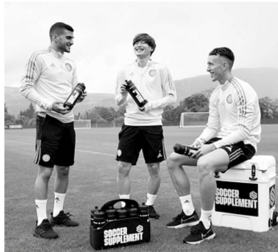
越来越多的足球俱乐部开始重视服用益生菌产品。

早在2017年，马来西亚足协就与日本益生菌品牌养乐多(Yakult)在马来西亚的分公司签订了赞助合同，养乐多成为马来西亚足协的官方益生菌饮料。此外，养乐多还与澳式橄榄球联盟、新加坡泳协、英格兰的布里斯托尔流浪俱乐部等建立合作关系。对于顶尖职业体育领域而言，益生菌正在成为新的提高运动表现的“黑科技”产品。