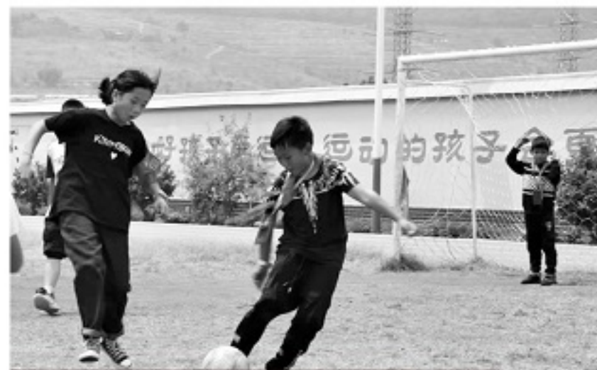
午饭时争分夺秒踢球的孩子们。

尽管大学主修的专业不同,但两人都拥有校队比赛、业余联赛的相同经历,在化念小学校队前任教练调岗之后,两名新教