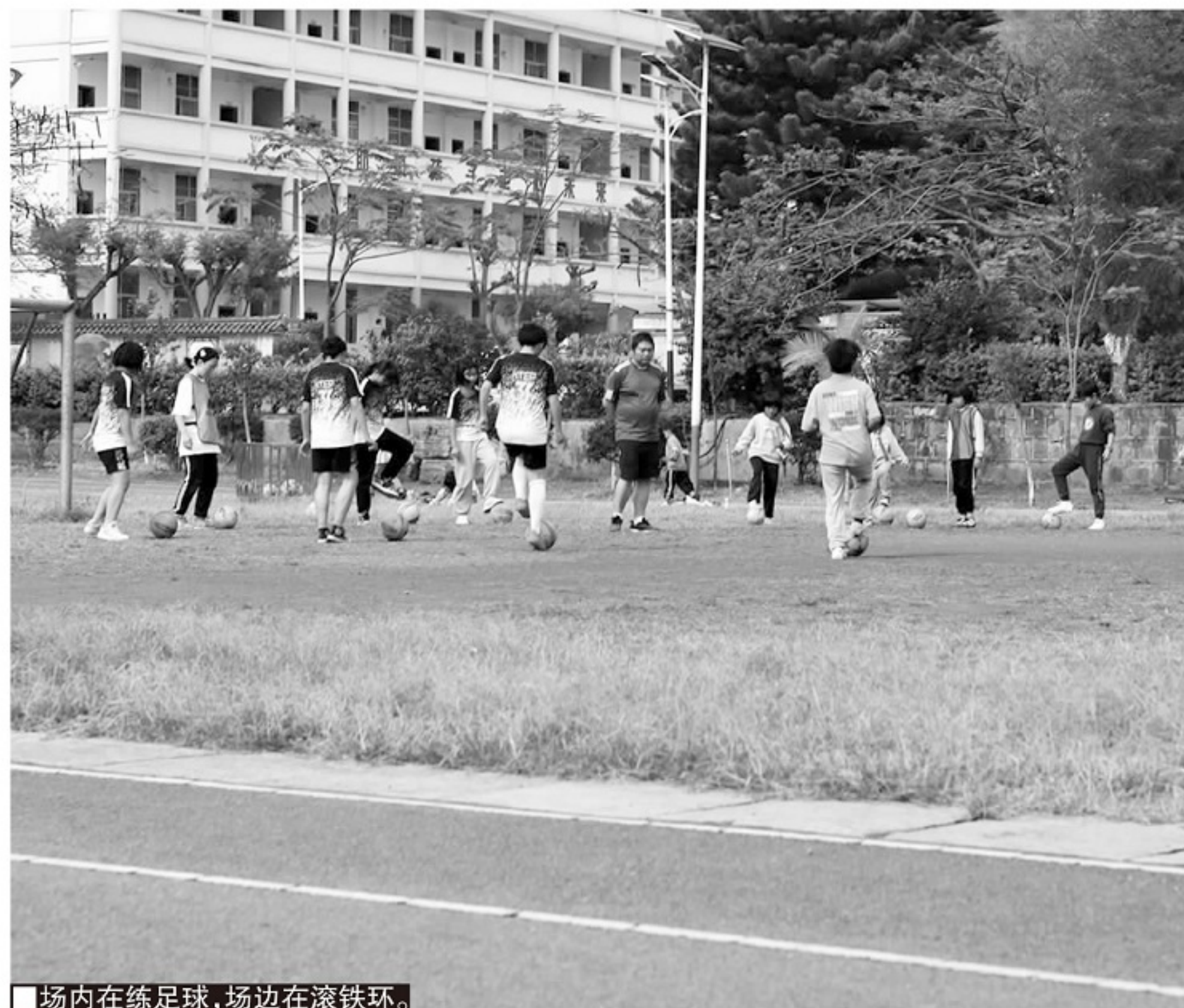
■场内在练足球，场边在滚铁环。

其中，一天踢三次依然无法尽兴，与该校的生源构成有一定关联。据了解，化念镇位于峨山、新平、红河州石屏三县的交界处，有昆磨高速、中老高铁过境，而且是玉溪市唯一兼有高铁客运站和货运站的乡镇。区位优势给小镇带来了成型上规模、不断扩张中的工业园区，相关的建设项目也引来了大量外来务工人员。加上十年前从 700 公里之外的昭通，因溪洛渡水电站动迁而来的数千移民，“滇中热坝”成了南来北往的云南人移居就业的热土。