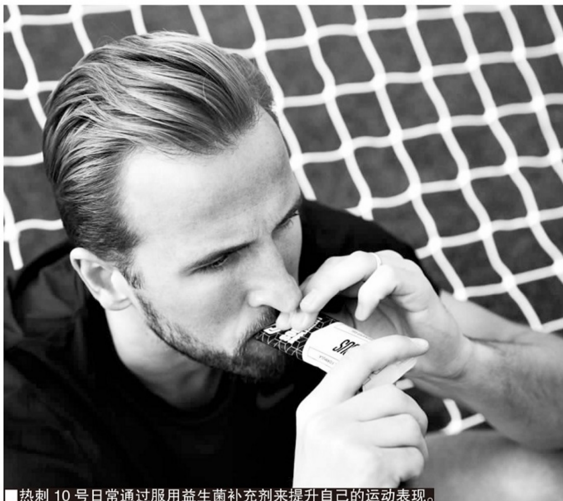
热刺10号日常通过服用益生菌补充剂来提升自己的运动表现。