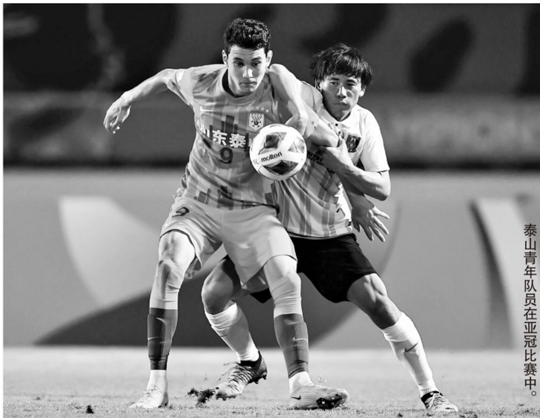
泰山青年队员在亚冠比赛中。

中接受锻炼。至于没有实施的原因,有信息显示当时有中乙俱乐部提出反对,理由千奇百怪,但实际上没有多少有说服力的理由,小算盘而已,两年之后,当时提出反对意见的很多中乙俱乐部已经作鸟兽散。