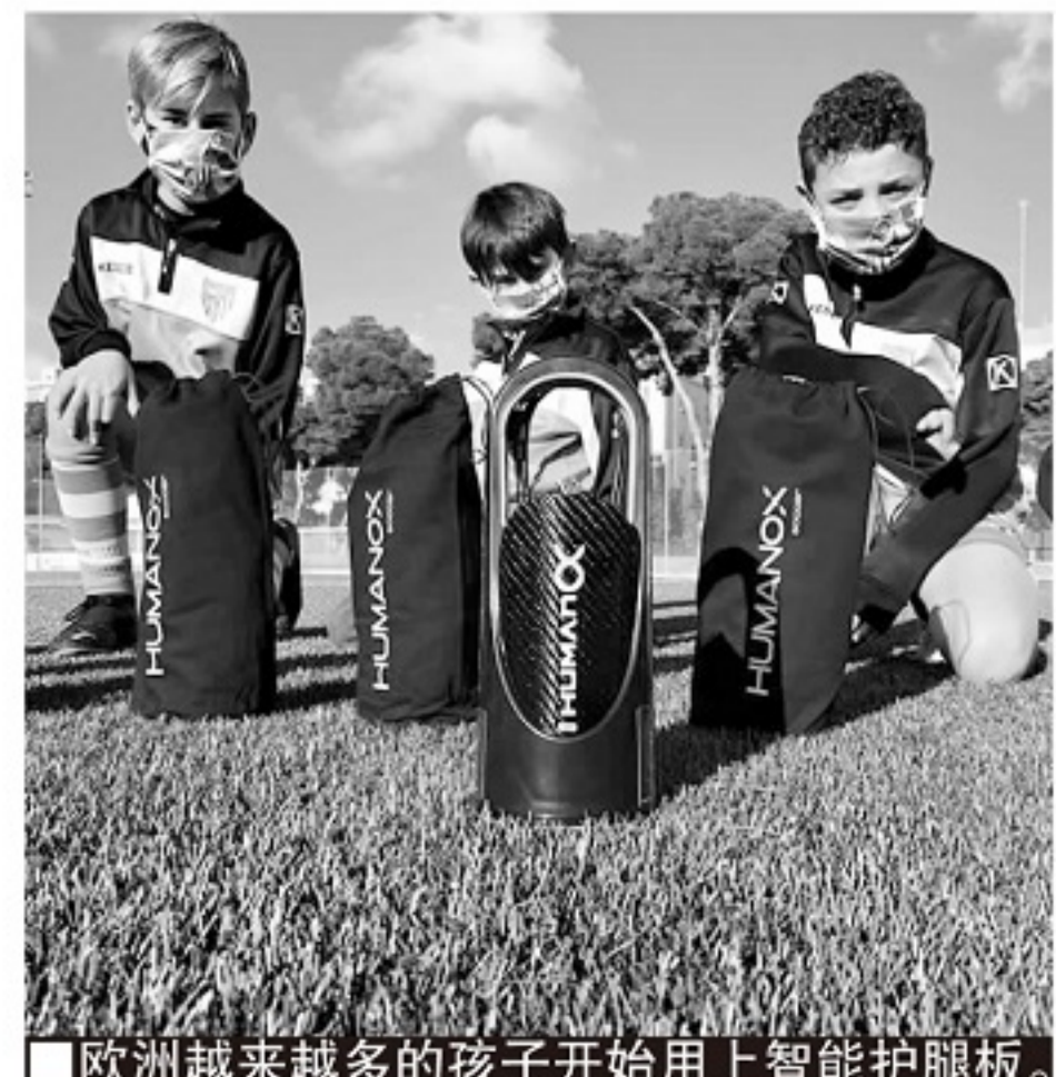
■欧洲越来越多的孩子开始用上智能护腿板。

现在几乎所有的职业体育项目,都已被各种大数据分析高科技设备覆盖,但这些高科技设备同样几乎都只能被顶尖职业运动员使用。足球一向是对高科技辅助设备非常保守的体育行业,但可穿戴设备的普及可以让足球能够在高科技使用方面赶上其他高精尖的体育项目。智能护腿板集运动保护和实时追踪、数据采集与分析于一体,还没有令人望而却步的价格,可以让任何足球爱好者都能得到五大联赛职业球员才有的大数据采集、分析辅助,对于整个足球世界的发展具有更大的意义。