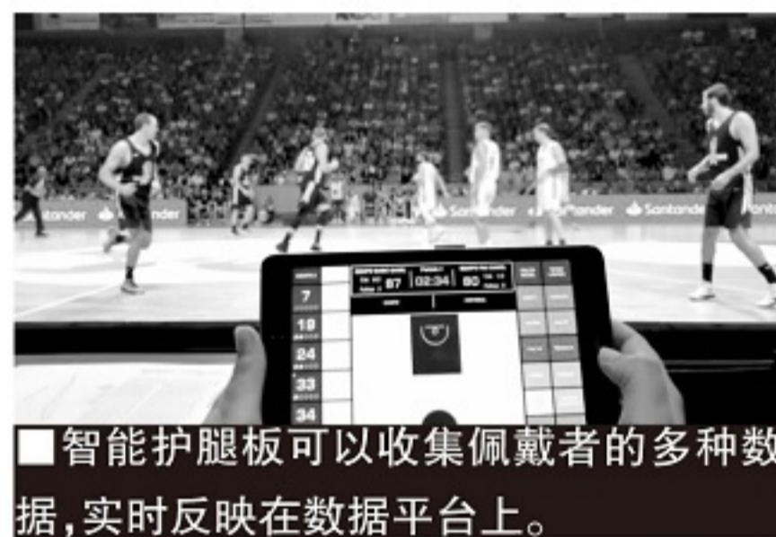
■智能护腿板可以收集佩戴者的多种数据,实时反映在数据平台上。

凭借这款惠及面更广的智能产品,Humanox 已被定义为草根和职业足球数据技术领域的领跑者。2020 年 9 月,Humanox 通过遍及 34 个国家的 298 个