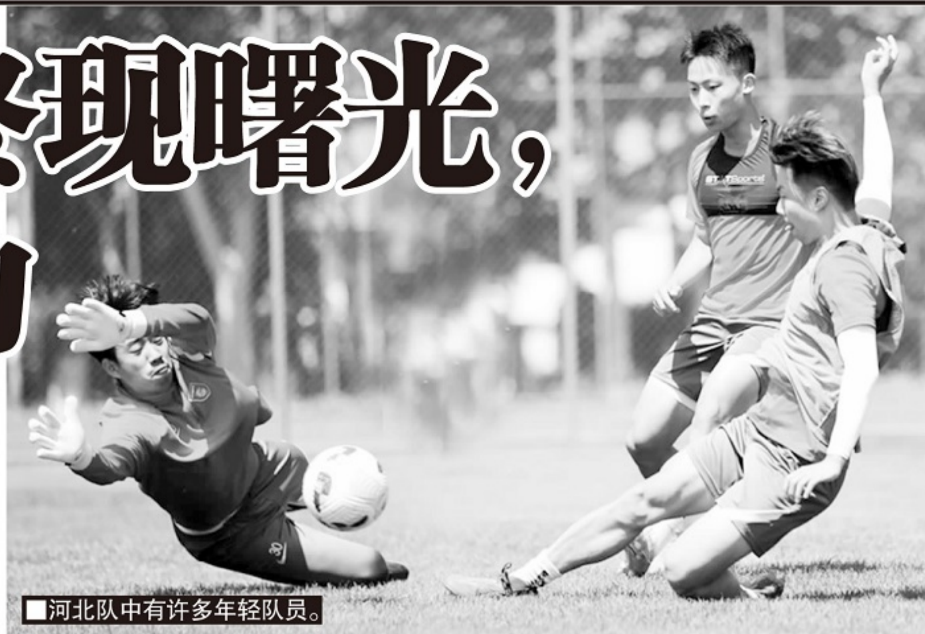
■河北队中有许多年轻队员。

而言只有两个选择：其一，集团继续坚持运营俱乐部；其二，解散俱乐部。华夏幸福方面并不愿意选择第二个选项。