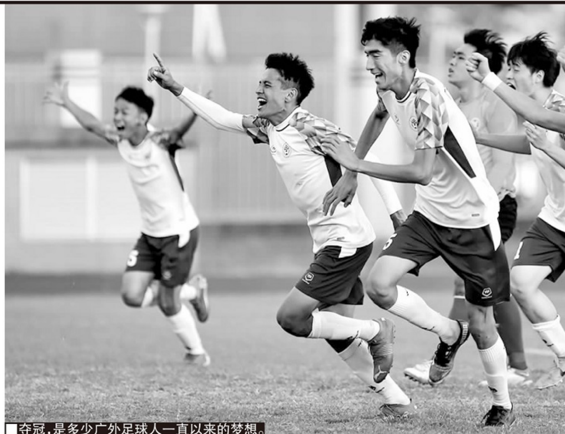
夺冠，是多少广外足球人一直以来的梦想。

在广外足球队，不管是主力还是替补，队员们训练非常认真，对于每个校队的队员来讲，成为广外足球队的队员有一种油然而生的荣誉感和自豪感。“比如，我们比赛回来吃饭，队员们谁不会先动筷