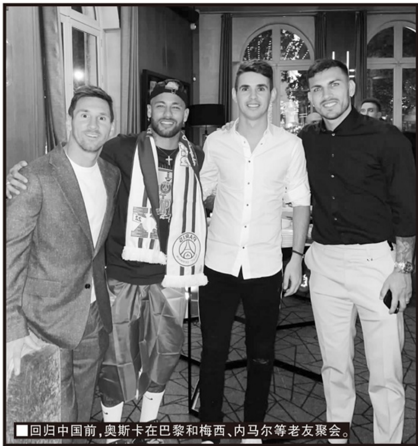
■回归中国前,奥斯卡在巴黎和梅西、内马尔等老友聚会。

练,都是以体能储备为主,时间大概在一个半小时到两个小时之间,按照莱科的初步计划,这样强度的训练大概会维持两周时间,后面会按照赛程进行一些调整。