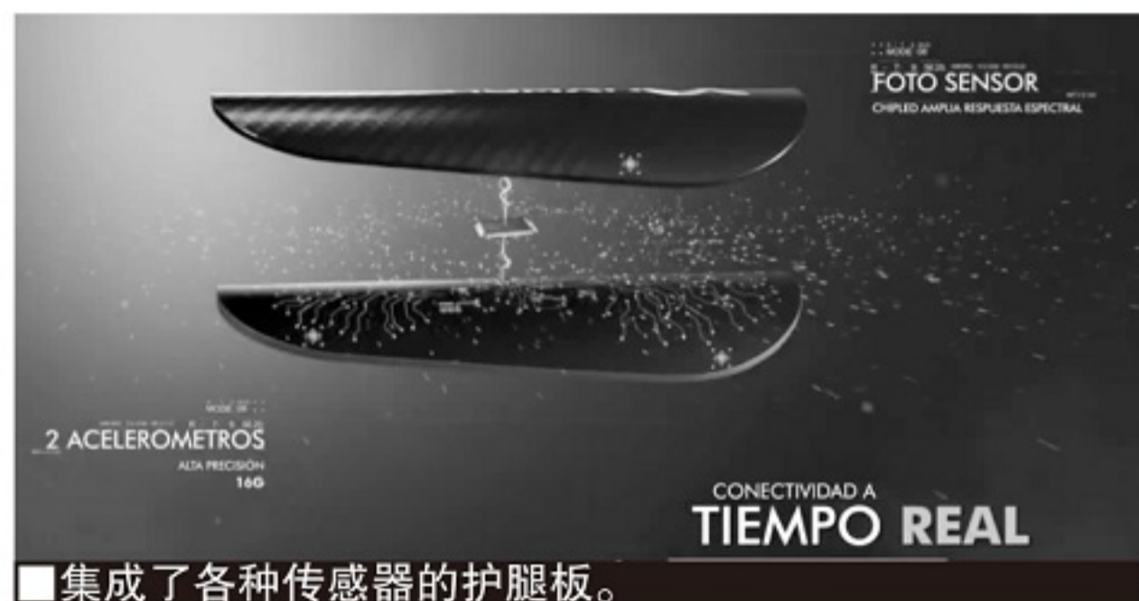
■集成了各种传感器的护腿板。

HUOX 50 型智能护腿板基于 HUOX Space 数据平台,面向 6-17 岁的青少年足球爱好者。这款智能护腿板可以在每场比赛为每个球员收集多达 5 万个原始数据,上传平台后转化为 40 多个