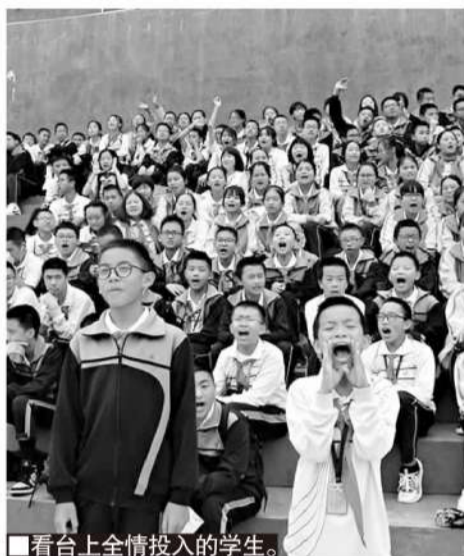
■看台上全情投入的学生。

据介绍,学校对课堂效率和教学管理一直抓得很紧,而在双减背景下,除了不折不扣地落实国家规定的正常课程,课后服务采取了“必备主餐+个性自助餐”的形式:每天下午,文化知识的学习辅导一个小时,剩下的时间就由学生根据自己的特长爱好自选参加社团活动。虽然周末不能召集学生回校参加活动,但学校也支持学生自愿、自费参加校外培训机构组织的足