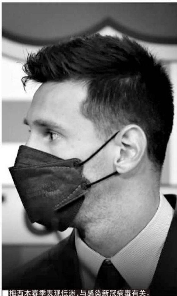
■梅西本赛季表现低迷, 与感染新冠病毒有关。

■英甲温布尔登球员麦克纳布感染新冠后, 长达 1 年多无法参加比赛, 最终惨遭球队解约。