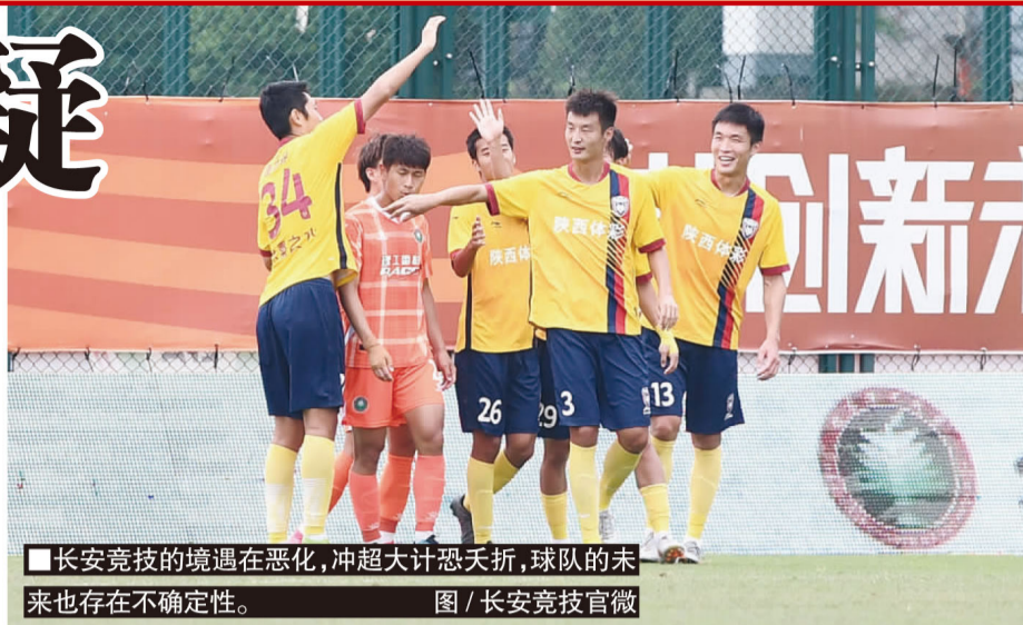
■长安竞技的境遇在恶化,冲超大计恐夭折,球队的未来也存在不确定性。

从1月份到现在,一线队的所有人员都没有领过一分钱薪水。赛季初就因为交不起150万的押金,差点没能进入赛区。现在队里的三名外援,德亚科努在7月10日确认离开球队了,并且他已向国际足联