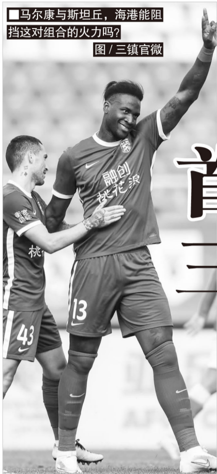
马尔康与斯坦丘，海港能阻挡这对组合的火力吗？

中超新贵对阵老牌强队，奥斯卡和斯坦丘之间的强强对话，是一大看点。如果能够顺利拿下这3分，三镇队的积分优势将进一步扩大。虽然在第一阶段的过程中，俱乐部只字不提“争冠”话题，但长时间在积分榜上领跑之后，三镇主教练佩德罗也忍不住表示：“我非常希望，当赛季结束时，我们可以在那里为重要的事情而战，为什么没有成为冠军的可能性？”这是他接受《马卡报》采访时说的。当然，夺冠的前提是，在球队处于领跑者位置的时候，更需要脚踏实地，先完成短期目标，再从长远着手。