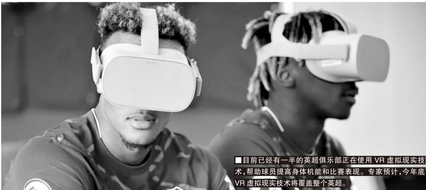
■目前已经有一半的英超俱乐部正在使用VR虚拟现实技术，帮助球员提高身体机能和比赛表现。专家预计，今年底VR虚拟现实技术将覆盖整个英超。

记者寒冰报道 “元宇宙”(Metaverse)诞生于1992年的科幻小说《雪崩》，今年是这个虚拟现实世界概念诞生30周年。随着这个概念在今年爆红，“元宇宙”一夜之间成为几乎触手可及的虚拟现实科技革命，并带动了前置基础硬件VR/AR在各领域的发展。