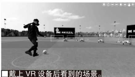
■戴上VR设备后看到的场景。

曼彻斯特一家名为Rezzil的公司给出了答案：VR虚拟现实训练和数据分析已经在改变足球教练们的训练方式，现在它迅速占领了球员个性化训练市场。无论