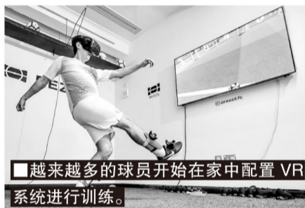
■越来越多的球员开始在家中配置VR系统进行训练。

目前的VR虚拟现实训练系统内，球员都是没有五官的，因此球员不会因队友并不100%逼真的虚拟外表分心，但身高和体重，甚至习惯动作、传球、射门力量与技术都是准确的。只要收集到足够多的大数据，就可以通过对细节的关注，精确地进行各种个性化训练。从直传球、45度角长传、任意球、头球等技术练习，Rezzil公司