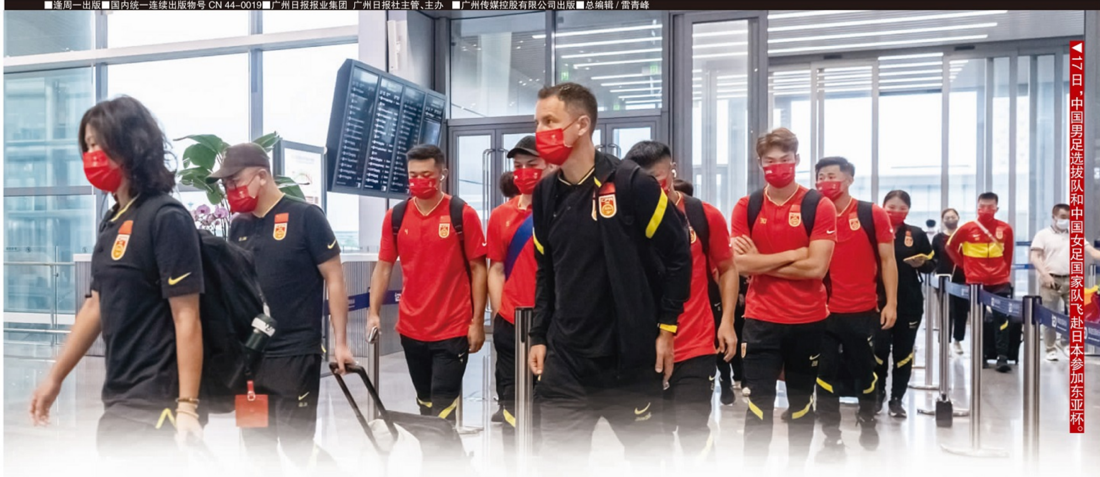
17日,中国男足选拔队和中国女足国家队飞赴日本参加东亚杯。

逢周一出版 国内统一连续出版物号 CN 44-0019 广州日报报业集团 广州日报社主管、主办 广州传媒控股有限公司出版 总编辑/雷青峰