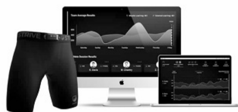
运动员穿上这条特殊的裤子,就可以联机监控下肢肌肉活动。

他们意识到量化运动员们的肌肉压力和疲劳极限,对提高运动表现尤其是年轻球员的状态有多重要。毕竟,正如米尔瓦列维奇自己所言,作为前职业运动员创办这家公司,就是感同身受:“因为我见过足够多的运动员因肌肉伤病而被迫退役,而事实上他们从未了解自己的肌肉拉伸力和疲劳极限。如果他们真的了解,可以让自己的职业生涯得到更长时间地延续。”