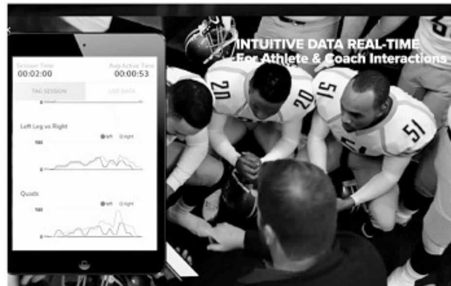
越来越多的运动队开始使用高科技产品来防范运动员肌肉受伤风险。

STRIVE 已经通过曼城进入了城市足球集团,辐射到全球 12 家俱乐部,包括被城市集团刚刚收购的意大利俱乐部巴勒莫。去年9月,STRIVE 还与业内领先的风险管理公司 Fairly Group 建立战略合作关系,通过后者与北美三大职业体育联盟、许多国家冰球联盟球队和 1000 多所大学体育部门合作。