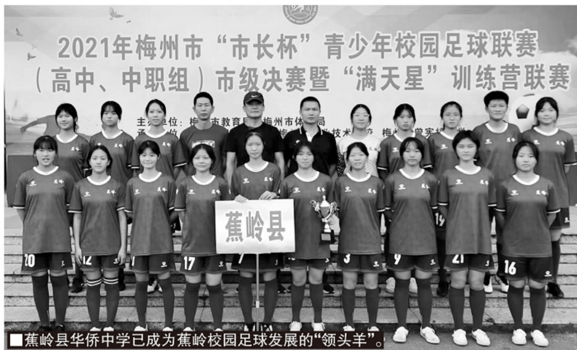
蕉岭县华侨中学已成为蕉岭校园足球发展的“领头羊”。

三年全心投入终有收获,2021年蕉岭华侨中学报考体育特长生考试的学生基本都是选足球专项,最终上本科线的学生