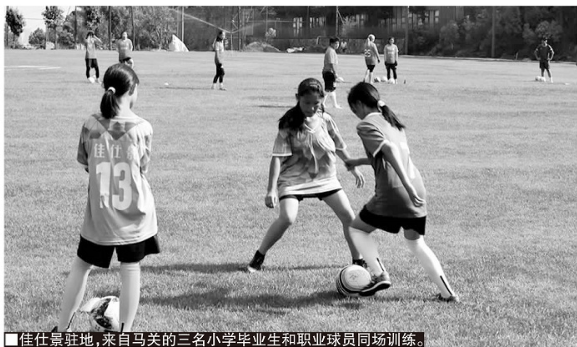
佳景驻地，来自马关的三名小学毕业生和职业球员同场训练。