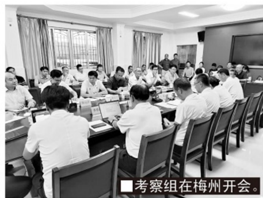
■考察组在梅州开会。

体育总局与中国足协共同开展的全国足球发展重点城市工作,便是为落实《中国足球改革发展总体方案》精神而部署的一项战略工程,立足在全国选择一批足球基础好、发展足球条件好、工作积极性高的城市,加强扶持和指导,打造我国足球改革展示范城市。