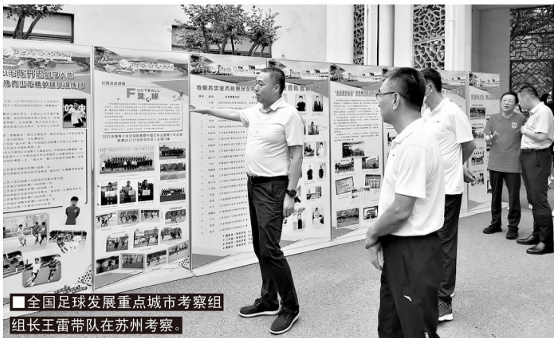
■全国足球发展重点城市考察组组长王雷带队在苏州考察。

时间里进行了1次政府陈述报告、3次座谈会(青少年足球、协会发展和竞赛体系)、8次实地考察(协会、青训中心、足球场、社会足球场、2所合作学校、2个青训俱乐部)以及3次考察组工作会议;而在梅州考察期间,两天半的时间里进行了1次政府陈述报告、4次座谈会、14次实地考察(协会、3个青训中心、职业俱乐部、中冠俱乐部、职业梯队、足球学校、2所合作学校、2家青训俱乐部、2个足球文化场馆),还有半天时间用来转机,考察组抵达下一个城市,一般都在晚上10点左右。