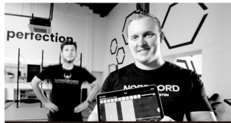
■ 两位澳大利亚运动科学博士发明了腓绳肌测试系统。

对于普通的足球爱好者而言,要想保护好好自己的腓绳肌,最重要还是在赛前做好充分的下肢拉伸运动,减少不必要的冲刺和大角度膝屈曲动作。