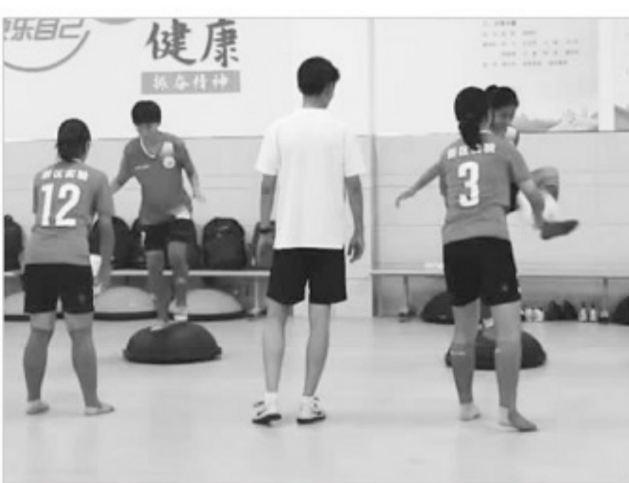
苏州高新区实验初中的女足进行室内训练。

两大本土赛事,同时举办或者承办了中国足球发展基金会的“菁英杯”、女足青训中心“希望杯”、以及“太湖杯”邀请赛等赛事;至于青训中心,苏州市太湖足球运动中心这个名字可能球迷们不熟悉,但一说2020赛季和2021赛季中超球队都是在这个中心进行训练的,球迷们可能就明白了。太湖足球运动中心拥有包括9片11人制天然草皮足球场在内的总计20片足球场,同时拥有完善的配套设施,目前苏州市男女共14支精英梯队在这里训练。