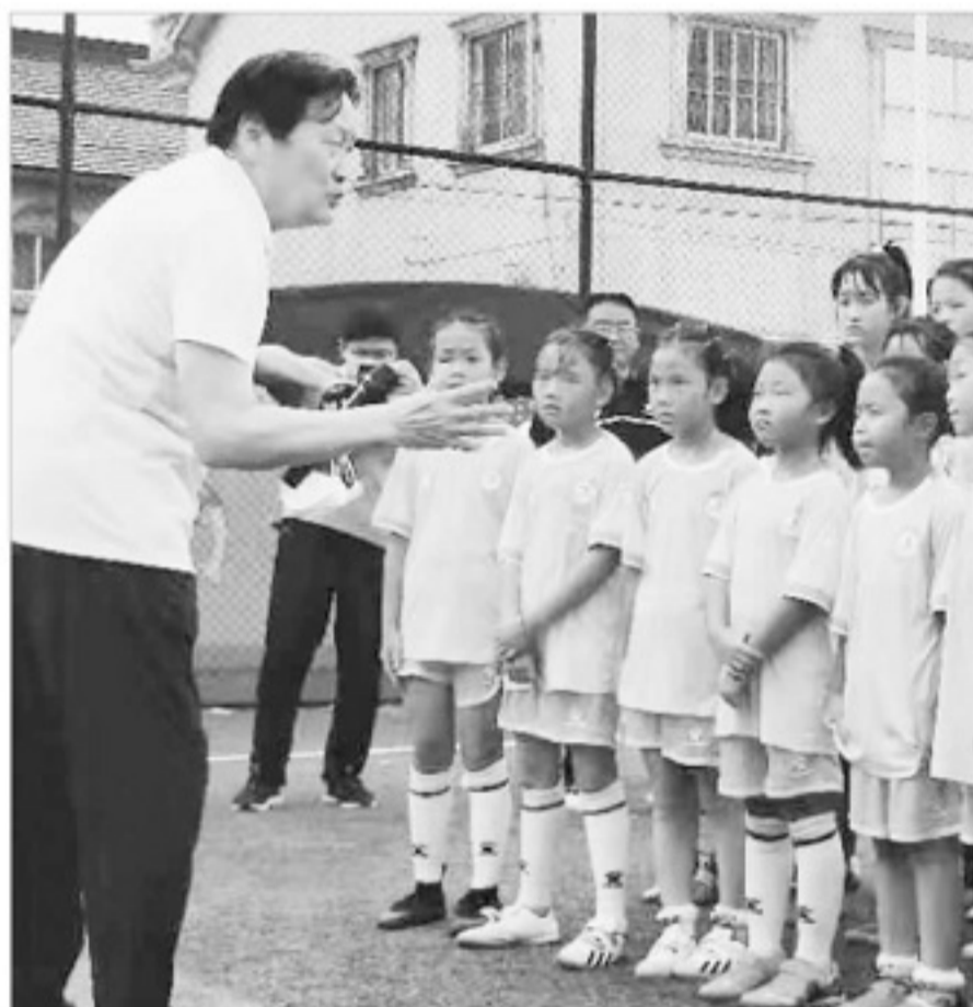
朱广沪给苏州莘塔小学的孩子进行足球辅导。

张家港还是国内知名青少年赛事“贝贝杯”的举办地,该项赛事由宋庆龄基金会、中国足协和张家港市共同举办,1983年举办首届比赛,2001年之后因各种原因