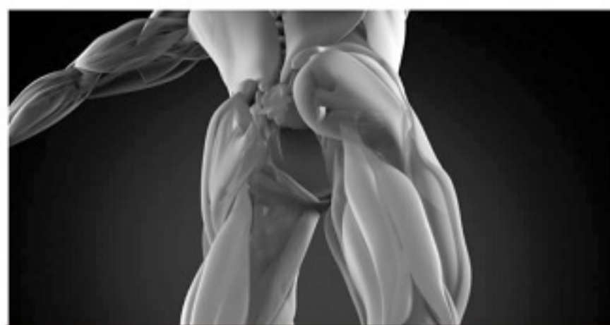
■ 腓绳肌是一组肌群,由大腿后侧的半腱肌、半膜肌和股二头肌组成,是最常见的运动损伤部位。

腓绳肌是一组肌群,由大腿后侧的半腱肌、半膜肌和股二头肌组成。这3个肌肉组织连接坐骨结节和胫骨、腓骨,均覆盖膝盖。因为运动的特点,足球选手腓绳肌的扭伤、拉伤和撕裂很频繁。欧足联在欧冠联赛所做的调查显示,肌肉受伤占有所有伤病的三成以上。其中,近九成的肌肉损伤发生在下肢的4个主要肌群:腓绳肌、内收肌、股四头肌和腓肠肌。