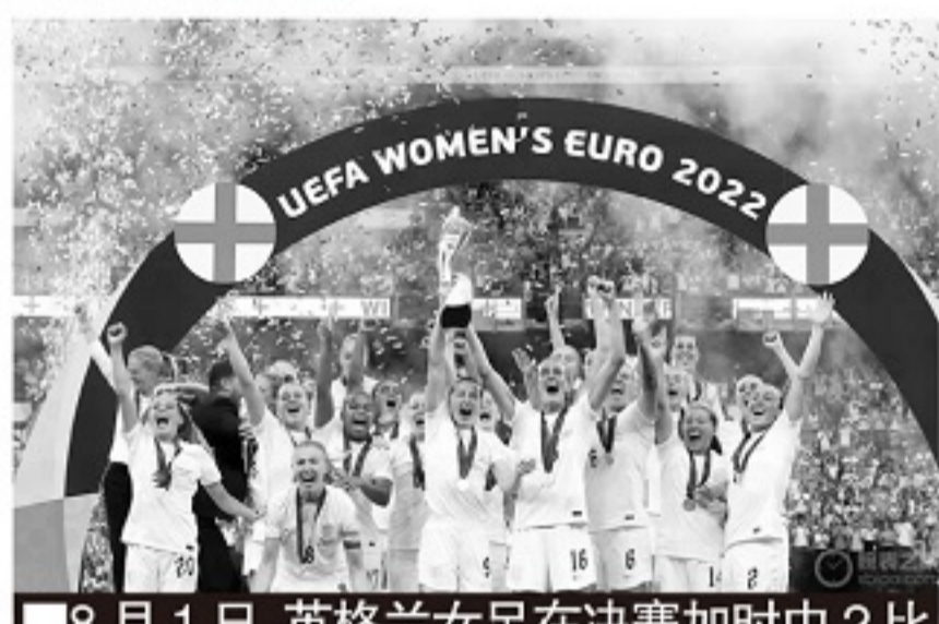
8月1日,英格兰女足在决赛加时中2比1击败德国,夺得2022女足欧洲杯冠军。

被昵称为“雌狮”的英格兰女足在本土举行的欧洲杯夺冠,引发了井喷式效应。所有人都开始关注女足乃至女子职业运动的方方面面,运动科技界也不例外。谷歌云的 Helix 程序目前追踪超过3500名职业球员,为英足总每天提供超过400场比赛的视频、数据和分析资料。此前运动科技几乎都集中运用在男子职业运动员身上,但现在,人们希望女子运动员也可以享受到运动科技带给男子职业体育的成果。