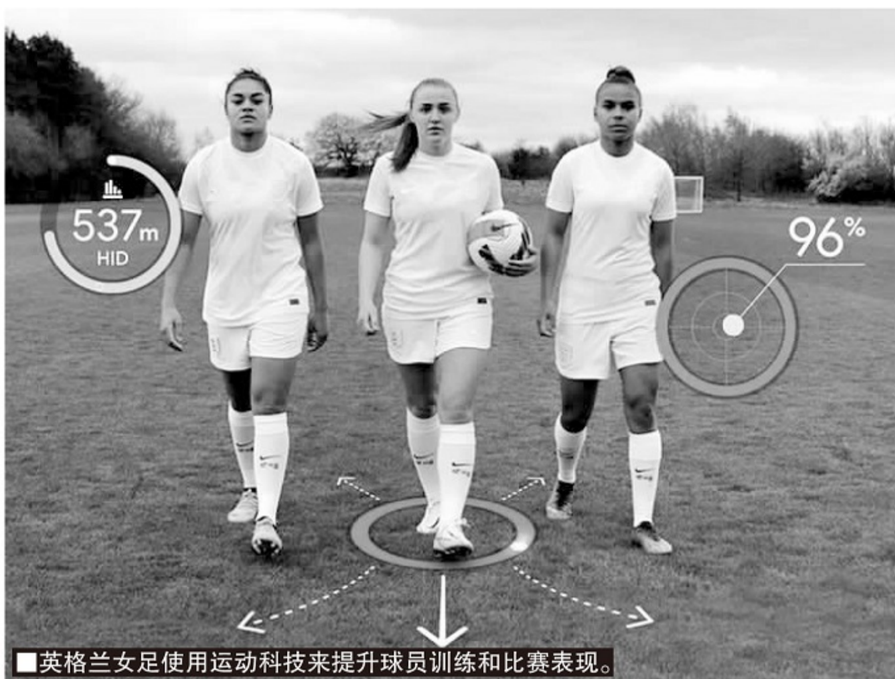
英格兰女足使用运动科技来提升球员训练和比赛表现。

著名的德勤事务所预测,未来数年女子职业体育行业将产生超过10亿美元的收益。长远来看,女子体育运动的商业增长空间比男子体育更大,因为她们拥有更大的创新空间,足够宽松的比赛周期和投资环境。而高科技将在女子体育运动的下一阶段发展中发