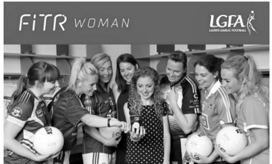
多支女足球队使用FitWoman程序来提升运动表现。

劳拉·扬森创立的Ida Sports已经研发了专为女性足部和体型设计的足球鞋,它可以降低前交叉十字韧带受伤的风险。女子网球巨星塞雷纳·威廉姆斯(小威)的Serena Ventures公司,作为体育营销技术初创公司,已得到了上百万美元的投资。如今,女性创办的运动科技初创公司比以前更多,也有更多风险投资介入到这些女性初创公司。毫无疑问,女性在运动科技未来的发展中将占有重要一席。