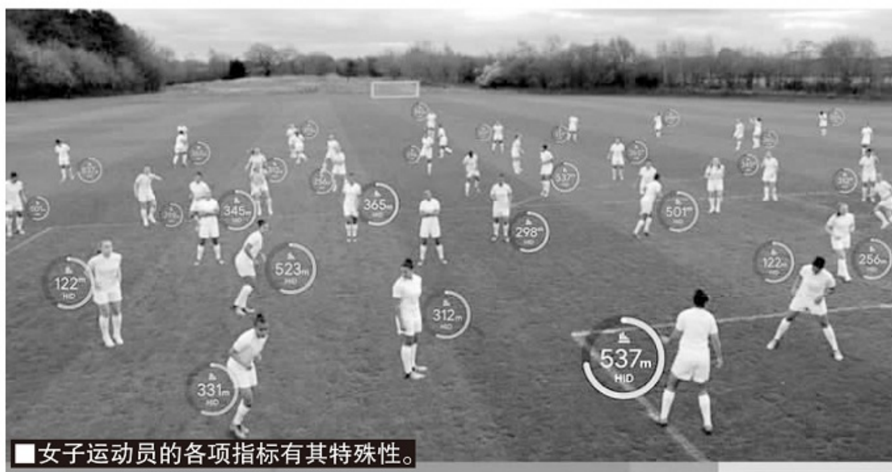
女子运动员的各项指标有其特殊性。

相比商业领域的差距,运动科技带来的数据化差距对女子运动而言更关键,因为它可能将让女子运动与男子运动的差距变得永久化。此前绝大多数运动科技和运动医学研究都只与男性运动