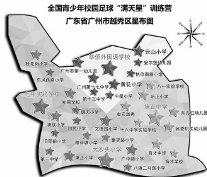
■越秀区正努力绣着属于自己的“满天星”训练营星图

校园足球“满天星”训练营不仅是一份荣誉，更是一份责任、一份使命。训练营能够让老城区的孩子们感受到校园足球就在自己的身边，校园足球文化就在自己的身边。