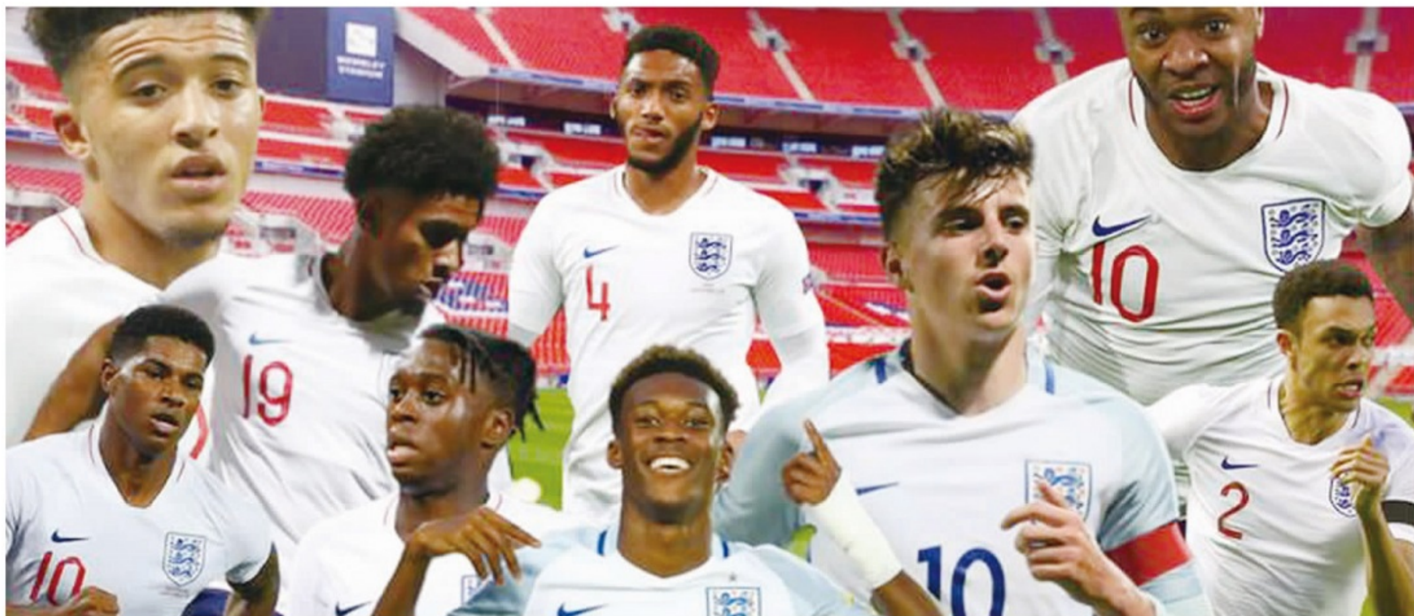
■英格兰帝星们换了一代又一代。虽然英格兰到目前为止还未能再在世界大赛再次夺冠，但不可否认，依靠英超联赛，这个国家队涌现出来的强势新星，越来越多。