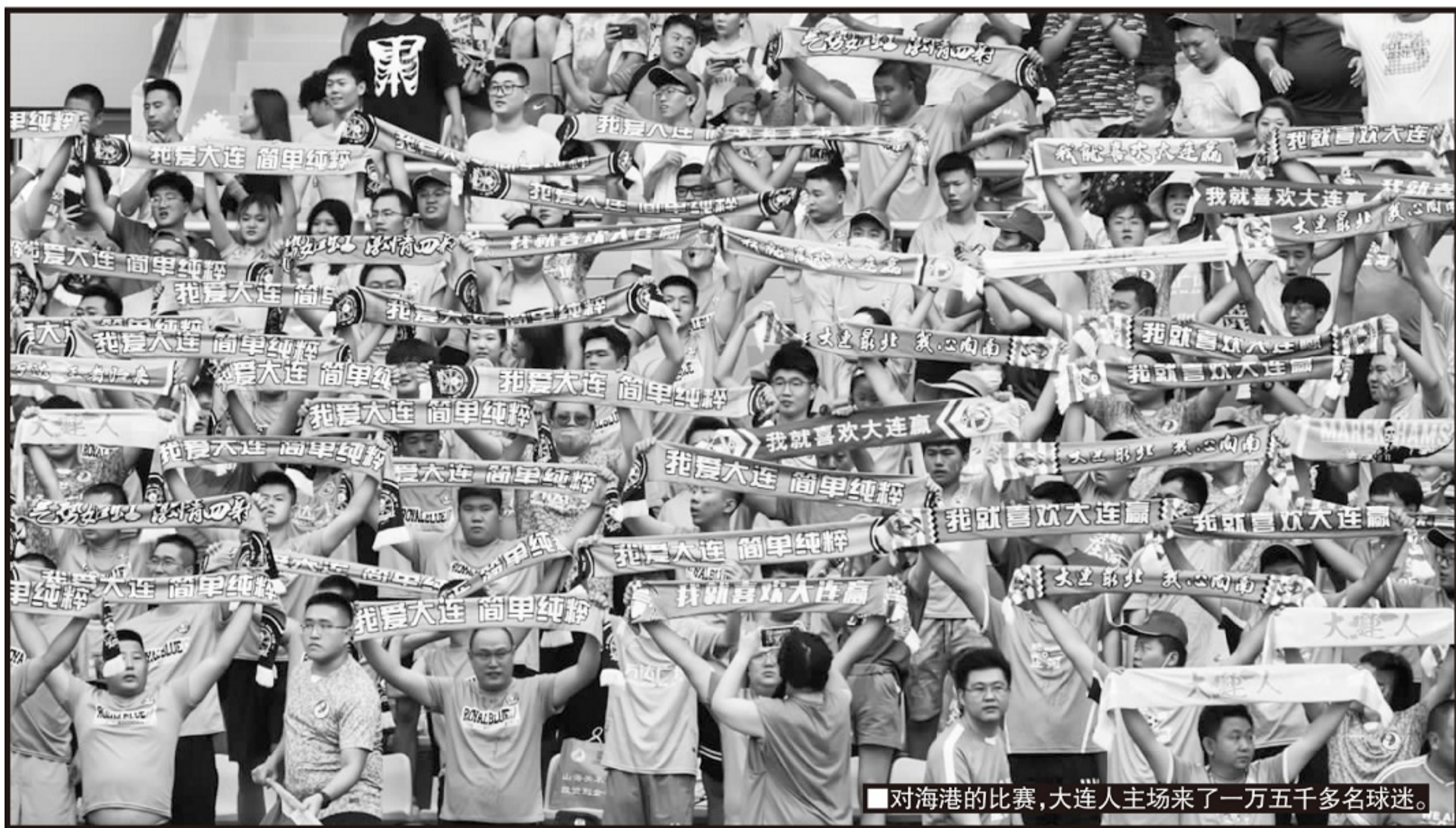
■对海港的比赛,大连人主场来了一万五千多名球迷。