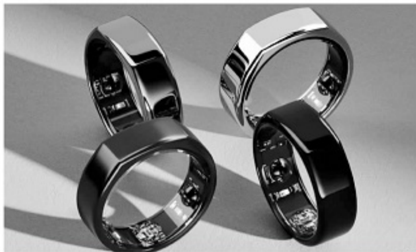
智能戒指看上去就和精美饰物一样。

要了解这枚让谷爱凌爱不释手的“戒指”，就不得不提芬兰小城奥卢，这个地方很容易让人想到曾经的电信巨头诺基亚，以及它令人震惊的陨落。事实上，奥卢正是诺基亚最重要的产业研发中心之一，曾经推动诺基亚成为整个芬兰的骄傲。但在2013年被迫将其移动通信部门出售给美国的微软公司后，诺基亚就几乎彻底消失在社交网络的世界里。