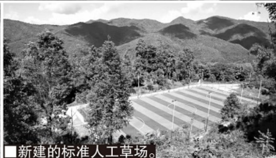
■新建的标准人工草场。