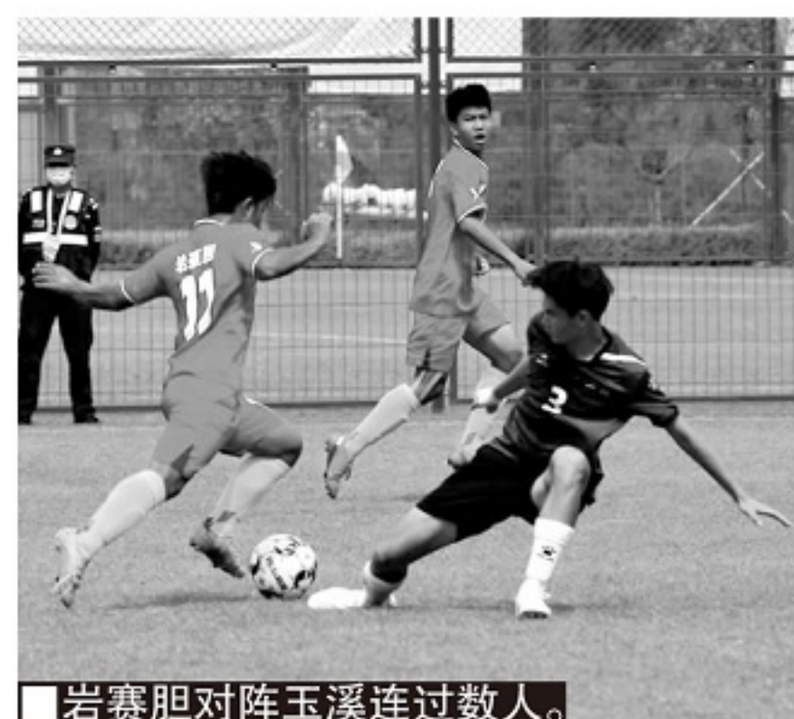
■岩赛胆对阵玉溪连过数人。

没错，曼迈兑与缅甸边境的距离不到与县城的1/4，与泰国边境的距离不到与省城的一半，村民们在泰国不乏亲戚朋友，而且他们的第一代业余球员，也的确是在泰国足球的熏陶下萌芽、成长、叶落、归根。而且几代人都没有接受过专业训练，踢得都是最纯粹、最原生态、最具生命