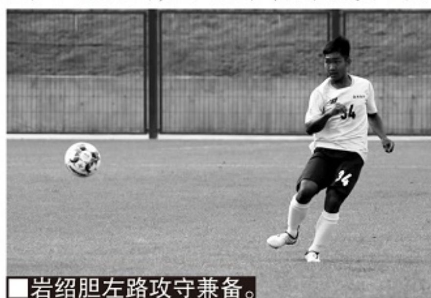
■岩绍胆左路攻守兼备。

足球点亮这个布朗族山寨时，普洱茶市场价格已进入持续上升阶段。在普洱茶主产区勐海县，世代种茶、制茶的曼迈兑