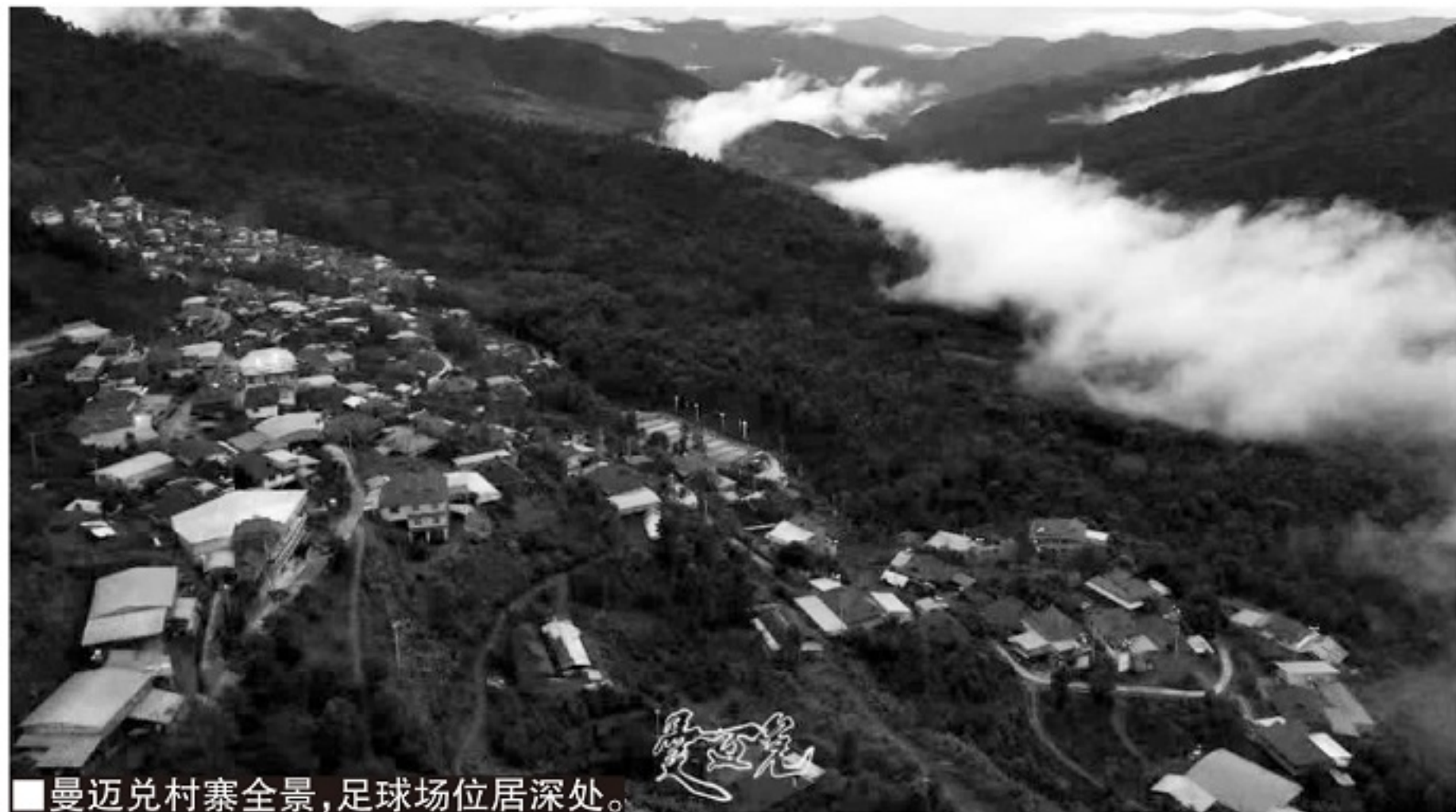
■曼迈兑村寨全景,足球场位居深处。