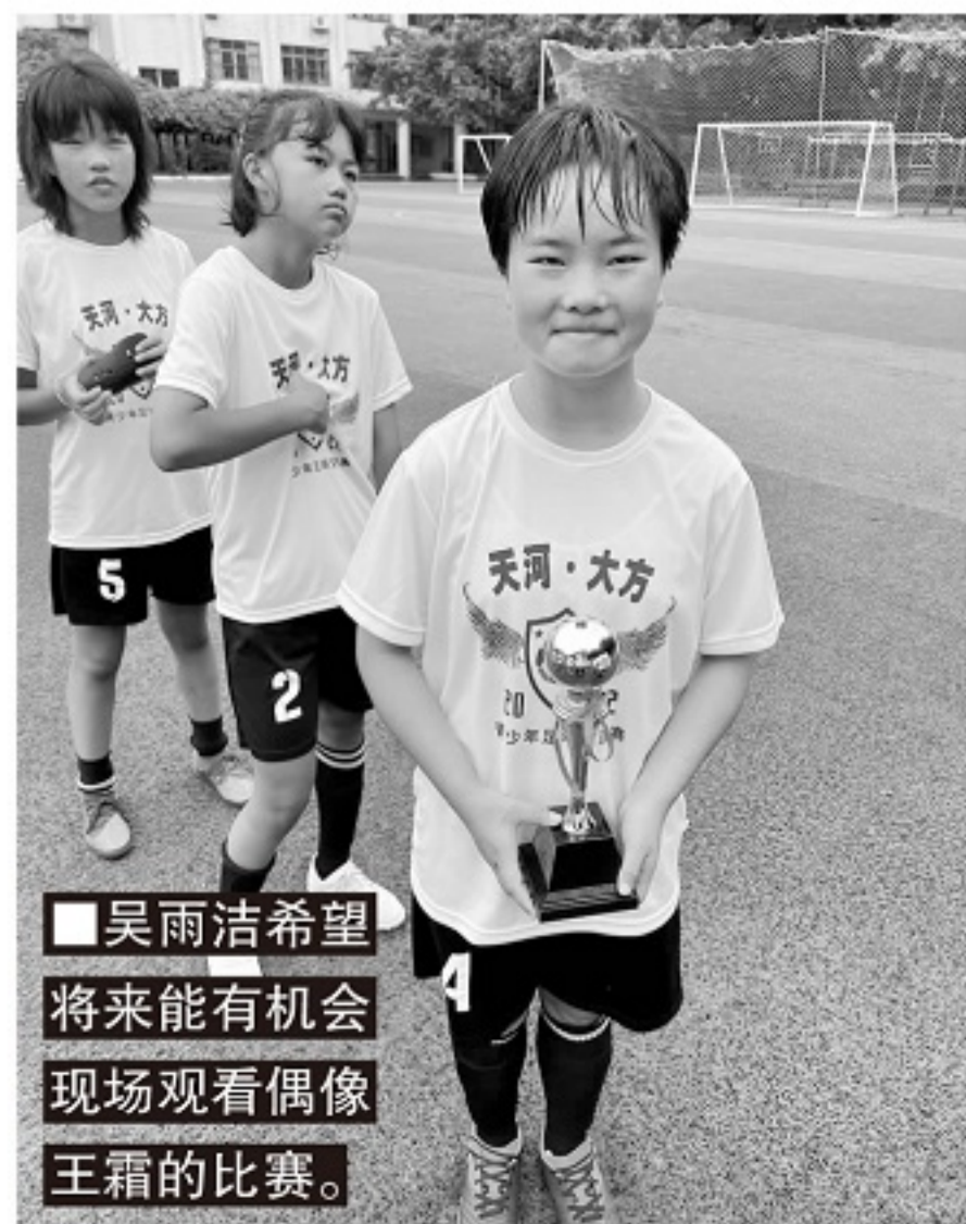
吴雨洁希望将来能有机会现场观看偶像王霜的比赛。