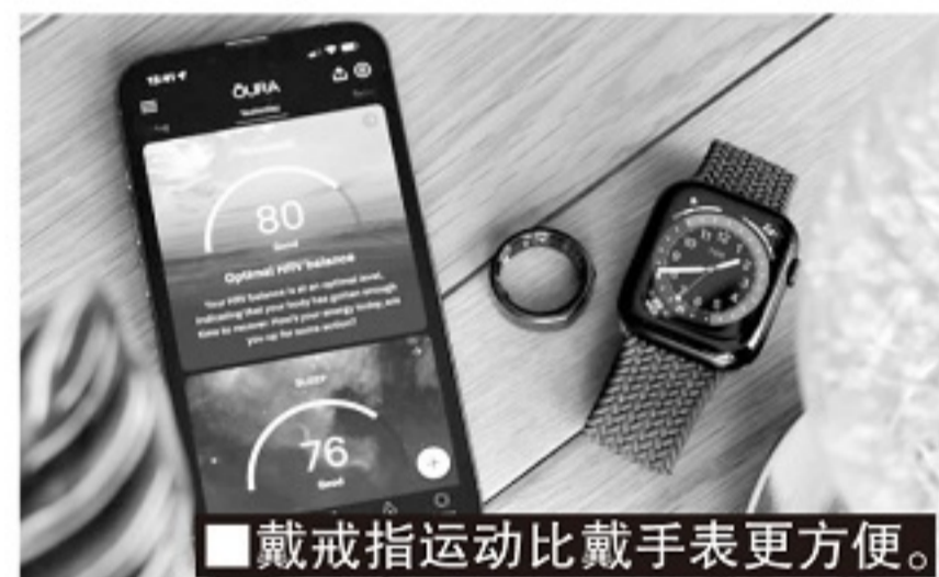
戴戒指运动比戴手表更方便。

当今社会越来越注重运动和健康， Oura Ring 发展到第三代已经不仅仅是一个睡眠跟踪器了，过去被视为鸡肋的运动监测功能也得到了很大提升。通过新的心率监测功能，第三代 Oura Ring 可以实时跟踪用户在日常和锻炼时的心率数据，获悉用户身体如何应对日常生活习惯，帮助用户了解身体状况和身体变化，然后通过心率和皮肤温度变化，来告知用户在锻炼后的身体恢复状况。另