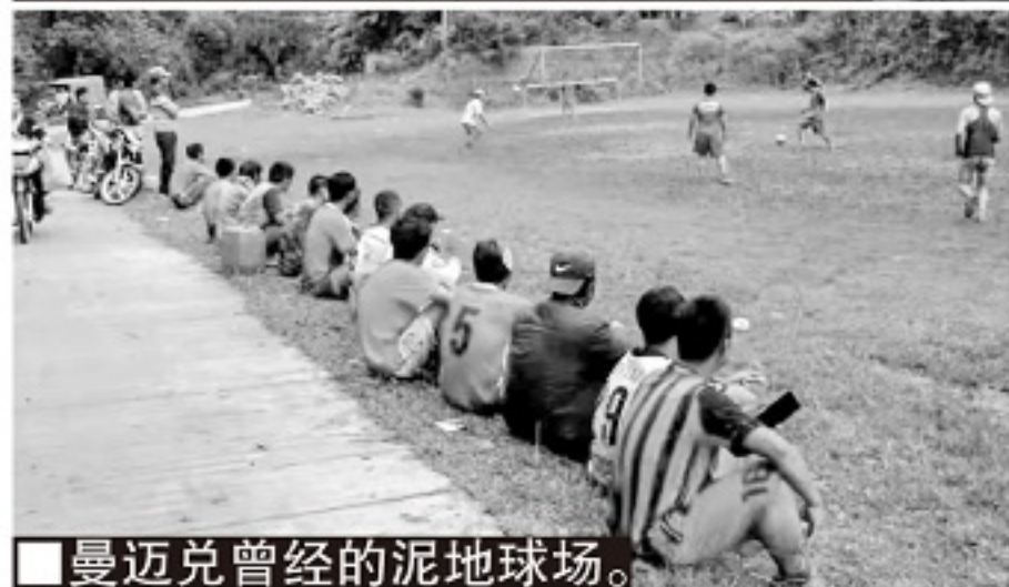
■曼迈兑曾经的泥地球场。