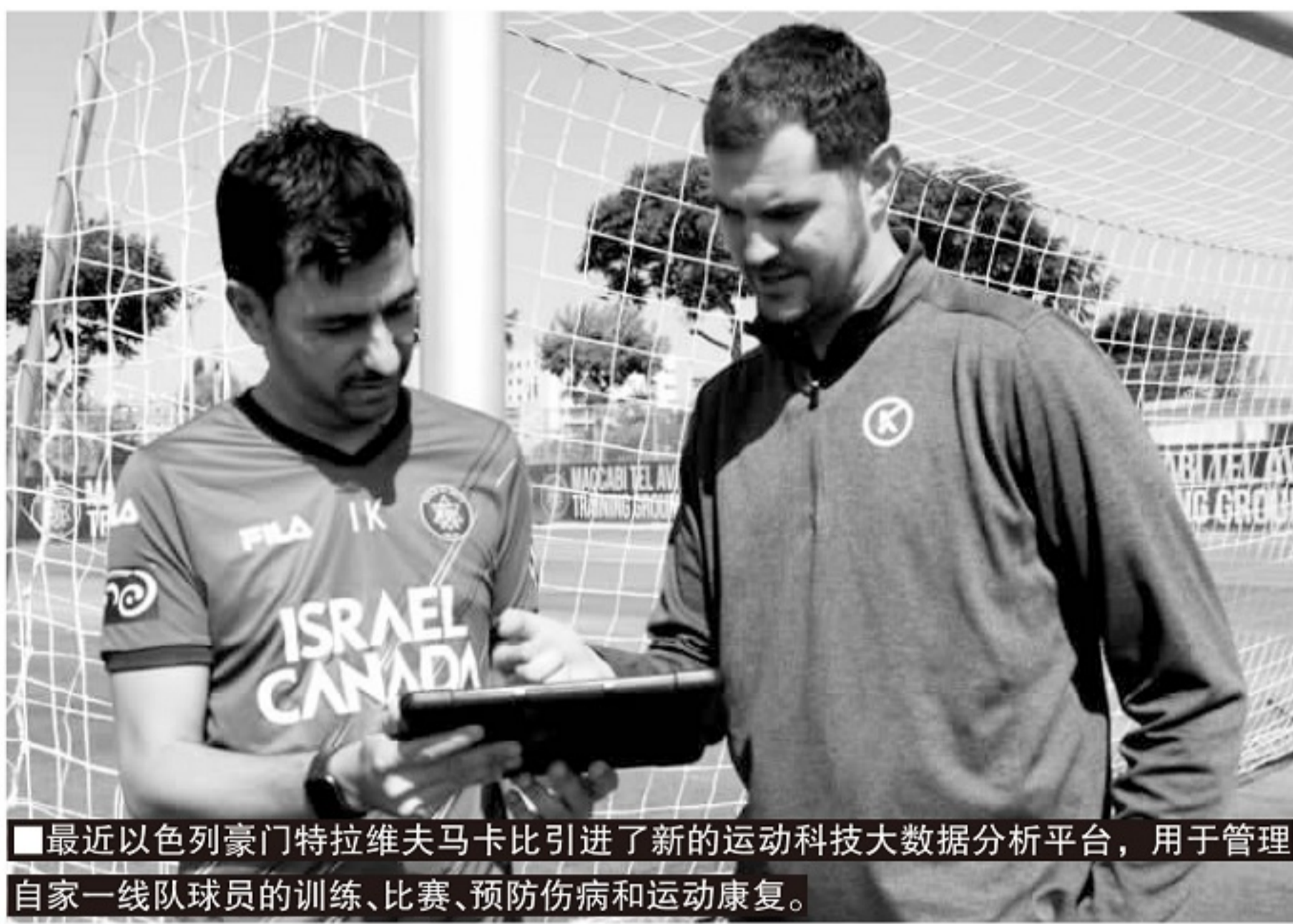
最近以色列豪门特拉维夫马卡比引进了新的运动科技大数据分析平台，用于管理自家一线队球员的训练、比赛、预防伤病和运动康复。

有科技、物理、生物、比赛相关数据都经过 Kitman Labs 软件处理，生成全面的分析报告，球队可以使用这些数据来预测球员的受伤风险，制定训练和比赛计划，并评估球员的天赋以及让球员发挥最佳水平的因素。