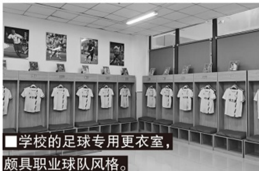
■学校的足球专用更衣室,颇具职业球队风格。

体教融合是中国青少年足球发展的核心政策,这项政策的关键点便是体育训练比赛和文化课学习两不误。在这个层面,苏州高新区实验初级中学出台了“送教上赛场”的方案,也就是说,当球队外出比赛期间,学校的文化课老师也会跟随球队一起奔赴一线,保证球员文化和学习不掉队,学业和足球两不误,体教深度融合。为此,学校也精选跟队老师,选择优秀的党员教师和球队一起开赴赛场。