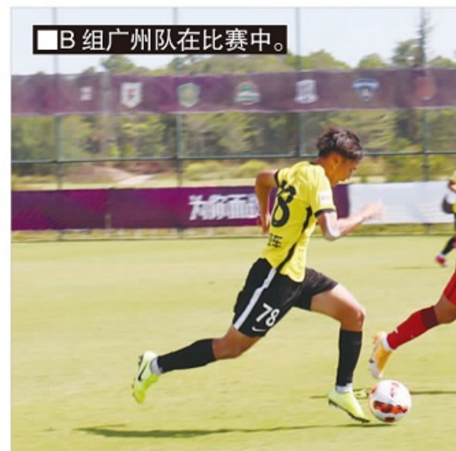
■ B 组广州队在比赛中。

预选赛的队伍，绝大部分队员都来自各级职业足球俱乐部，可以发现，职业足球俱乐部在培养高水平足球人才方面的重要性。从中国足协和中足联的角度来看，我们非常重视职业足球俱乐部在梯队建设和梯队