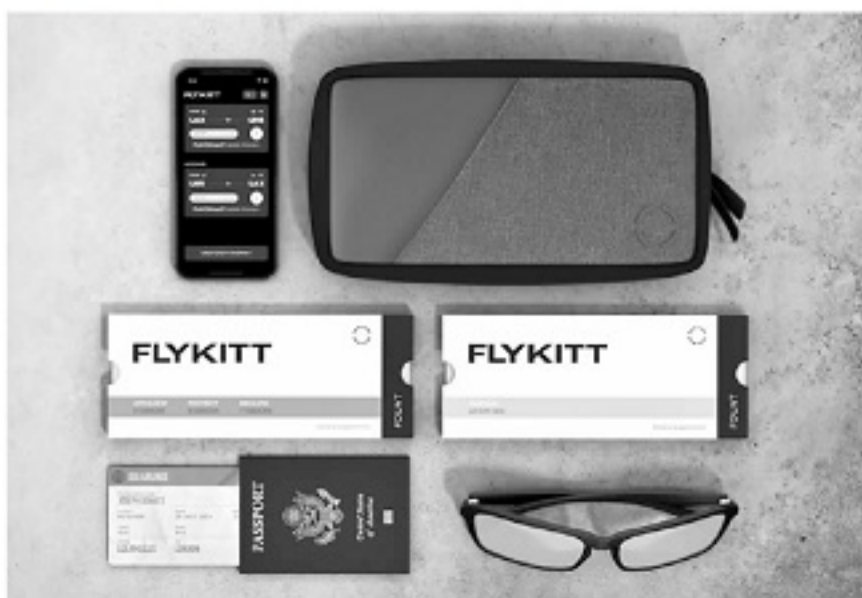
■Fount公司研发的“无时差”方案产品。

Fount公司联合创始人兼CEO安德鲁·赫尔强调,FlyKitt是基于美国特种部队突破人类极限相关研究的成果,进行了必要调整后更适合职业精英运动员的