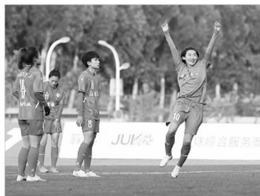
4日2比0击败山东体彩女足后,武汉女足豪取14连胜,提前4轮夺女超冠军。

2022年初,中国足协对女超联赛的赛制进行了更为合理的变更,由前两年的“杯赛制”改为“联赛制”,10支女超球队将按双循环积分的形式进行18轮较量,最终以积分决定冠军归属。