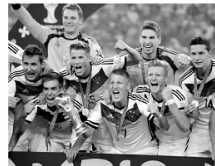
■2014年德国成为首个能在西半球夺得世界杯冠军的欧洲球队。

相比已经足够成熟的,基于传感器收集数据的运动科技产品,“无时差”产品对球员们在大赛上的表现影响更大。1958年的瑞典,2002年的日本和2014年的巴西,都见证了顶级球队克服时差影响获得的巨大成功,2022年的卡塔尔呢?是否会有新的“无时差”奇迹诞生?