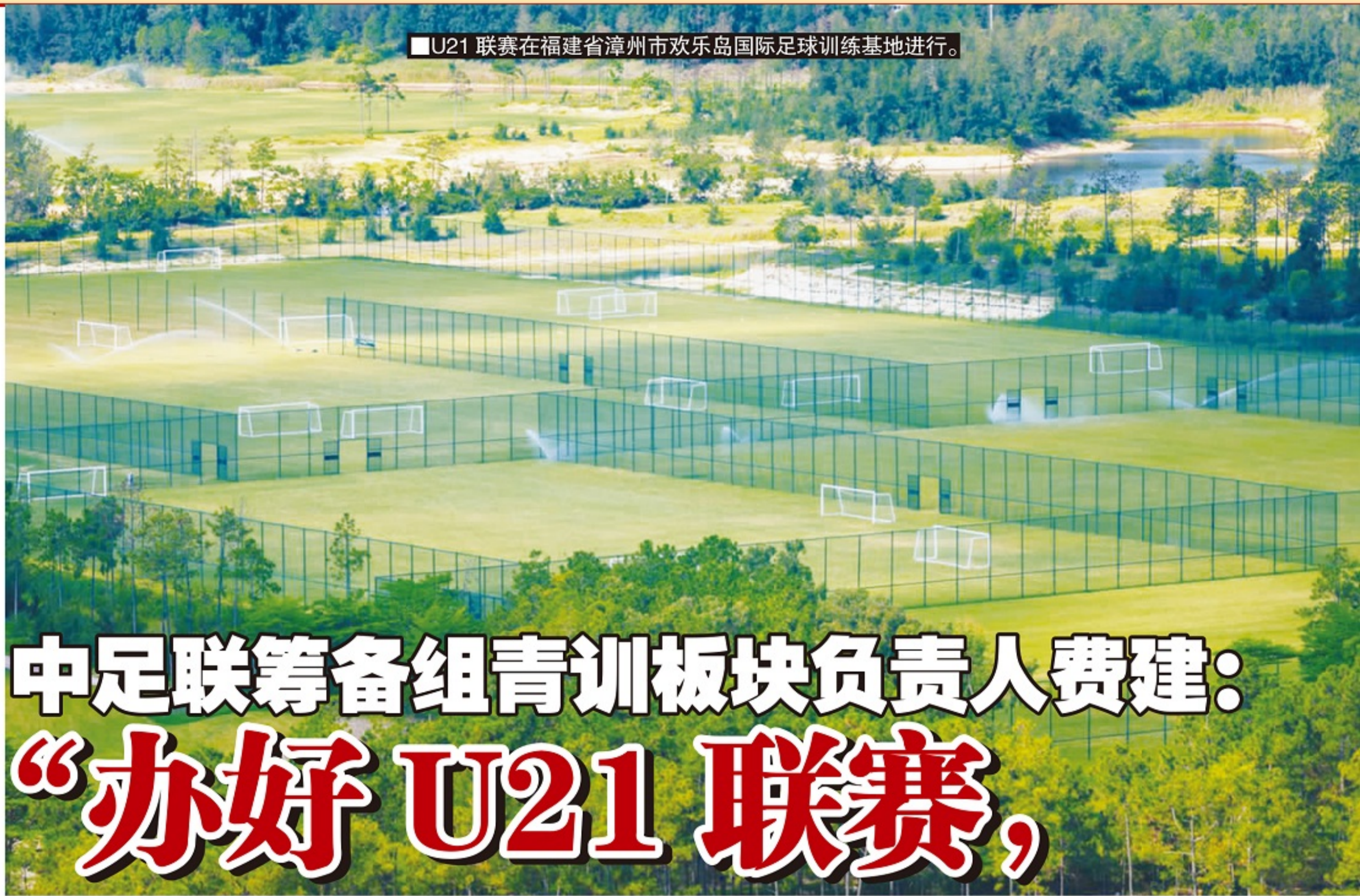
U21联赛在福建省漳州市欢乐岛国际足球训练基地进行。