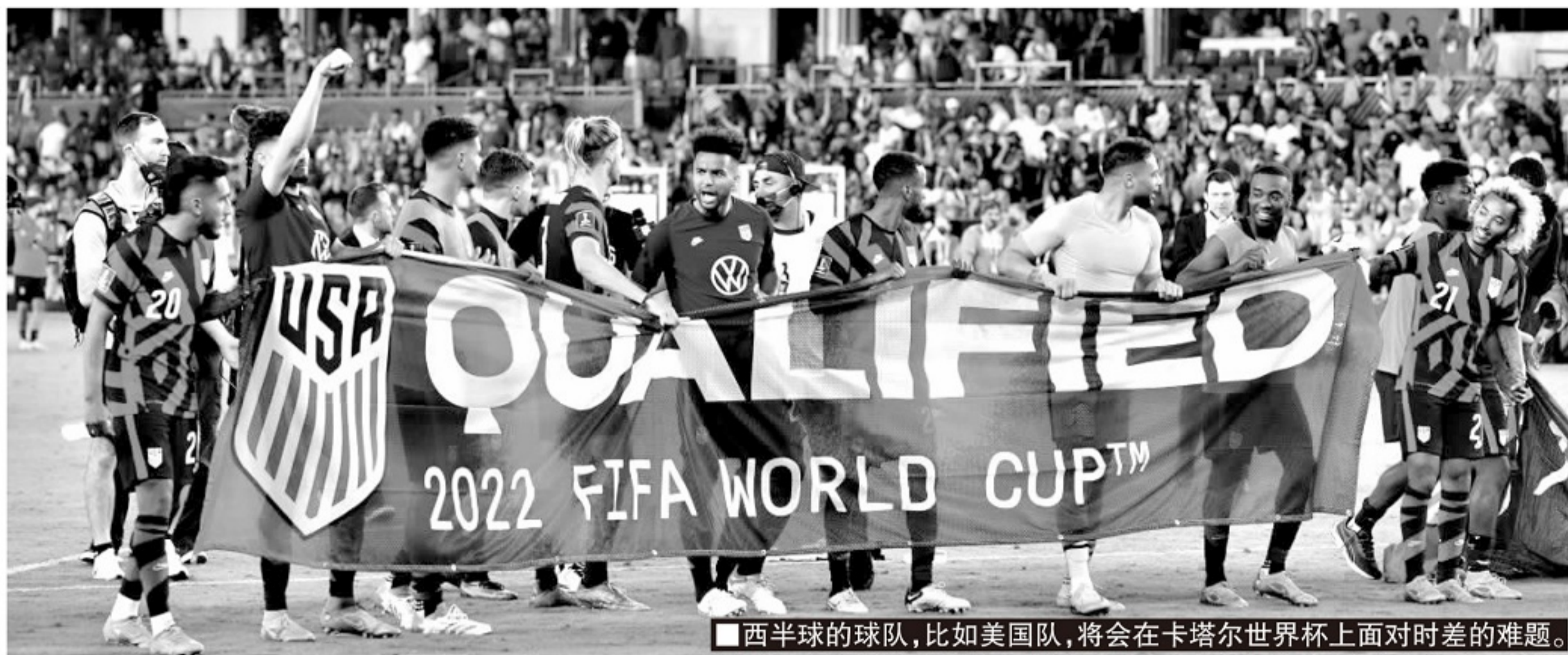
■西半球的球队,比如美国队,将会在卡塔尔世界杯上面对时差的难题。

记者寒冰报道 卡塔尔世界杯在即,对于来自远东和南北美洲的参赛者和球迷而言,除了昂贵的食住行,另一个必须要更好地解决的难题就是时差。这是一个曾经被普遍忽视的客观因素,在象征全球化时代的2002年世界杯之前,世界杯仅在欧洲和美洲两个大陆举行。除了1958年的巴西,其余15次世界杯均没有球队能跨洲夺冠。适应时差对于世界杯这样赛程密集的大型赛事而言,往往在赛事之初就已决定了球队的状态和走势。