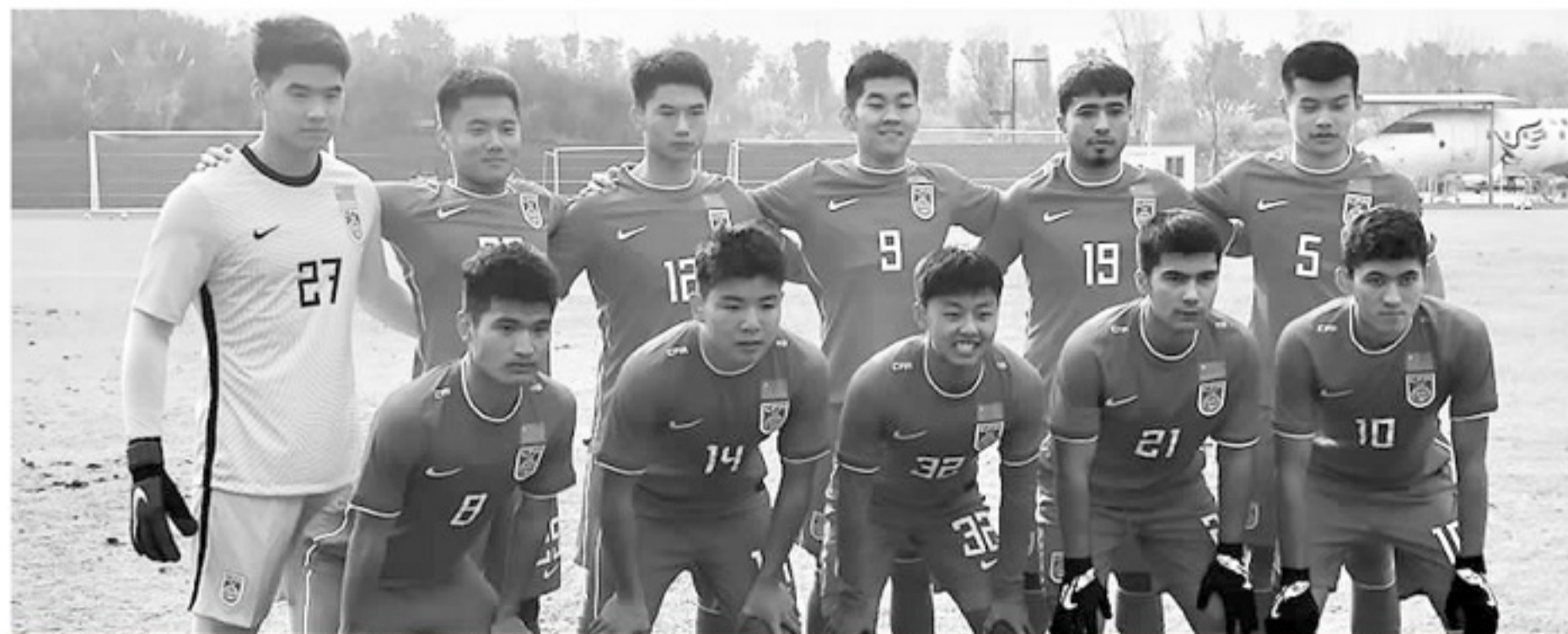
因为原安排的热身赛对手出现健康问题,U20国家队临时调整为红白队的内部对抗赛。