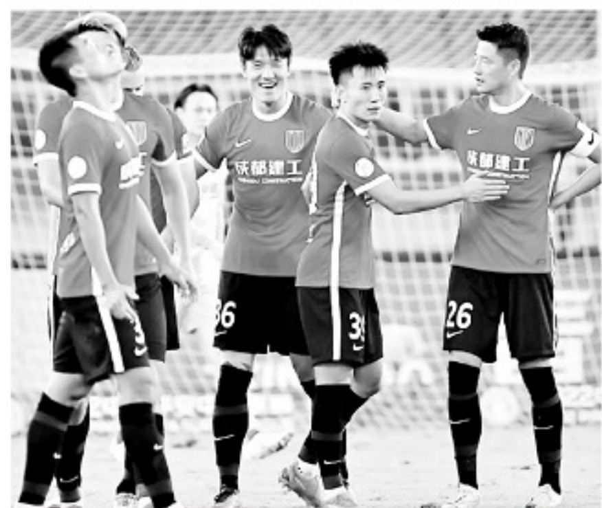
■双杀中超冠军武汉三镇,击败山东泰山,成都蓉城堪称领头羊杀手。

有的比赛上半场我们可能落后一个球,甚至两个球,我跟队员说,下半场是一个新的开始,我们还有45分钟,只要我们下半场不放弃,一定可以获得一个比较好的结果。当然,我也愿意去谈“运气”,运气这个东西永远只会眷顾那些愿意付出努力和汗水的人。中场休息的时候我会常说这些,平时付出了多少,赛上场就会收获多少。这是很多时候我们总在最后时刻打进制胜球甚至反败为胜的根本原因。