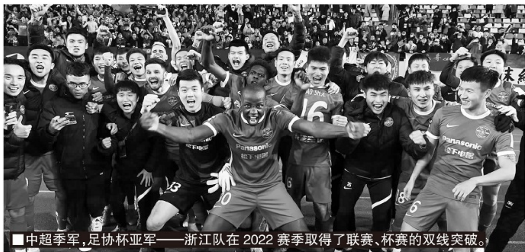
■中超季军,足协杯亚军——浙江队在2022赛季取得了联赛、杯赛的双线突破。

感谢!我们只能说还在路上,我们会继续努力,为浙江足球的进步,为中国足球的发展贡献自己的力量。借用浙江省政府在年终经济总结中的一句话概括就是,“历经艰辛稳进提质,砥砺前行不忘初心”!