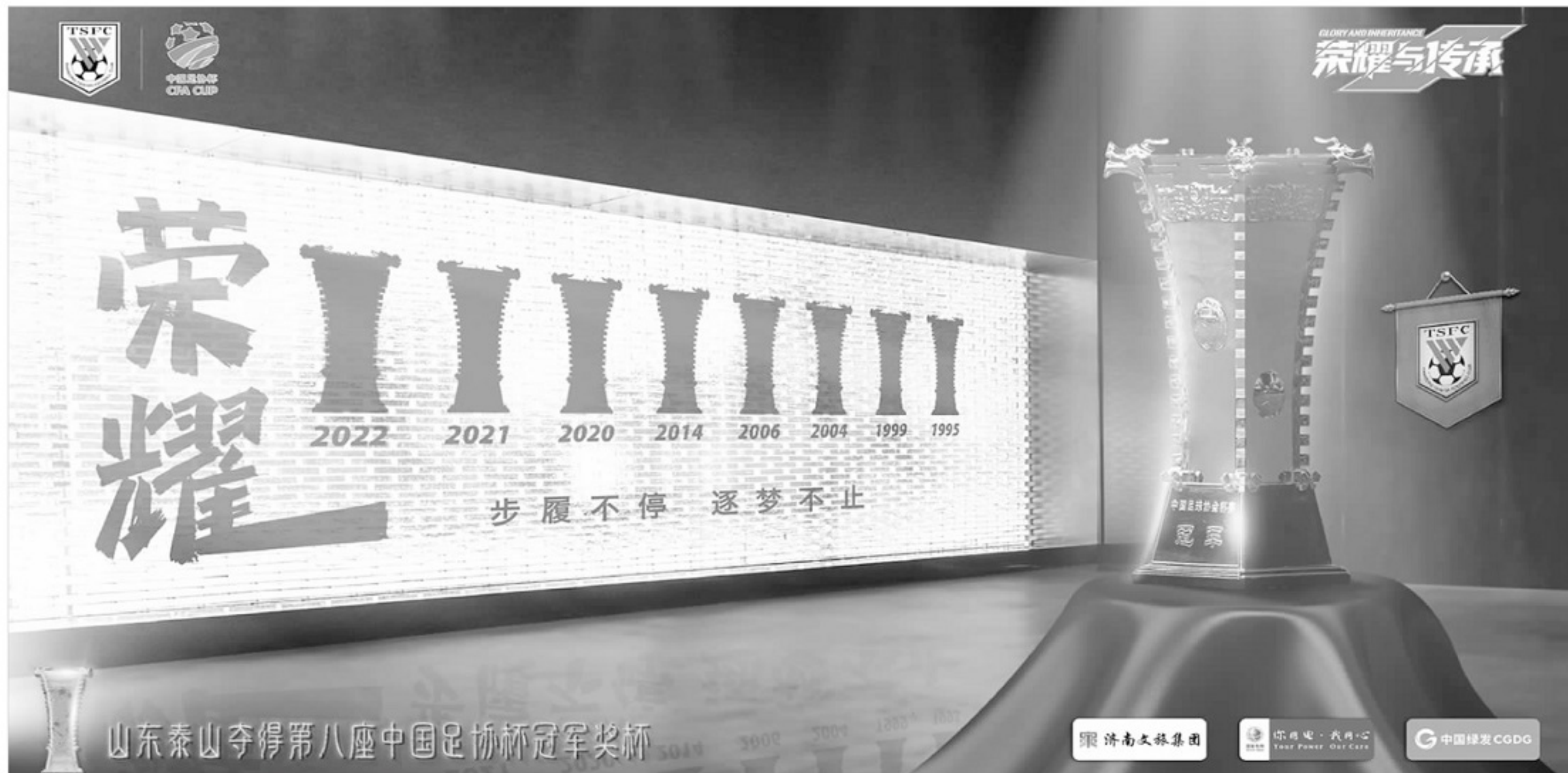
■泰山俱乐部足协杯夺冠官方海报，海报右下角有三大股东 LOGO。

泰山俱乐部的三大股东是济南文旅发展集团（持股 40%）、鲁能集团有限公司（持股 30.69%）、国网山东省电力公司（持股 29.31%），基本上是 433 的股权结构，三家也敲定，俱乐部的资金配套，按照持股比例出资。