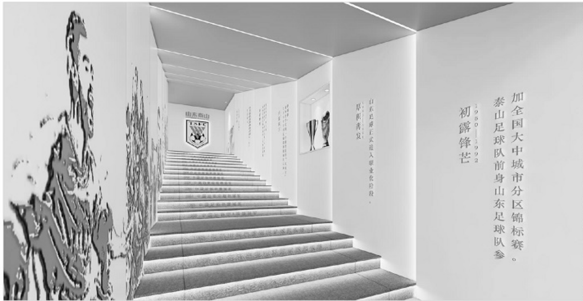
■泰山俱乐部是一步步发展起来的,想要站得更高,必要的投入不能少。

实际上,不仅仅是三方股东,山东省相关方面,也应该发挥应有的作用。原因有两方面,其一,泰山俱乐部是维系天南地北山东人、海内外海外山东人的情感纽带;其二,在 2020 年下半年进行的股改过程中,山东省方面充当的是居中的角色,他们一方面和国网(国网山东省电力公司)和绿发集团(鲁能集团)协商联系,确定股改方向,另一方面和济南市相关方面进行沟通,最终,通过由济南市下属的济南文旅发展集团承接大股东。所以,山东省相关方面也