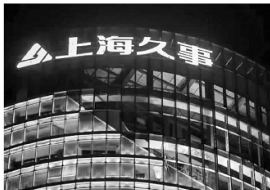
■申花已完成股改,久事集团入主。

当然,这种情况在未来绝不是无法改变的,如果中超足球彩票发行,有可能大幅度缓解职业俱乐部的投入,但这项政策,同样受到很大限制,何时落地,仍是未知数。