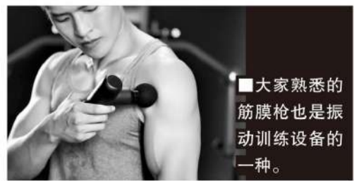
■大家熟悉的筋膜枪也是振动训练设备的一种。

配合振动技术产品最新的迭代发展,训练者可以获得更多高科技和大数据支持,从而更精准地量化肌体与训练效果。