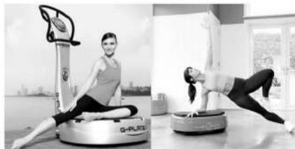
■前代振动训练设备(左)常见于健身房,而新一代产品已经可以方便到在家使用。

振动技术产品之中,最新一代的Power Plate MOVE就将运动爱好者们从健身房解放出来,只需要9分钟的振动训练,就可以达到传统锻炼30-45分钟的效果。这种看上去更像扫地机的产