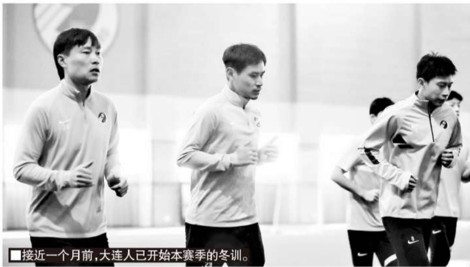
■接近一个月前,大连人已开始本赛季的冬训。

大连人目前面临的欠薪不是小问题,可以说是内忧外患。在万达和一方集团退出之前,留下了不少高薪合同,虽然说当时的国内球员都解约得七七八八了,但也只是解约,欠薪并没有解决。不少球员还拿着解约协议,或是仲裁文件讨要说法,有的还在队内,都等着俱乐部支付被拖欠的薪水。2022 年大连足改小组正式接手后,万达也兑现了承诺,一直在努力归还历史欠款,而且在万达退出、足改小组接手时的公告里特别提及,万达会把所有历史遗留欠薪都归还,而且这个欠薪向前追溯 20 年。除此之外,万达还会负责俱乐部 2022、2023 和 2024 三个赛季,每年 1 亿 5000 万元的中超或 1 亿元的中甲联赛运营费用。比起当初阿尔滨退出时的匆忙,这次万达的承诺要周全许多。既然与大连市委市政府、足球改革小组一起发了公告,就说明万达有信守承诺的决心,只是