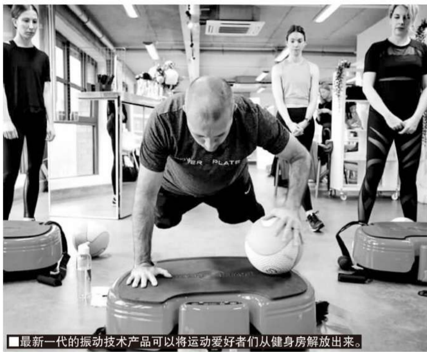
■最新一代的振动技术产品可以将运动爱好者们从健身房解放出来。

品可以调动人体95%的肌肉,而传统锻炼方式仅能调动55%。除了最大化激活肌肉和燃烧脂肪,还能收紧健康的皮肤,增加血液和内循环,以及腰腹核心力量与柔韧性。微振动还可以针对肌肉疲劳或受伤部位,进行针对性的康复治疗,促进可以让肌肉纤维修复的健康血液流动。