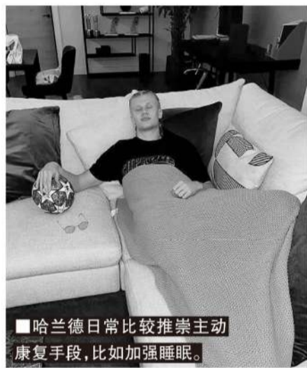
■哈兰德日常比较推崇主动康复手段,比如加强睡眠。

传统运动康复手段之中,“大脑冷却时间”非常重要。这是人体自我调节、恢复状态的重要内在机制,在需要特别集中注意力的射箭、射击、飞镖等运动中被普遍使用。精英运动员运动表现的提升,不仅仅与股四头肌的外来被动刺激有关,更重要的是大脑。对于肌肉的训练确实是基础且有效,不过看看那些出色的马拉松运动员,虽然骨瘦如柴却是人类速度与力量完美的结合体。