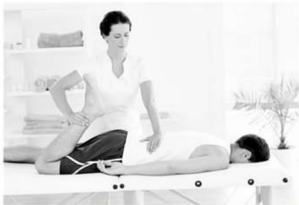
■只有在特定的条件下,按摩治疗才会达到预期的效果。

人体的淋巴系统和循环系统非常重要,而过多和过量的训练会损害人体的微循环,过度的延迟性肌肉酸痛(DOMS)和微损伤是身体不适的首要原因。持续出汗过多并不是身体健康的标志,许多运动员