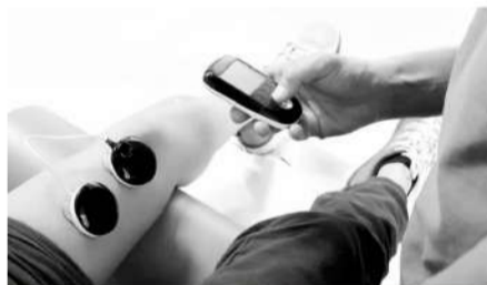
■使用肌肉电刺激解决人体内产生的乳酸,实际效果很难精准量化。

事实上,任何外部刺激康复手段,都不可能快速帮助运动员重塑或生长肌肉组织,除非是外科手术。NMES(神经肌肉电刺激)对减少水肿现象有帮助,不过被动治疗本身是对人体机能的外在干预,是否能被人体这个复杂的系统更好地接受,都是个问题。任何外在刺激的被动治疗,也同样会产生一定的副作用。尤其体现在过度刺激血液流速和带氧量方面,可能会为精英运动员产生更多的心脏负担。