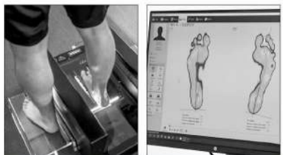
3D 打印鞋垫未来将是马拉松跑者的标准装备。

即便是顶级马拉松运动员,也很难拥有基普乔吉在2019年挑战跑进2小时的优渥辅助条件。当时组委会设置了长达9天的时间,只等最好的天气条件才进行挑战。比赛地的普拉特公园有超长的直道,9.6公里的赛道两侧高大的树木挡住了侧风。多达36名陪跑人员帮助他保持节奏,其中5人在他身前以V字形队列领跑,为他减少空气阻力;