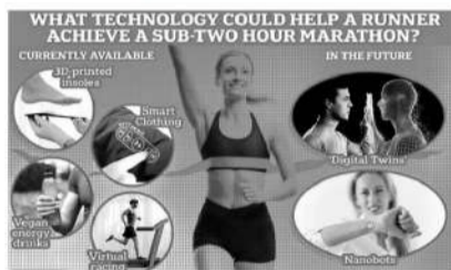
想成为顶级跑者,需要全副武装。

■目前还没有人能在正式的马拉松比赛中跑进两小时内,长跑天王基普乔吉2019年曾在奥地利跑进2小时,但因赛事方采取了特殊的辅助手段,所以那个成绩没有被国际田联认可。但随着科学技术的日益发达,人类两小时内跑完马拉松的那一天相信会很快到来。