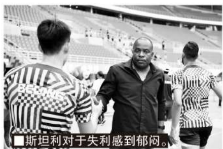
斯坦利对于失利感到郁闷。

斯坦利比所有人都清楚这一点,这样大比分的比赛不是常态,国安需要解决的问题还有很多,尤其是在进攻端,教练组花了更多的心思研究,怎样让进攻更高效。