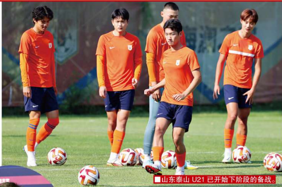
■山东泰山U21已开始下阶段的备战。

《足球》:8月份开始第二个阶段,届时A组和B组的球队会分在一起,单循环比赛,强队更多,比赛更激烈和残酷,球队有人员调整的计划吗?