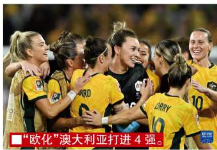
“欧化”澳大利亚打进4强。

相比男足,中国女足球员是有机会在女足5大联赛立足的,所以,在未来,必须坚定的走留洋这条路,而且,要去水平更高的联赛和球队。