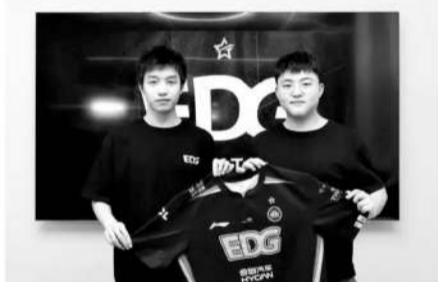
■Uzi6月复出加盟EDG的话题在当时引爆网络。

Uzi作为最有资格进入中国电竞名人堂的传奇选手,自复出的相关消息被传出后就长期霸榜各类热搜,在社交媒体上,“EDG Uzi”的热度完全不亚于5月份两支LPL队伍淘汰LCK,首次会师MSI总决赛时的热烈场面。