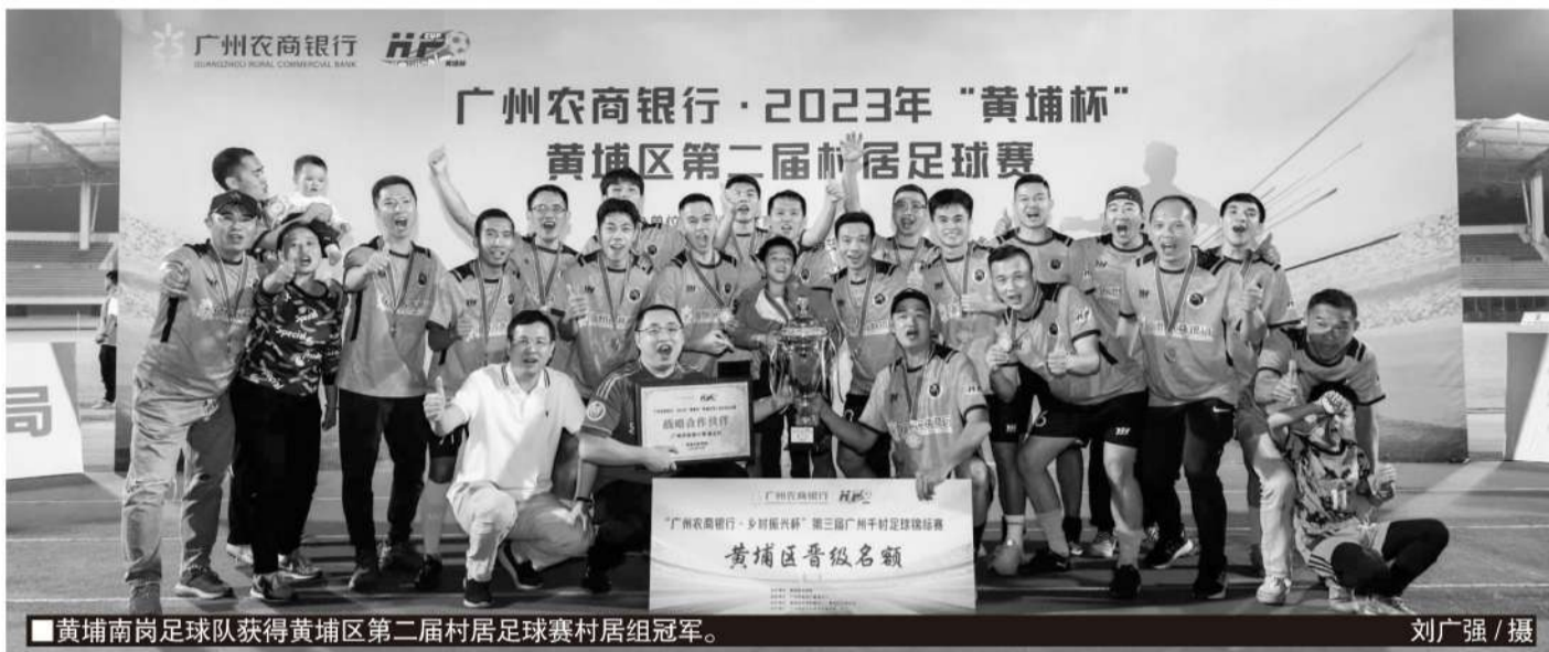
■黄埔南岗足球队获得黄埔区第二届村居足球赛村居组冠军。

本届比赛的科技含量和文化内涵也得到提升，通过增加直播场次，增强民众的观赛体验，同时及时更新赛事数据，并为每支队伍定制了球衣装备。“2023年是‘村超’热度不断升华的一年，广州作为国内传统足球城市，也需要展示我们的足球文化，本届比赛也很好地做到了这点。”黄