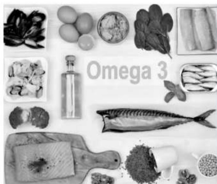
天然食材被认为是增加 Omega-3 摄入量的最佳方式。

普通运动爱好者想要摄入 Omega-3,可以通过食用鲑鱼、沙丁鱼、金枪鱼、鲱鱼、鳕鱼、鲭鱼和鳟鱼等冷水鱼。海藻、藻类和一些贝类如虾和磷虾,也是很好的来源。食物来源被认为是增加 Omega-3 摄入量的最佳方式,当然也可以通过补充剂摄入。多数 Omega-3 补充剂的鱼油含量为 1000 毫克(1 克),成年男性 Omega-3 每日推荐摄入量为 1.6 克,成年女性每天 1.1 克。对于职业运动员,专家建议每天摄入 1-2 克 Omega-3。