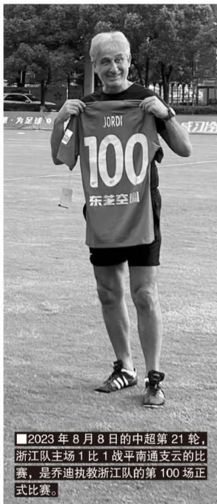
■2023年8月8日的中超第21轮,浙江队主场1比1战平南通支云的比赛,是乔迪执教浙江队的第100场正式比赛。