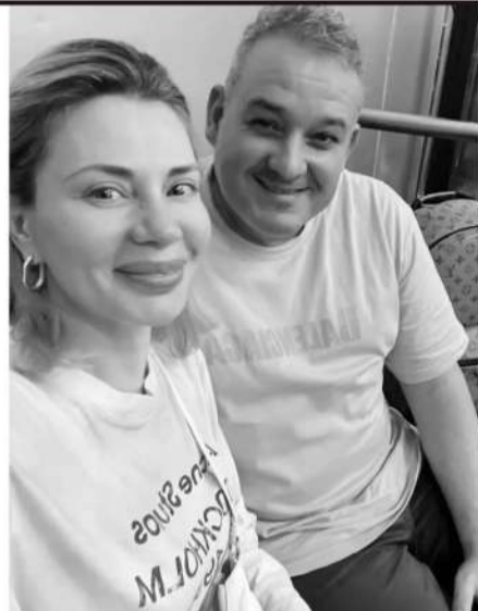
■萨尔瓦多教练入围中甲联赛最佳教练的评选,他也开始了和家人欢度的假期。

如果再加上前几个赛季的球员历史欠薪,广州队目前确实存在不少历史遗留的拖欠薪水的问题,虽然总体费用在几千万元的范围之内,但对于目前的广州队来讲也很艰难。据了解,接下来广州足球俱乐部上下将以招商引资为主线,全力推动广州队可持续健康发展,随着广州队青训体系不断在全国比赛中取得优异的成绩,未来几年内广州足球有机会重返顶级联赛,广州队的可持续健康发展将是广州足球