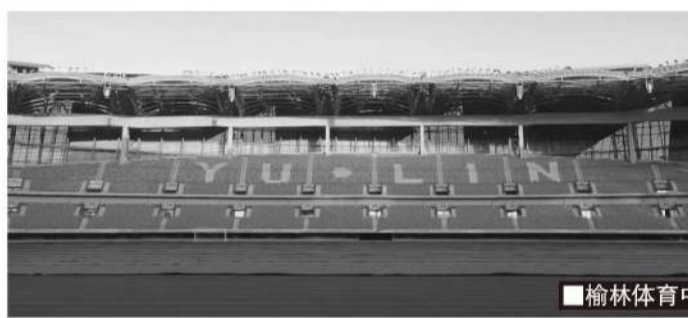
榆林体育中心主体育场。

2023年,陕西省17运在榆林成功举办,盛大的赛事也为榆林留下了丰富的体育“财产”,“一场两馆”及户外运动广场组成的榆林市体育中心,总占地面积约772亩,主体育场能够容纳32000人,是城市新地标。天之骄子的主场就在榆林体育中心,其主体育场整体呈古铜色,外形寓意是“沙漠里的玫瑰”。在榆林这片足球荒漠中,有一朵玫瑰已经悄然生根,即将绽放。