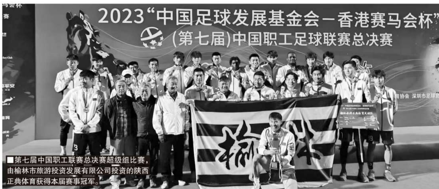
第七届中国职工联赛总决赛超级组比赛,由榆林市旅游投资发展有限公司投资的陕西正典体育获得本届赛事冠军。