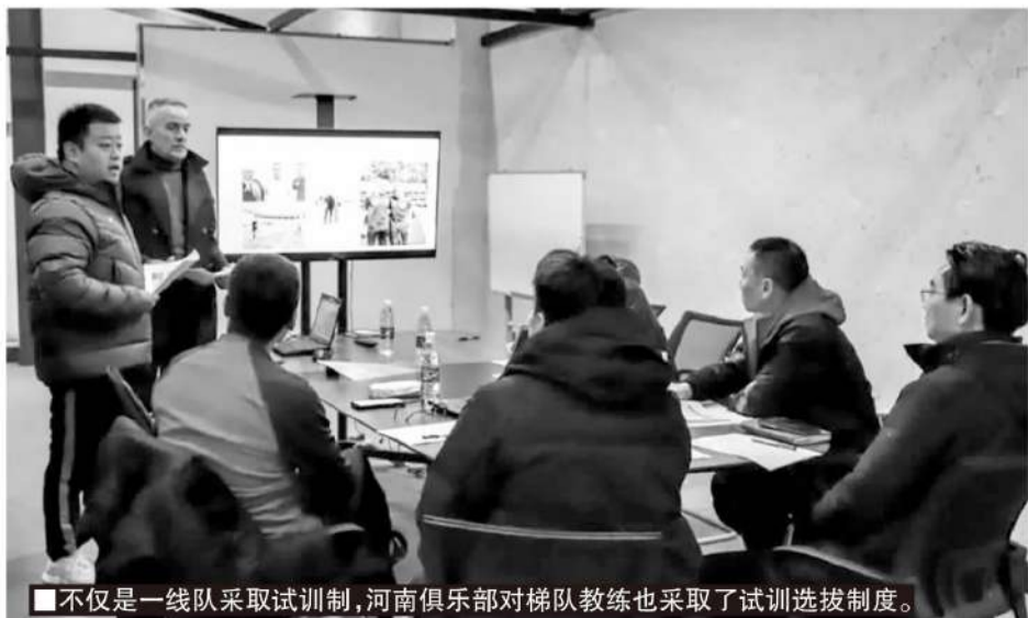
■不仅是一线队采取试训制，河南俱乐部对梯队教练也采取了试训选拔制度。