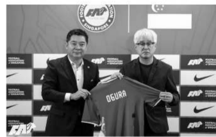
■新加坡足协主席陈国强与新加坡队主帅小仓勉(右)。

提及亚洲杯上的马来西亚队:“马来西亚与韩国队世界排名差距超过100位,但补时第15分钟逼平韩国队。人们说这是奇迹,但我认为这是球员共同努力的结果。”