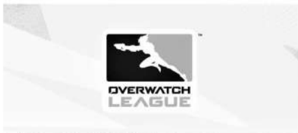
■基于营收压力,《守望先锋联赛(OWL)》被迫结束。

在 2024 年,整个中国电竞产业需要找出破局的新思路。或许,拉拢尚对电竞保持着高昂投资热情的中东土豪入局,不失为一步妙招。