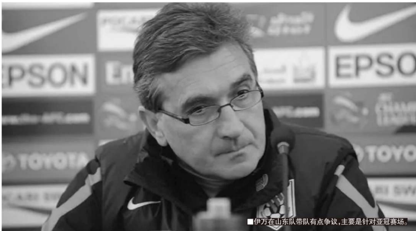
■伊万在山东队带队有点争议,主要是针对亚冠赛场。

目前来看,国足选帅的首要目标自然是熟悉和了解中国足球或者亚洲足球的教练,在这个方面,伊万科维奇、奎罗斯等