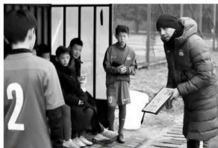
■不仅一线队，今年河南俱乐部多支梯队也一同前往广东进行冬训。

其实这些要求也不光对中国球员，也包括外援。你也接触过很多韩国教练，包括从日韩联赛过来的外援，他们到了中国联赛后会有一个明显变化，就是生活中会有一些散。但是他们在日韩联赛中，却不是这样，环境的转变会改变一个人。所以，我们对外援的要求也一样。