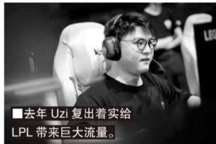
■去年 Uzi 复出着实给 LPL 带来巨大流量。

在意甲被称为“小世界杯”的年代,几乎世界上有一半的顶级球星在此效力。进入到 21 世纪之后,英超在足球世界中的地位逐步取代意甲,如今已然是世界顶级联赛,顶级球星的数量已经媲美当年的意甲。