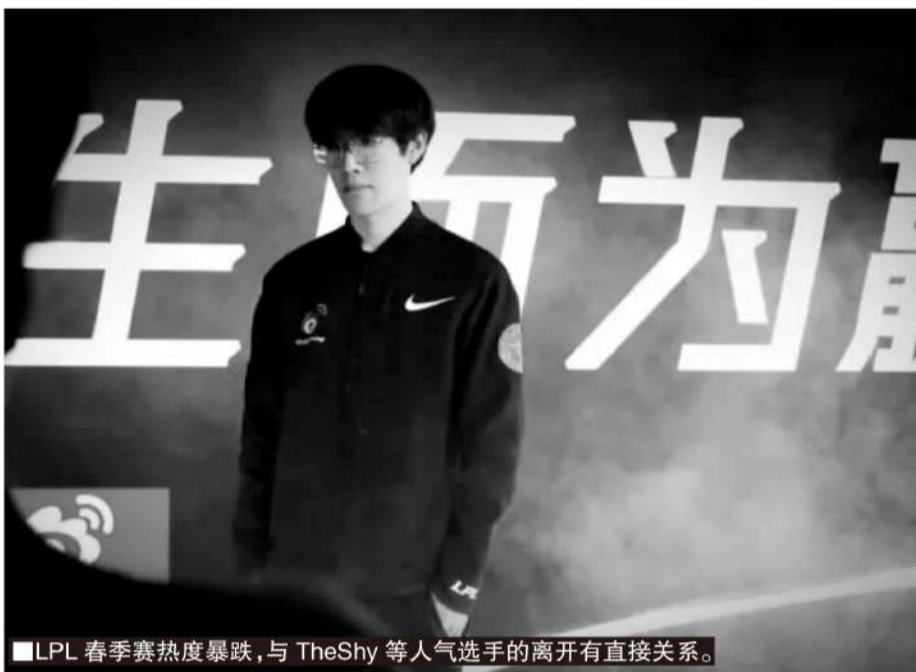
■LPL 春季赛热度暴跌,与 TheShy 等人气选手的离开有直接关系。

随后在去年的 S13 世界赛上,Faker 带领 T1 实现了“四冠登神”的壮举,在八