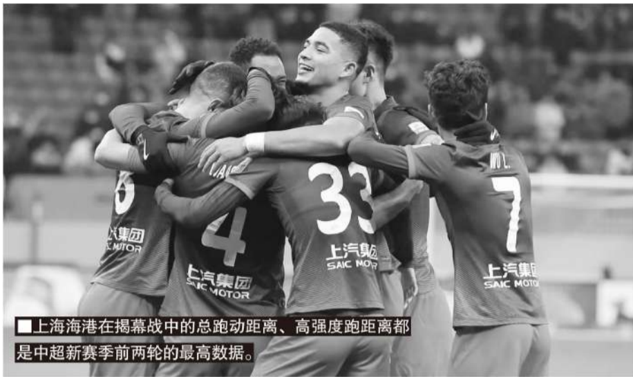
上海海港在揭幕战中的总跑动距离、高强度跑距离都是中超新赛季前两轮的最高数据。

乐部回到杭州后,积极进行宣传,组织了多种场外活动吸引球迷观赛,第二轮的上座高达32087人,是球队的中超历史最高上座率,更远超去年球队平均的8053人,杭州也成为了中超球市的新看点。