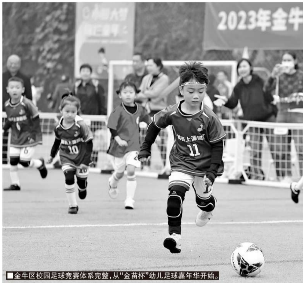
金牛区校园足球竞赛体系完整,从“金苗杯”幼儿足球嘉年华开始。

推动金牛区校园足球几乎普及到全区中小学幼儿园的局面,离不开金牛区教育局下属的校园足球办公室的高效工作。在成都市,金牛区率先成立校园足球办公室且是唯一有工作专班的实体办公室,由区教育局分管副局长担任主任,德体卫科科长兼副主任,还设有一名常务副主任主持工作。金牛校足办设有4名教师编制工作人员,还有1名聘用工作人员。