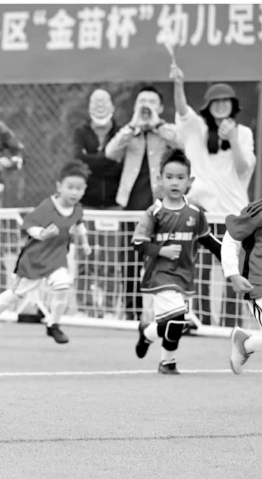
区拿了四项冠军,2023年则拿了三项冠军,均以20分以上的领先优势获得团体总分第一的佳绩。

现在,金牛区校足办把全区的青训俱乐部、学校共计10名优秀教练(8名主教练、2名守门员教练)抽调到一起,组建了小学各年龄段男女8支金牛区代表队,还是坚持每周定期定点进行足球训练。