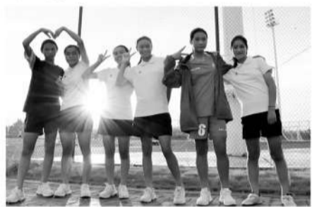
金牛区对口凉山州布拖县开展教育帮扶,以校园足球打造帮扶品牌“微光行动”。

2022年,成都市创新实施“631”学校足球项目布局和运动队建设模式,形成小学、初中、高中梯次衔接的“一条龙”青少年足球后备人才培养机制。陆军所说的“教育部631试点”就是指这项工作,而金牛区已在实质上做到了631布局,并且有所超越。