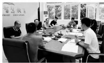
金牛区校足办每年都会举行校园足球服务青训机构入库比选活动。

现在,金牛区校足办把全区的青训俱乐部、学校共计10名优秀教练(8名主教练、2名守门员教练)抽调到一起,组建了小学各年龄段男女8支金牛区代表队,还是坚持每周定期定点进行足球训练。