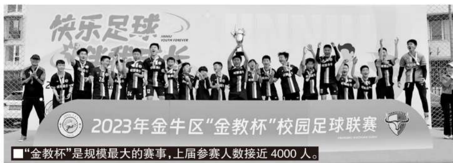
“金教杯”是规模最大的赛事,上届参赛人数接近4000人。

以“向训练要质量,向比赛要成绩”理念推进满天星训练营建设,面向全区进行选拔,每周训练,近几年开始出效果。2020年金牛区包揽了成都市小学生运动会足球项目男、女子冠军。2022年成都市中小学生会足球项目的8个组别中,金牛