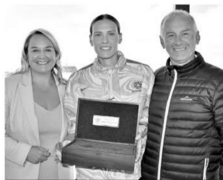
范埃格蒙德(右)和他的传奇女儿(中)。

当我第一次来到球队的时候,我和队员们经过讨论和投票,选出了三个能代表我们球队的词语——团结、勇敢、精神力。这三个词代表着我们的球队,也是我们这支队伍的价值观念,同时这也反映了中国人民的优秀品质。在这之后,我们通过在训练课当中、在球员间的相处当中、在球员和球迷的相处中,在球场、机场、酒店,我都会让球员们把这三个词的含义展现出来。接下来,我希望我们能在亚洲杯当中把这三点发挥出来,让所有人看到我们的表现。