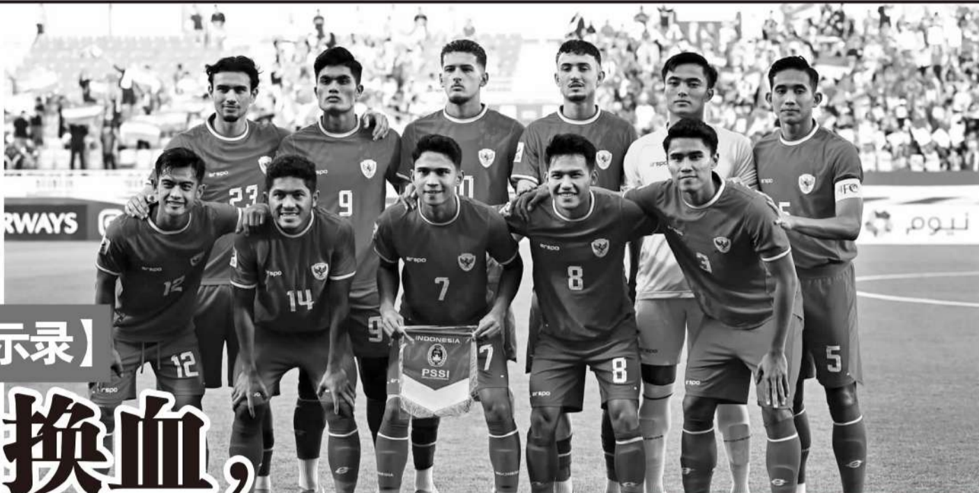
▲本届 U23 亚洲杯第四名的印尼，在归化球员以及国家队年轻化方面都做得相当出色。

U23 亚洲杯 16 支参赛队内均有球员为成年国家队出过场，超过 100 名球员有过成年国脚履历；16 支参赛队仅 5 队没有归化球员。按照目前的发展趋势，中国足球未来将会在亚洲赛场遇上更大的困难。