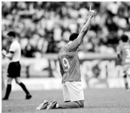
■中甲第九轮,阿雷格利亚的唯一进球(点球)帮助广州队击败了当时的领头羊大连英博。

这首先要感谢教练组的辛勤工作。在比赛前的一周,他们都会结合不同对手来制定训练计划,帮助我们调整到最佳。其次,我们每人、每天都朝着自己的目标努力前进,坚信自己能成为最好的球员,我们相信自己能击败联赛里的任何对手。