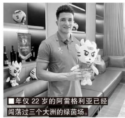
■年仅22岁的阿雷格利亚已经闯荡过三个大洲的绿茵场。

感谢球迷一直以来的支持,无论在主场还是客场,球迷的支持对我们非常重要。希望球迷们能继续到现场支持我们,坐满看台,给予球队最大支持。