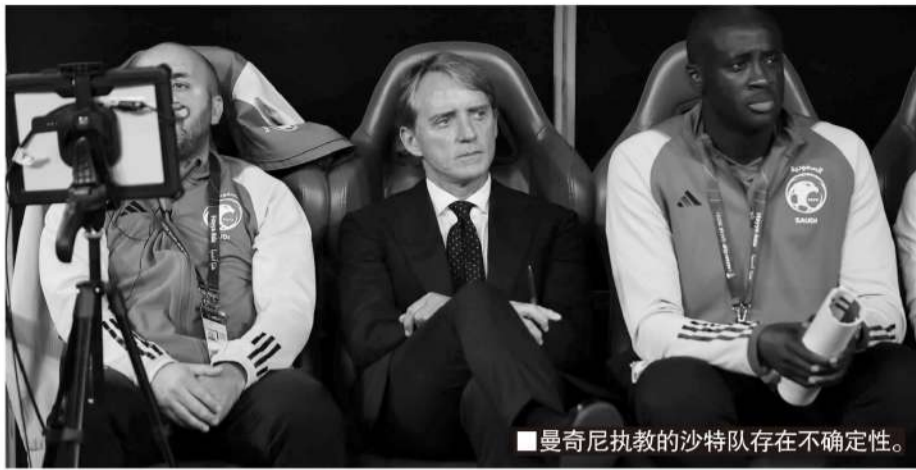
■曼奇尼执教的沙特队存在不确定性。

作为亚洲区世界排名最高的球队,有过大胜德国、土耳其、秘鲁和加拿大这样的欧美强队的经历,日本队一度被外界认为是“亚洲独一档强队”。不过,他们在亚洲区比赛里也有很多艰难时刻。亚洲杯日本队小组赛输给伊拉克,淘汰赛输给伊朗,最终无缘四强。36 强赛主场与朝鲜队交手,苦战之下,一球小胜过关。18 强赛抽签后,日