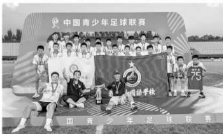
长沙雅礼外国语学校U13成为首支夺得中青赛男子组冠军的校园球队。

“队员们欣喜若狂，比赛结束他们把我扔到空中了，当我下落的时候，心里突然很踏实，有种如释重负的感觉。”雅礼外国语学校主教练文帆赛后说。重负源自