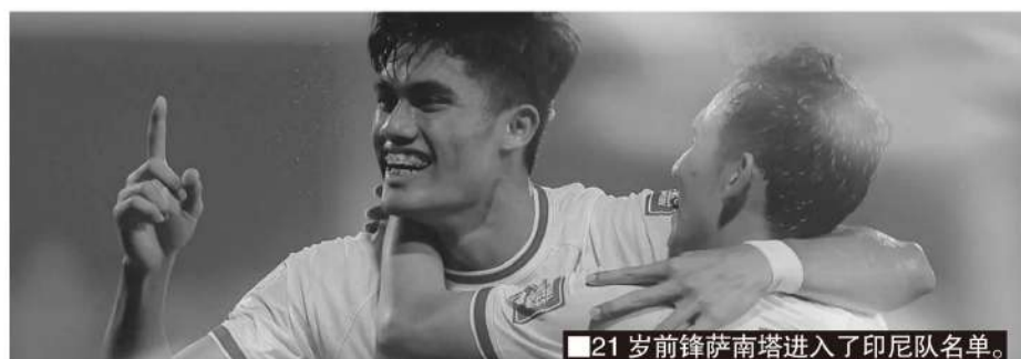
21岁前锋萨南塔进入了印尼队名单。

印尼足协主席托希尔在8月21日召集申台龙教练组开会，详细讨论9月18强赛大名单的人选。印尼队26人大名单将在近期公布，全队将于8月29日集中。