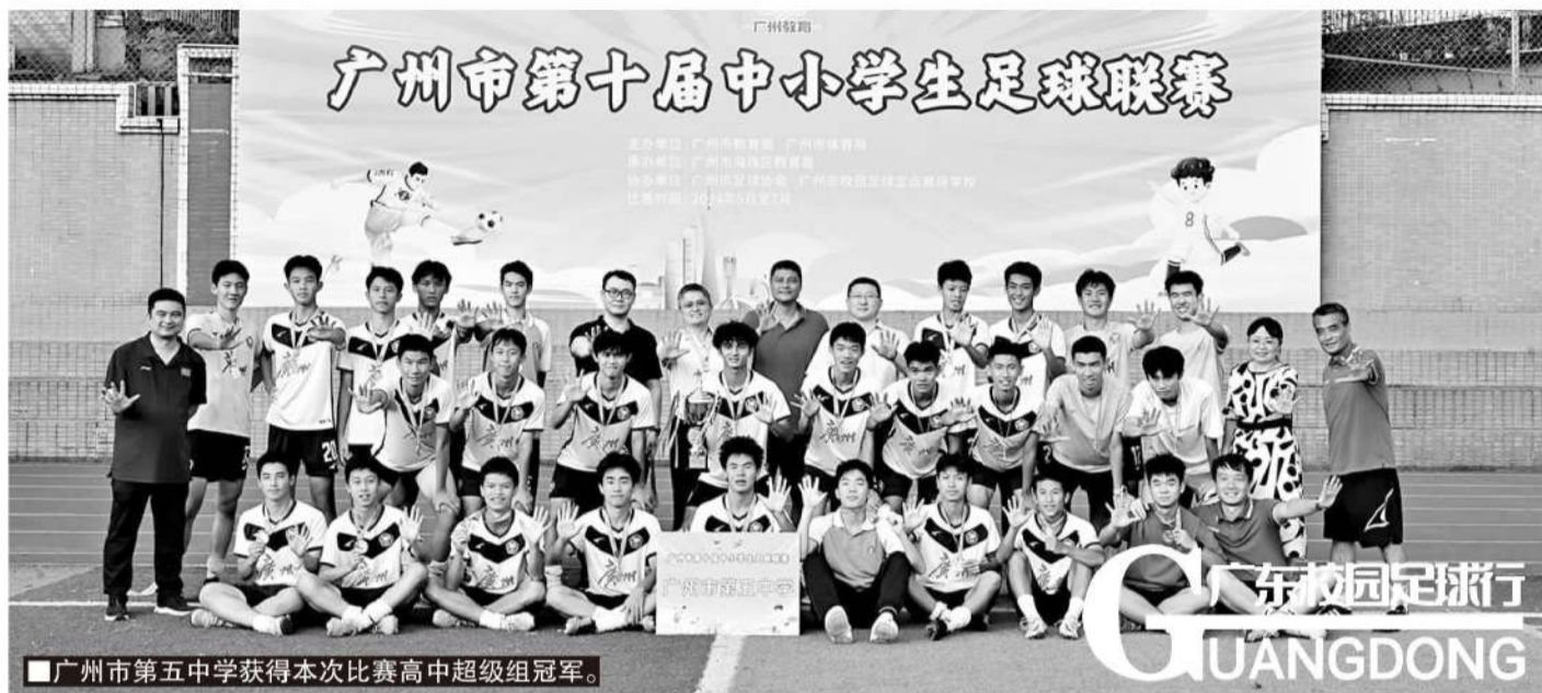
■广州市第五中学获得本次比赛高中超级组冠军。

得到进一步完善,但还需再做一些努力,才能达到“完美”状态。对于下一届比赛,钱潇敏希望能在小学和初中两个学段再做细分,首先是设置小学U8男女子组,以此将比赛真正延伸到小学低年级球员;其次是将初中女子组拆分,高水平队伍踢11人制,普通水平队伍踢8人制,以此促进初高中女子足球的衔接。“如果小学U8组和初中女子组这两个计划能够实现,那么我们的赛事就能真正实现全年龄覆盖,同时不同学段之间还能做到合理过渡衔接,那时候广州市中小学生足球联赛就真是一项完美的比赛了。”