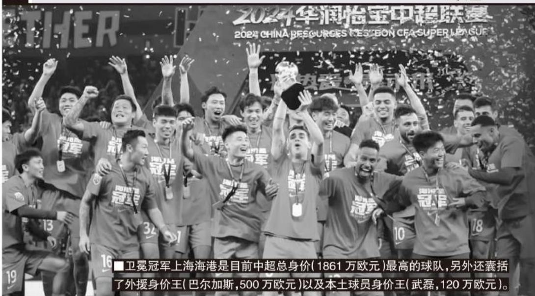
卫冕冠军上海海港是目前中超总身价(1861万欧元)最高的球队,另外还囊括了外援身价王(巴尔加斯,500万欧元)以及本土球员身价王(武磊,120万欧元)。