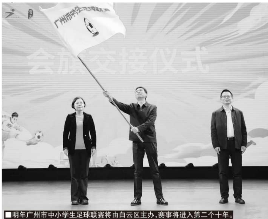
明年廣州市中小學生足球聯賽將由白雲區主辦，賽事將進入第二個十年。

和廣州市唯一的“全國首批足球試點區（縣）”，海珠區擁有全國青少年足球特色學校24所，廣東省校園足球項目推廣學校7所，廣州市校園足球項目推廣學校38所，廣州市校園足球重點基地學校9所，全國足球特色幼兒園4所。如今，海珠區校園足球聯賽的構造是上學期進行U8、U10、U12、U13、U15、U18聯賽，下學期進行U7、U9、U11、U14、U16-17聯賽，實現了從小學到高中（含中職）全年齡、全學年的覆蓋。