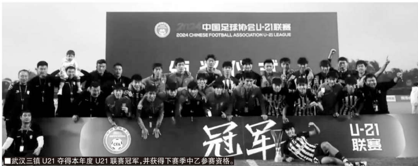
■武汉三镇 U21 夺得本年度 U21 联赛冠军,并获得下赛季中乙参赛资格。