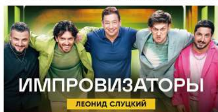
斯卢茨基的身影出现在俄罗斯综艺《即兴创作者》第2季中。

斯卢茨基举例称,英格兰球员会直接询问教练为何不让自己出场,教练也会直接说明他在哪些方面输给了队内的竞争对手,英格兰球员会表示接受并与教练握手后离开。荷兰球员询问同样问题,教练就要改变措辞,说明他的状态糟糕,但强调他是最好的球员,希望未来他能成为巨星,因为荷兰球员从小就被所有人告知自己是最好的,直言不讳可能会导致球员心