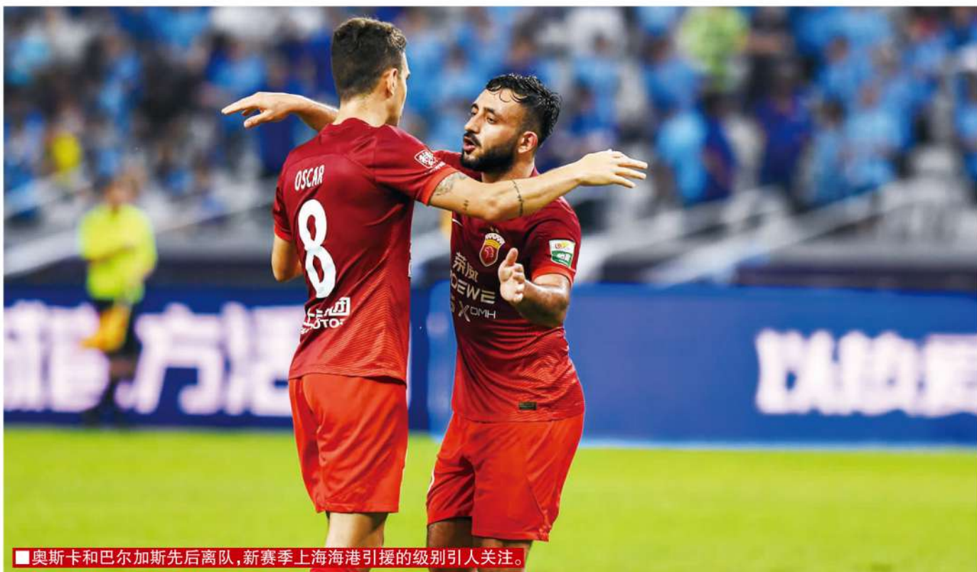
■奥斯卡和巴尔加斯先后离队,新赛季上海海港引援的级别引人关注。

从目前各俱乐部所提出的需求来看,100万欧元左右身价的外援会是争冠和保级区俱乐部选择的一个分水岭。中下游俱乐部体量有限,选择外援一般是将性价比放在首位,更加倾向于有过亚洲联赛经验的外援,或者在中国联赛效力过的外援。100万欧元的身价对他们来讲是个坎,甚至有些俱乐部只会将资金集中砸在一个位置上。中上游俱乐部类似海港、山东以