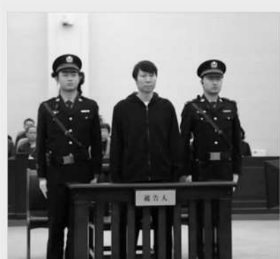
■3月28日,李铁受贿、行贿、单位行贿、非国家工作人员受贿、对非国家工作人员行贿案在咸宁市中级人民法院一审开庭,12月13日,李铁被判有期徒刑二十年。

2024年是中国足坛反腐扫黑工作第一阶段的收官之年,涉案的相关人员在这一年都先后被公开宣判,这预示着重拳治理下的中国足球生态将实现根本性好转,