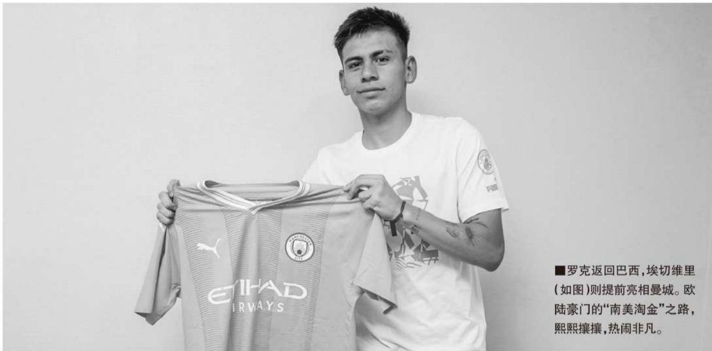
■罗克返回巴西,埃切维里(如图)则提前亮相曼城。欧陆豪门的“南美淘金”之路,熙熙攘攘,热闹非凡。

记者寒冰报道 刚过去的一周,欧洲足坛发生了两宗典型的南美“半成品”球员交易——巴西前锋罗克两年前18岁时被巴萨以最高价7400万欧元豪购,两年后20岁以2500万欧元低价被退回巴西;同时曼城官宣去年初签下的阿根廷19岁小将埃切维里正式入队,转会费高达2350万欧元。