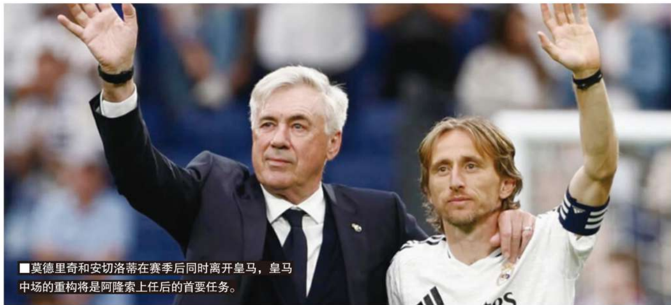
莫德里奇和安切洛蒂在赛季后同时离开皇马，皇马中场的重构将是阿隆索上任后的首要任务。

记者寒冰报道 随着莫德里奇的离开，最近10年皇马黄金时代的“典礼中场”正式成为历史。皇马为搭建“银河舰队三期”，已经投资了近2.9亿欧元在中场购入7名新人。但经过这个四大皆空的赛季，证明皇马中场的重建依然没有完成。贝林厄姆(身价1.8亿欧元)、巴尔韦德(1.3亿)、楚阿梅尼(8000万)和卡马文加(7000万)们各有所长，却缺少莫德里奇这样能掌控攻防节奏和控球率的大师级能力。