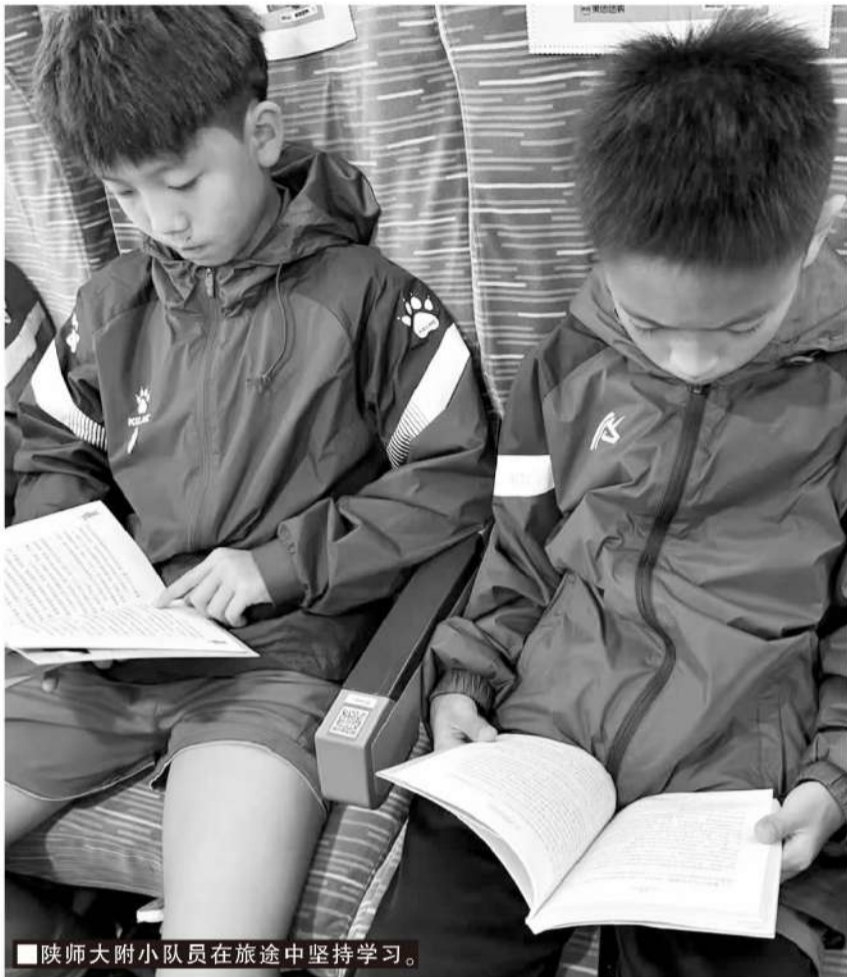
■陕师大附小队员在旅途中坚持学习。

足球课，大课间的跑步锻炼，三、四年级的学生进行的是运球跑。周而复始的运球并不白练，除了增加球感，每年的冬季运动会上增加的“迎面接力运球跑”，也起到了赛事反向引导训练的效果。