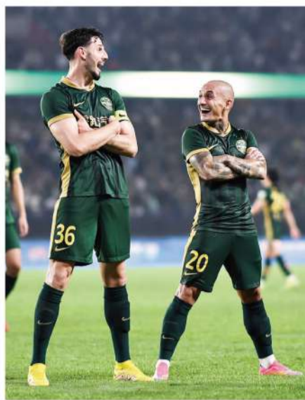
加盟不到半年，米特里策很快成为球队的进攻核心之一。

下大功，重返欧洲赛场后不仅登陆意甲，还在2024年欧洲杯上有高光表现。斯坦丘不仅是米特里策这名罗马尼亚现役国脚投身中超的部分原因，也明显是他最好的学习效果对象。