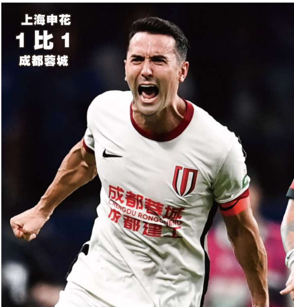
上海申花 1 比 1 成都蓉城