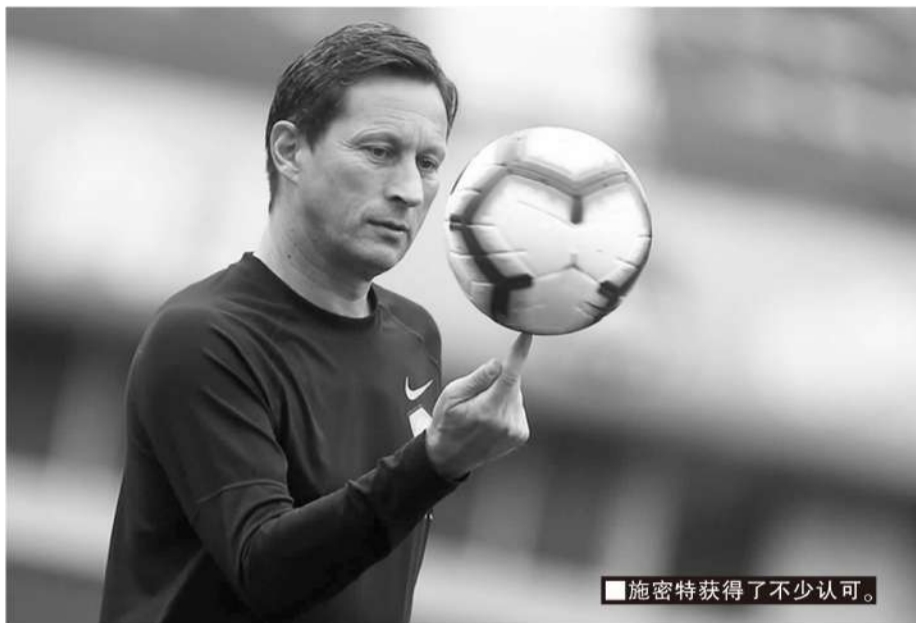
■施密特获得了不少认可。

如果选择代理主帅,集训其实没有太大的意义,无论是人员还是技战术层面,都无法体现新主帅的意见,新任国足主帅上任之后,肯定会根据自己的要求去筛选一遍队员。从目前情况看,10月国足很有可能不安排集训以及热身比赛。与其勉强10月进行国足集训,还不如集中精力做好U23国家队的集训。