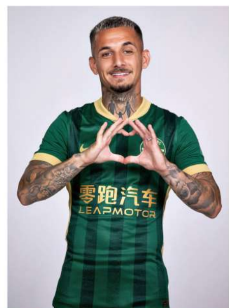
这个爱心手势，米特里策想献给妻子。