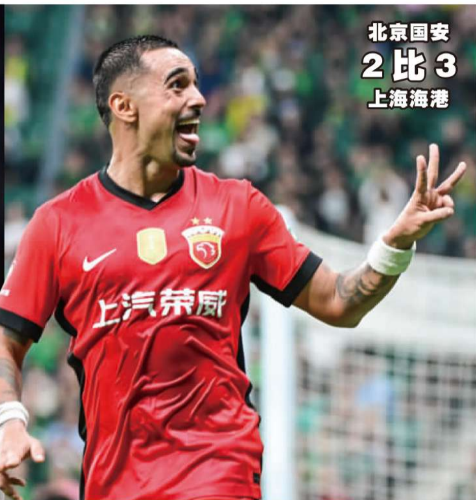
北京国安 2 比 3 上海海港

记者陈永报道 成都蓉城的读秒绝平，为这轮跌宕起伏的争冠大战画上了一个神奇的句号。在联赛还剩下最后 5 轮的情况下，北京国安率先掉队，落后蓉城海港两队 6 分，追赶的难度实在太大。上海申花争冠难度也开始变大，除了积分落后 3 分之外，更重要的原因是他们在和成都蓉城及上海海港的胜负关系中处于劣势。