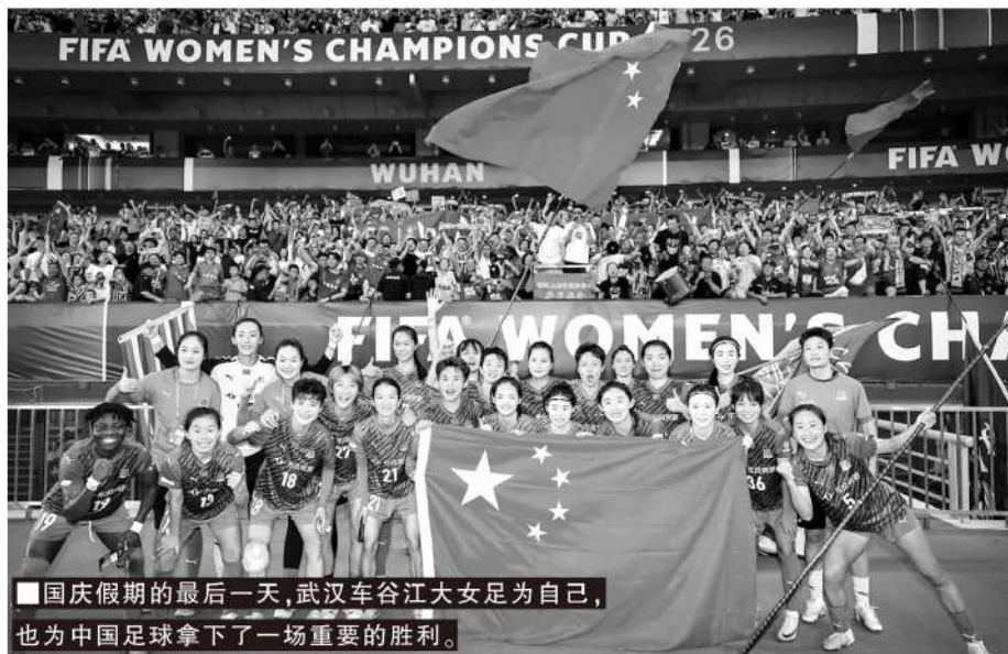
■国庆假期的最后一天,武汉车谷江大女足为自己,也为中国足球拿下了一场重要的胜利。

赛后,国际足联主席因凡蒂诺第一时间发文祝贺武汉女足:“祝贺中国武汉车谷江大女足,她们成为了国际足联最新俱乐部赛事——FIFA女足冠军杯中第一支赢得