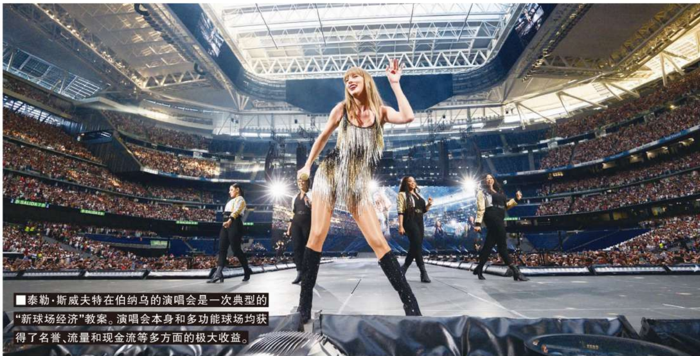
■泰勒·斯威夫特在伯纳乌的演唱会是一次典型的“新球场经济”教案。演唱会本身和多功能球场均获得了名誉、流量和现金流等多方面的极大收益。

撰稿/寒冰 欧洲顶级俱乐部如何赚钱?或者说如何维持运营?三大经济支柱——票房、版权、赞助——即使在流媒体时代仍然未变,但其内在的增长空间却有变化。