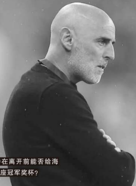
■穆斯卡特在离开前能否给海港再留下一座冠军奖杯？