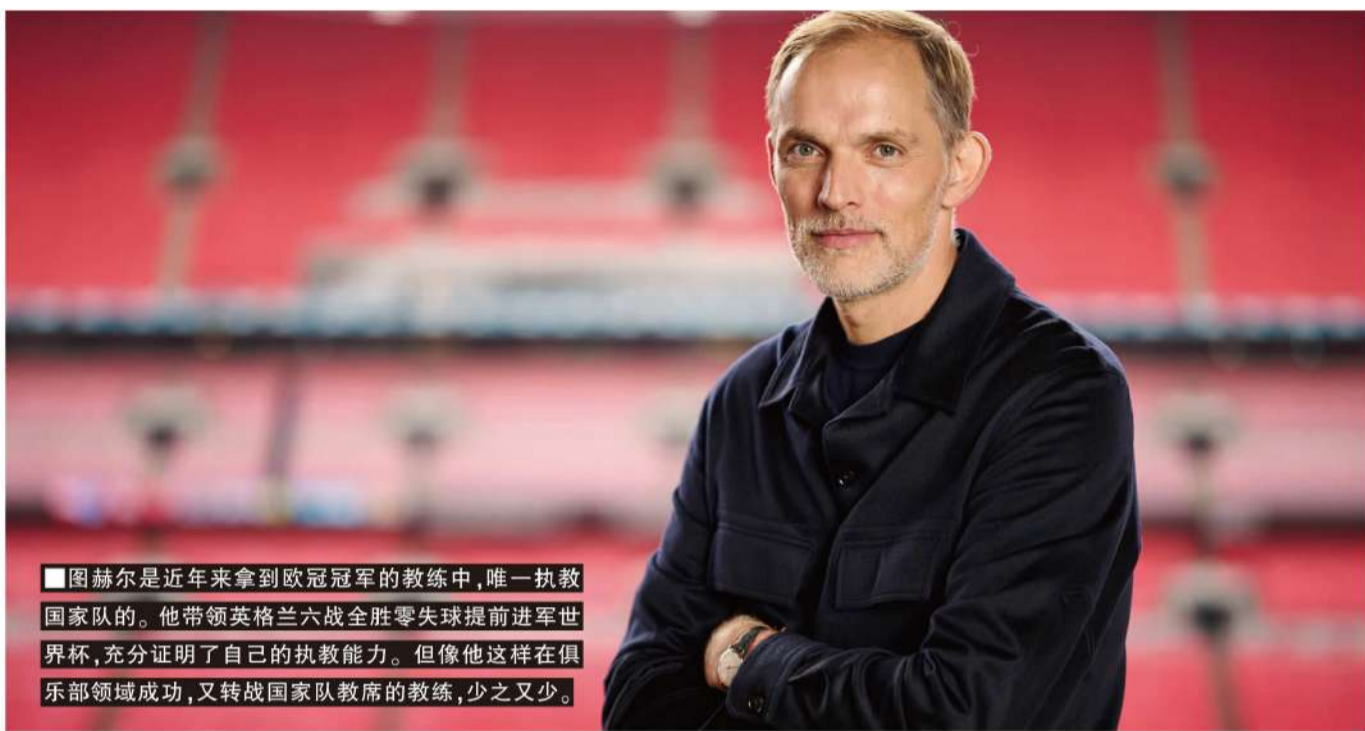
■图赫尔是近年来拿到欧冠冠军的教练中,唯一执教国家队的。他带领英格兰六战全胜零失球提前进军世界杯,充分证明了自己的执教能力。但像他这样在俱乐部领域成功,又转战国家队教席的教练,少之又少。

撰稿/寒冰 10月刚结束的国际比赛日,已有4支国家队发生主帅离职:斯托伊科维奇(塞尔维亚)、托马森(瑞典)、哈塞克(捷克)和克鲁伊维特(印尼)。更令人唏嘘的,是10月国际比赛日前刚上任乌兹别克斯坦的卡纳瓦罗,以及72岁高龄执教阿曼的奎罗斯。前者在意大利无人问津,被遥远的中亚足协聘为上宾;后者失业一年半后继续在西亚上岗,但短短三天内两场附加赛,让他为期一年的合同失去意义。在“国家队主帅”这一职位上,魔幻的事情越来越多。