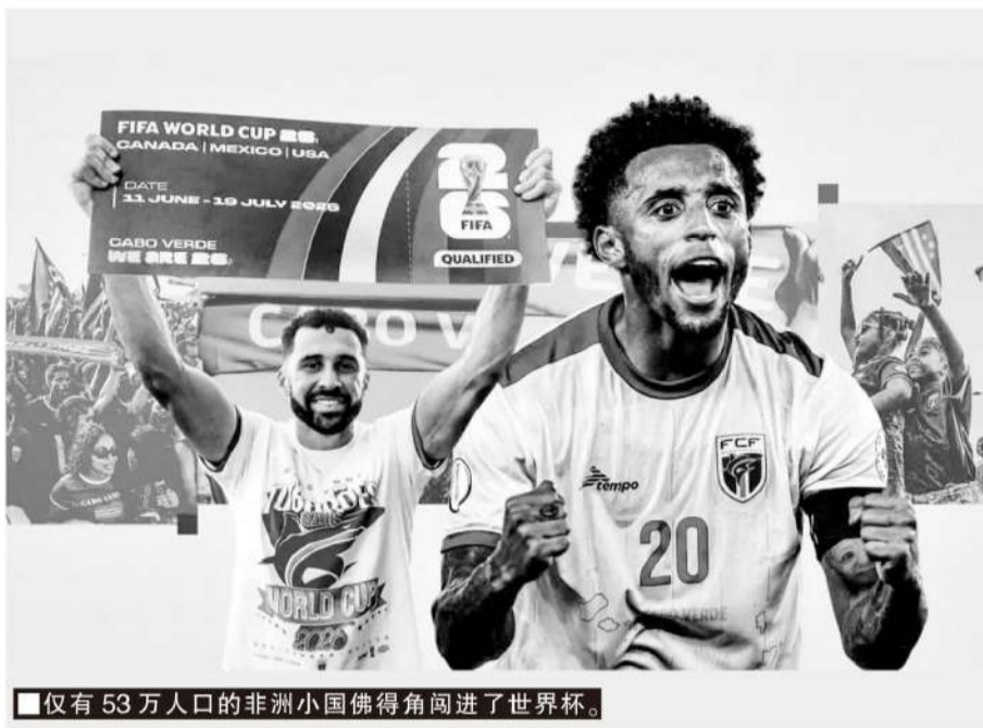
■仅有53万人口的非洲小国佛得角闯进了世界杯。

突尼斯26人大名单中14人出生于海外,分别来自法国(11人)、德国(1人)、瑞典(1人)和挪威(1人),其中4人都曾