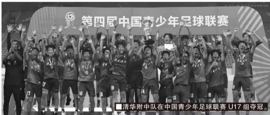
■清华附中队在中国青少年足球联赛U17组夺冠。

前已经全部完赛,最终的冠军归属为:男子U13组冠军恒大足校U13队,男子U15组冠军山东泰山U15队,男子U17组冠军清华附中U17队,男子U19组冠军山东泰山U19队。