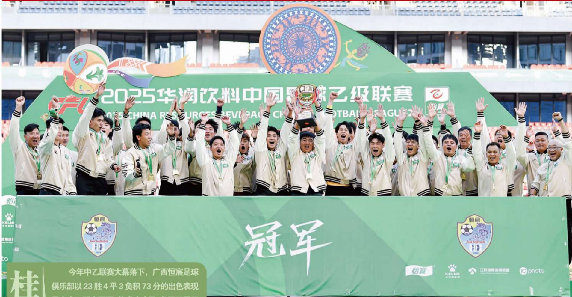
■10月26日,2025中乙联赛落幕,广西恒宸捧起冠军奖杯。