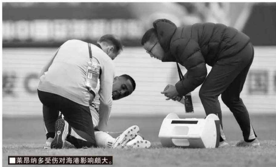
■莱昂纳多受伤对海港影响颇大。

考虑到本场比赛的重要性,穆斯卡特一改往日习惯,提前一天抵达济南进行最后备战,然而突发伤病又让球队猝不及防。赛前一天训练,加布里埃尔和蒋光太