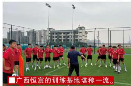
广西恒宸的训练基地堪称一流。

每年参赛球队的数量是不一样的,而且最近这几年,中乙联赛的赛制也不一样,所以我觉得这方面不能按照一个标准去比较。我们就是专注于比赛,一场一场拼。