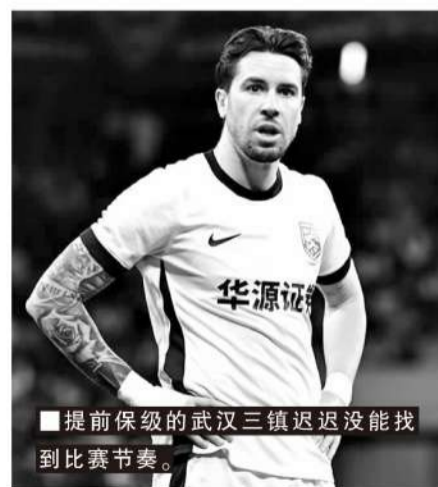
■提前保级的武汉三镇迟迟没能找到比赛节奏。

如今,保级悬念的最终揭晓已进入倒计时。武汉三镇的这场失利,将保级战的紧张感推向顶峰,海牛手握主动权,梅州