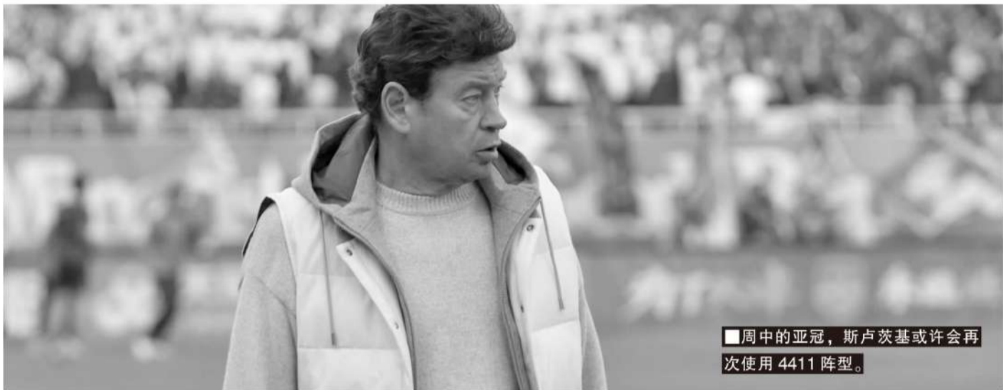
■周中的亚冠，斯卢茨基或许会再次使用4411阵型。

2025赛季中超联赛结束，并不意味着申花2025赛季的结束，还有两场亚冠精英联赛东亚区小组赛等待着球队。11月26日，申花先在主场对阵日本神户胜利船；12月10日，客场挑战日本广岛三箭。与天津津门虎的比赛结束后，申花搭乘当晚9时25分的航班从天津赶回上海。