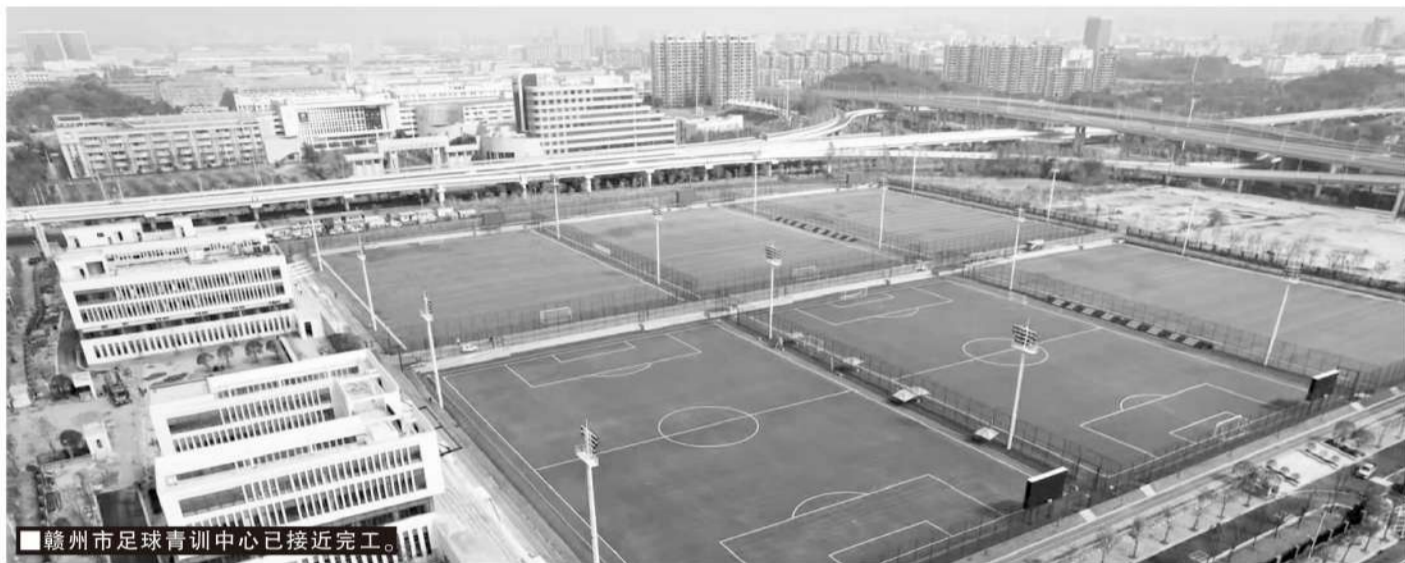
■赣州市足球青训中心已接近完工。

赣州市辖区内,定南和于都先后承办过中青赛,定南更是拥有国家青少年足球训练中心,可以说,定南和于都等地的区县足球的飞速发展,加上赣州市委、市政府的高度重视,是赣州市能够异军突起成为2025赛季“赣超”最大赢家的关键因素。