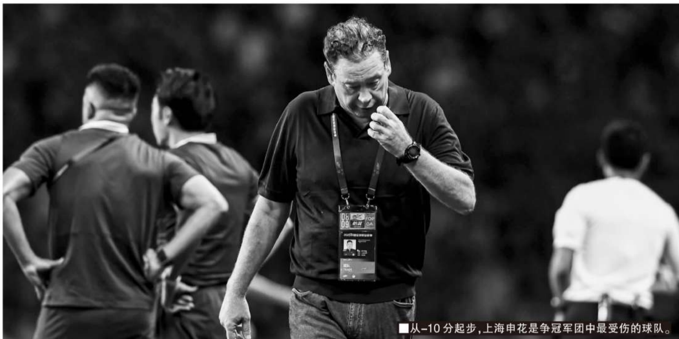
■从-10分起步，上海申花是争冠军团中最受伤的球队。

综合来看，成都蓉城拥有不小优势，但因自身变动大，目前不被外界特别看好他们能夺冠；上海申花受到的影响最大，联赛开局便落后5个竞争对手且分差不