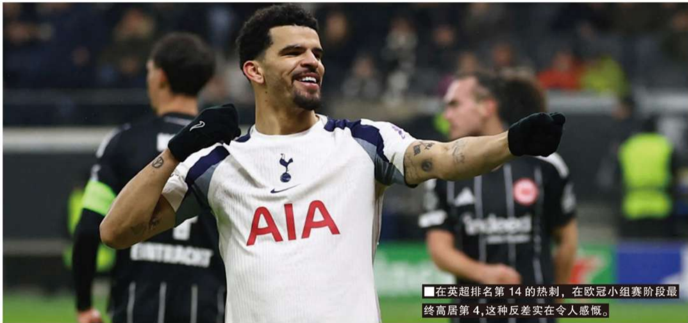
■在英超排名第14的热刺,在欧冠小组赛阶段最终高居第4,这种反差实在令人感慨。

撰稿/寒冰 当欧足联主席切费林看到本赛季欧冠联赛阶段积分榜时,恐怕会感到异常的尴尬。毕竟欧足联改制“瑞士轮”制的欧冠,绝不是为了让某个联赛的5支球队都跻身8强,直接晋级16强。甚至这个联赛的第6支球队,都险些能直通1/8决赛。