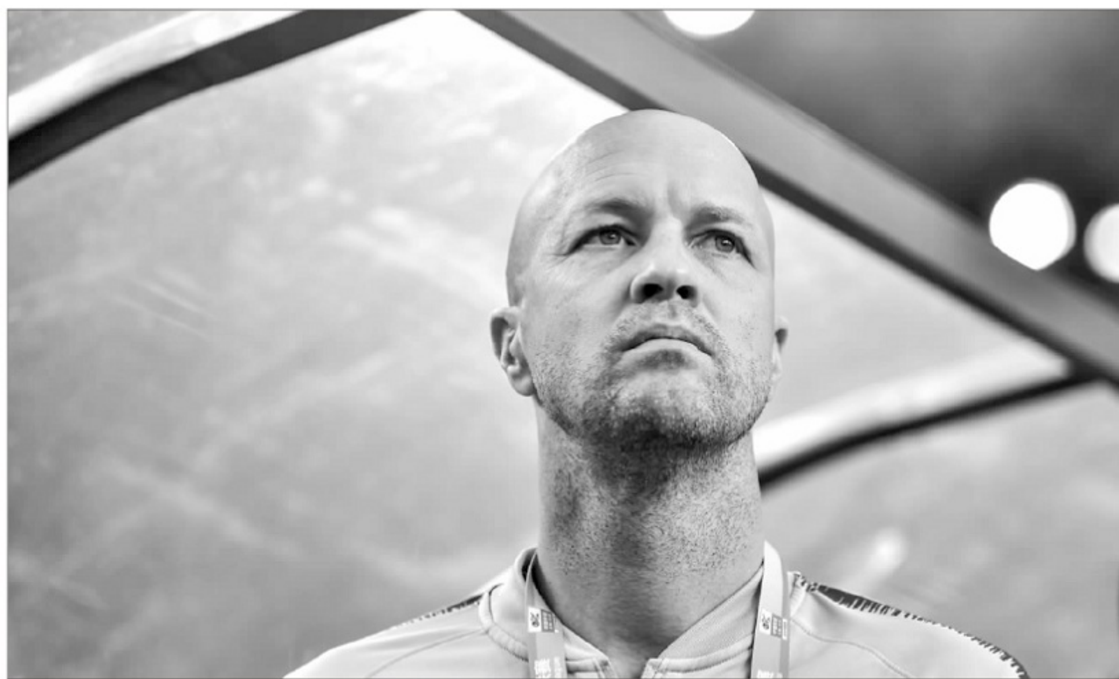
▲执教重庆时,小克赢得了不错的口碑。