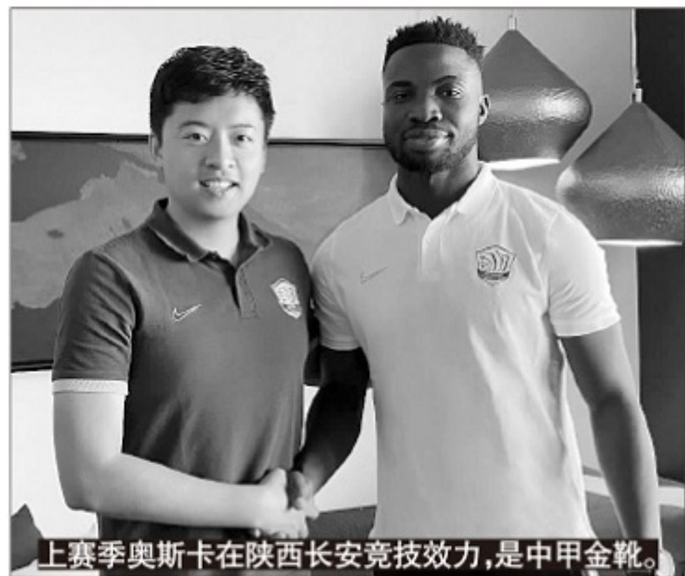
上赛季奥斯卡在陕西长安竞技效力，是中甲金靴。

此外，几位刚归化入籍的非华裔外援的去向，实际上将影响中超今年的格局。备受关注的高拉特还未取得为中国国家队效力的资格，但被广州恒大租借到河北华夏幸福，对这家因疫情导致外援无法归队，实力严重受损的北方球队而言，无异于雪中送炭。同样，阿兰入籍后去年被广州恒大租借到天津天海，今年被租借到北京国安，提升了北京国安的攻击力。