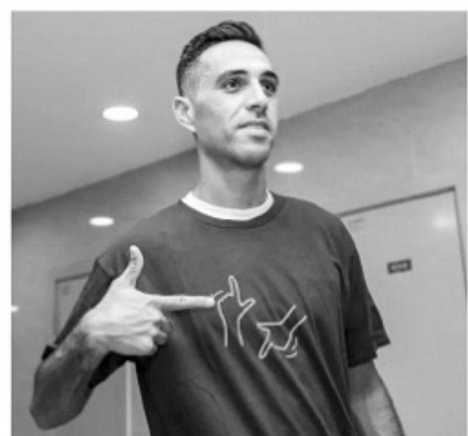
▲扎哈维庆祝进球的“打枪”手势,印上了他专属的时尚T恤上。