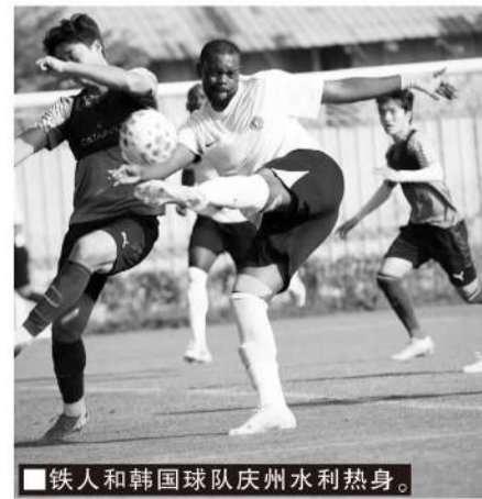
■铁人和韩国球队庆州水利热身。

可以说,俱乐部的运营理念、教练团队的专业能力、球员的竞技视野都在转变中得到提升,而热身赛对手类型增多,意味着中超俱乐部不再满足于圈内竞争,而是希望在与强手的对抗中寻找自身不足,寻求突破与成长。