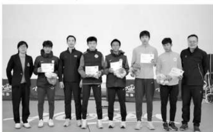
漳州冬训,冬训办公室为表现突出的人和队伍颁发奖励证书。

培训课涉及的内容包括:(一)鲁能泰山U14主教练华爽主持的实践示范课,以“前场进攻”为主题,通过现场示范引导球员在模拟比赛场景中提升球员边路及中路进攻配合能力;(二)苏炳添速度研究与训练中心理论及实践课,紧密围绕球员所处年龄段的身体特点,介绍了提升球员速度和耐力等关键身体素质的训练方法;(三)区楚良进行了现代守门员选材及阶段培养理论课,介绍了守门员选材需注重