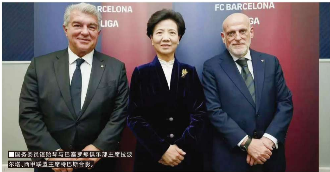
■国务委员谌贻琴与巴塞罗那俱乐部主席拉波尔塔、西甲联盟主席特巴斯合影。

中国足协主席宋凯表示：“为提升足球水平，中国政府已推出多项政策措施，他们在青训、基础设施等方面