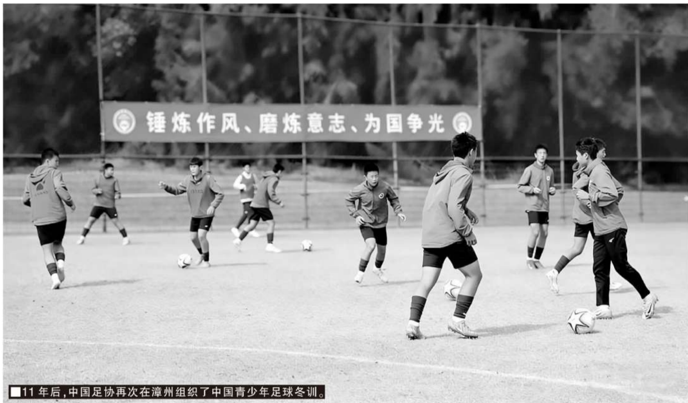
11年后,中国足协再次在漳州组织了青少年足球冬训。

多元性,且在培养过程中应抓住各年龄段发展敏感期,兼顾男女发育差异实施针对性训练;(四)为从技术层面提升青少年足球训练的科学性与高效性,助力教练团队实现精准化训练与科学化研判,冬训期间特邀数据公司与参训教练员开展专项分享,课上多数教练员提出目前面临的一大问题是如何解读体能及技战术数据,使之可以更好地指导训练比赛。