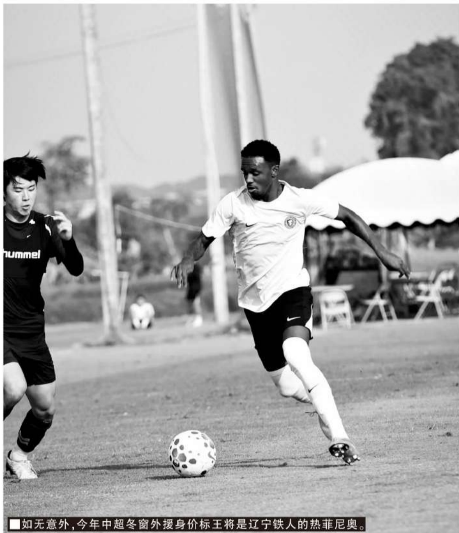
■如无意外,今年中超冬窗外援身价标王将是辽宁铁人的热菲尼奥。

去年中超仅有4家俱乐部冬窗引入外援的转会费支出为零,今年目前已有至少8家俱乐部冬窗引入外援的转会费支出为零,占据半壁江山,其中包括成都蓉城这样的财力相对雄厚的“顶层”俱乐部。今年引援质量明显好于去年的深圳新鹏