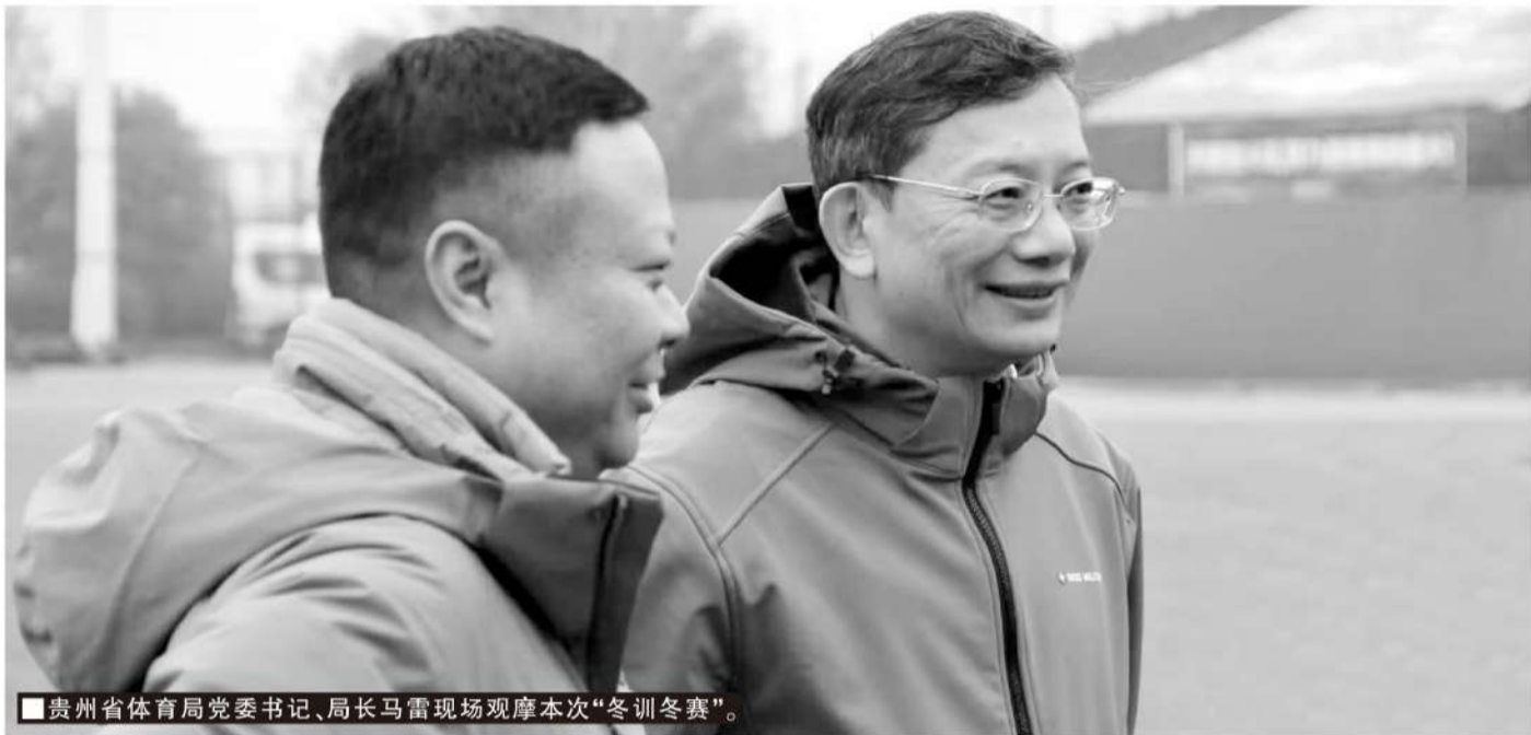
贵州省体育局党委书记、局长马雷现场观摩本次“冬训冬赛”。

毕节入选“西部青训试点”后,贵州省体育局迅速构建了“一主四辅”的区域布局,以“西部青训试点”毕节为主,贵阳、遵义、黔东南州和黔西南州为辅。在国家政策和国家、省级配套资金的支持下,毕节市级青训中心等项目开始全面建设,从硬件上保证毕节足球青训的发展。软件上,贵州省体育局充分发挥统筹、调度功能,从传统优势地区贵阳向毕节输出高水平青训教练,一方面助推省内高水平社会青训俱乐部落地毕节,另一方面强化毕节本地青训教练培