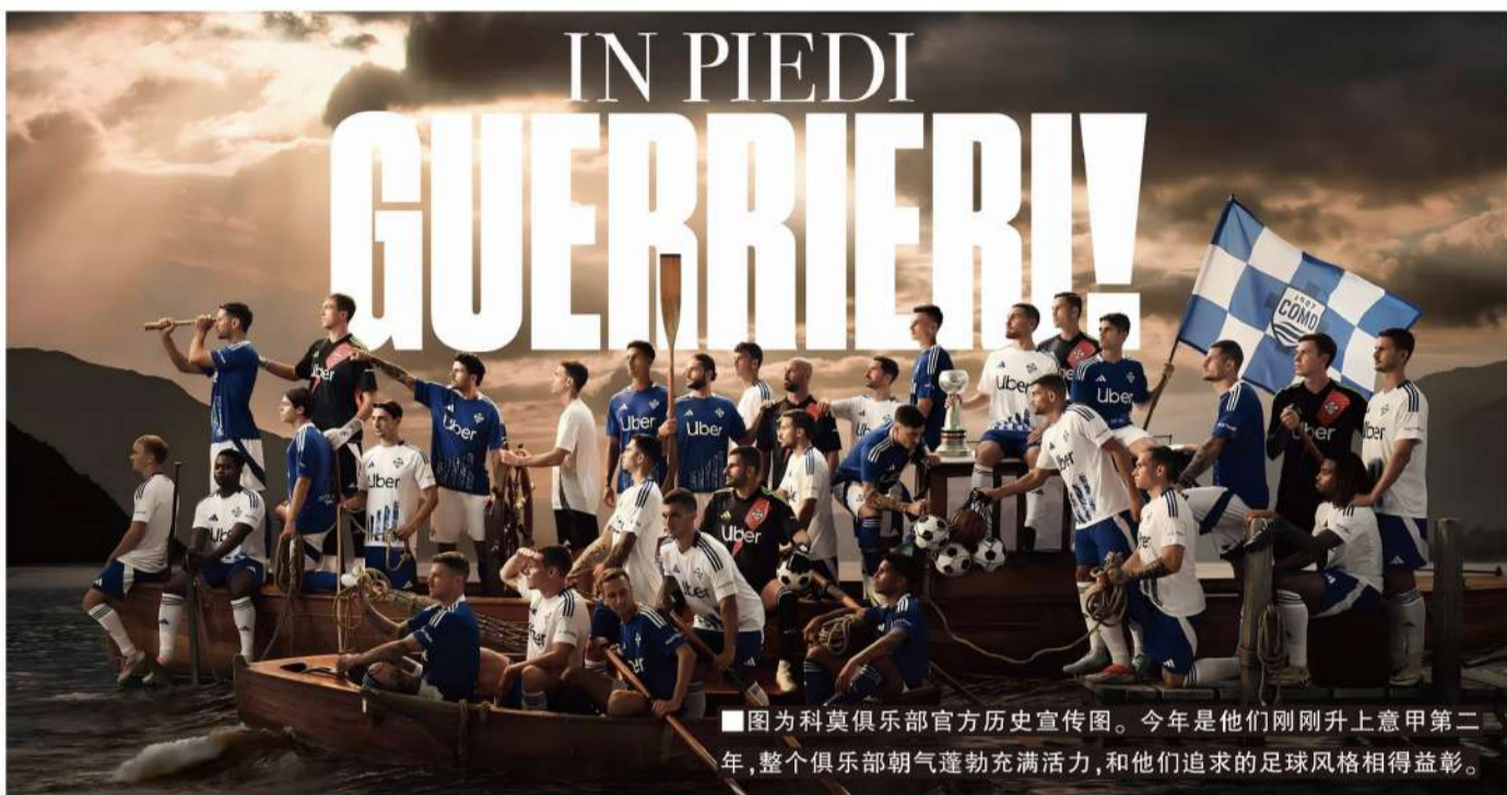
■图为科莫俱乐部官方历史宣传图。今年是他们刚刚升上意甲第二年,整个俱乐部朝气蓬勃充满活力,和他们追求的足球风格相得益彰。

撰稿/寒冰 意甲足球的传统代表北方三强集体式微,倒是两支“小城”球队作为“反意甲足球”代表,分别在欧冠和意甲搅动风云。不仅为一潭死水的意甲注入高位逼抢和攻势足球的激情,也让意甲看到复兴的希望。只是这样的希望不像其他联赛由豪门带动,引领一时风气之先的反倒是两座小城。