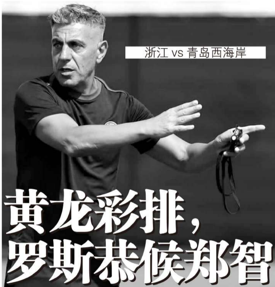
浙江 vs 青岛西海岸

云南玉昆 VS 青岛海牛,浙江队 VS 青岛西海岸,四支队伍都是新帅,却都是中超老熟人。乔迪、米兰自不用说,在冠军上海海港担任两年助教今年首次担任中超主帅的罗斯·阿洛伊西,以及时隔近三年重返中超教练席的郑智,新赛季的表现都值得期待,他们的起步也更让人关注。