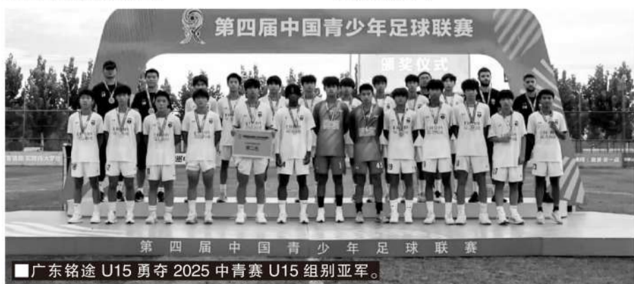
广东铭途 U15 勇夺 2025 中青赛 U15 组别亚军。

我在广州足球的十年应该是很成功的，自己的家庭和生活也很幸福，可以说那是我最快乐的十年。既然感受过那种快乐，体验过那种幸福，我们为什么不再努力创造一个这样的环境，让大家重新体验那种纯粹以足球为中心的快乐呢？我们要努力将球迷重新吸引回球场，让他们为球队加油，让他们享受每场比赛的过程。我希望，这种氛围尽快回来。