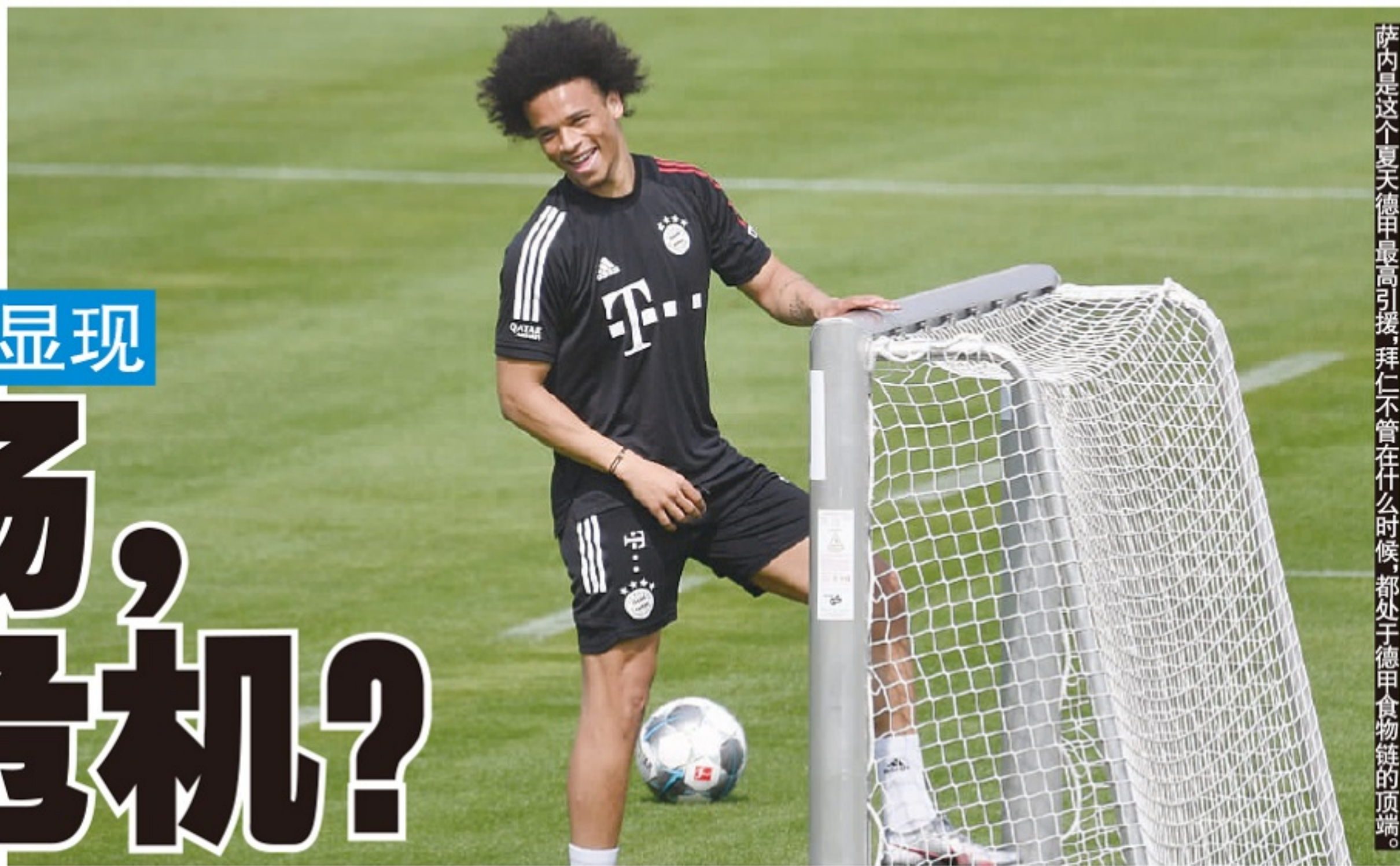
萨内是这个夏天德甲最高引援,拜仁不管在什么时候,都处于德甲食物链的顶端。

德甲最早复赛,也最早结束。按照常理,赛季结束后,就是各俱乐部人员进出的繁忙期。但现在,转会市场上的交易频率比过去低得多。背后原因很简单:新冠疫情下,多数俱乐部在缩小阵容,降低未来的人员支出。这一方面确实提高了转会市场上的球员“供给量”,可是“消费端”同样明显萎缩,甚至有转会市场“流动性不足”的状态。令人担忧的是,或许转会市场大萎缩将从德甲慢慢扩张到整个欧洲足坛。